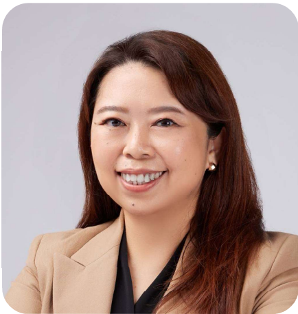
元智大學助理教授 兼管院雙語教學推動資源中心 (EMI)主任

政治大學企業管理系兼任講師 台灣聯合利華品牌副理 台灣E-ICP生活型態資料庫分析