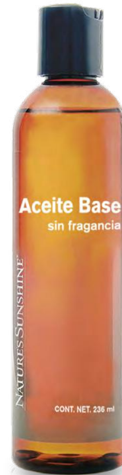
Aviso de Publicidad No.: 163300202D0243

Tipo de Esencia: MEZCLAS Stock No. 3874 REV 1018 INGREDIENTES: Mezcla de aceites esenciales 100% puros de flor de Lavandula angustifolia , cáscara de Citrus sinensis , madera de Cedrus atlantica , flor de Cananga odorata , hoja y flor de Tanacetum annuum y oleoresina de Vanilla planifolia . MODO DE USO: PARA USO TÓPICO Y AROMÁTICO SOLAMENTE. Para uso tópico diluir en aceite base antes de su aplicación. No usar durante el embarazo. No usar cerca de los ojos o nariz. Mantener fuera del alcance de los niños. Mantener en un lugar fresco y oscuro. Importado y Distribuido por: Nature's Sunshine Products de México, S.A. de C.V., Avenida Cafetales 318, Planta Baja Torre A, Local C-1, Colonia Granjas Coapa, Delegación Tlalpan, C.P. 14330, Ciudad de México, México. Lote: Impreso en el envase Manufacturado en Estados Unidos