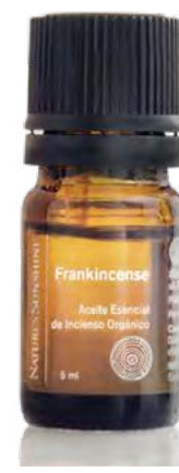
Aviso de Publicidad No.: 163300202D0243