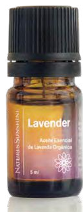
Aviso de Publicidad No.: 163300202D0243