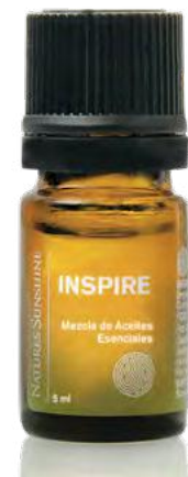
Aviso de Publicidad No.: 163300202D0243

Para uso tópico y aromático solamente. Para uso tópico diluir en aceite base antes de su aplicación.