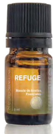
Aviso de Publicidad No.: 163300202D0243

Para uso tópico y aromático solamente. Para uso tópico diluir en aceite base antes de su aplicación.