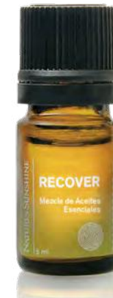
Aviso de Publicidad No.: 163300202D0243

Para uso tópico y aromático solamente. Para uso tópico diluir en aceite base antes de su aplicación.