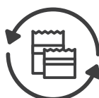
Adición o reposición de sustratos y acolchados