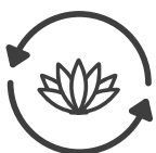
Reposición de plantas muertas