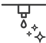
Mantenimiento del sistema de riego