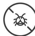
Control preventivo y correctivo contra plagas y enfermedades