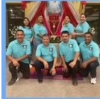
Alavanza Profetas de esperanza