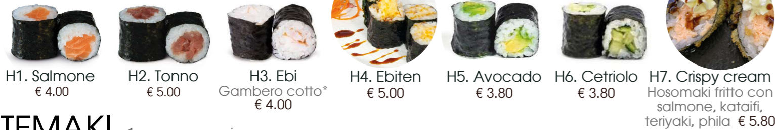
H1. Salmone € 4.00 H2. Tonno € 5.00 H3. Ebi Gambero cotto* € 4.00 H4. Ebiten € 5.00 H5. Avocado € 3.80 H6. Cetriolo € 3.80 H7. Crispy cream Hosomaki fritto con salmone, kataifi, teriyaki, phila € 5.80