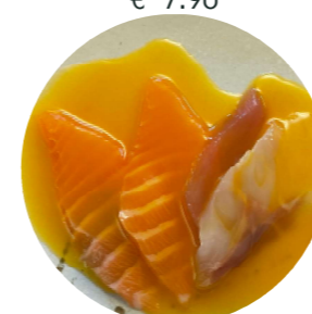
TA11. Carpaccio misto mango Carpaccio di salmone, tonno, branzino, salsa mango € 8.90