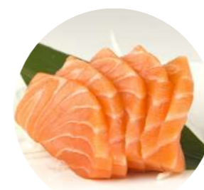
SA1. Salmone € 7.90