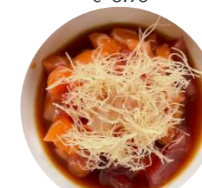
TA3. Tartar crispy mix Tartar di salmone, tonno, branzino, salsa ponzu, kataifi € 8.90