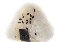
C1. Spicy salmon Tartare spicy salmon, erba cipollina, tobiko, salsa spicy, sesamo € 3.50 C2. Spicy tuna Tartar spicy tuna, erba cipollina, tobiko, salsa spicy, sesamo € 4.00 C3. Salmon cream special Salmone, philadelphia, sesamo € 3.50 C4. Tuna mayo Tonno, maionese, sesamo € 4.00