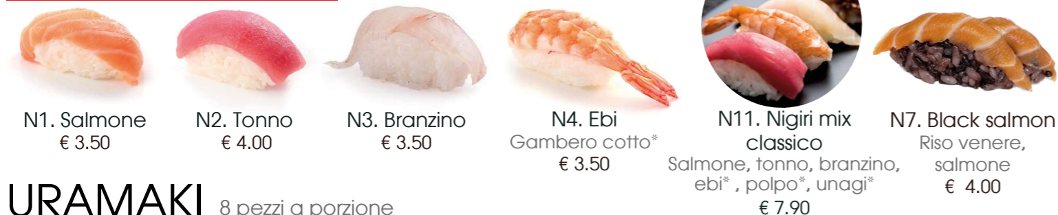
N1. Salmone € 3.50 N2. Tonno € 4.00 N3. Branzino € 3.50 N4. Ebi Gambero cotto* € 3.50 N11. Nigiri mix classico Salmone, tonno, branzino, ebi*, polpo*, unagi* € 7.90 N7. Black salmon Riso venere, salmone € 4.00