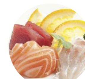
SA4. Sashimi mix Salmone, tonno, branzino € 8.90