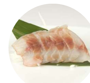
SA3. Branzino € 6.90