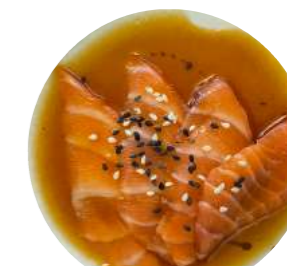
TA7. Salmone Salmone, sesamo, salsa ponzu € 7.90