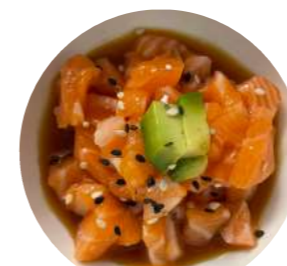
TA1. Salmone Salmone, sesamo, avocado, salsa ponzu € 7.90