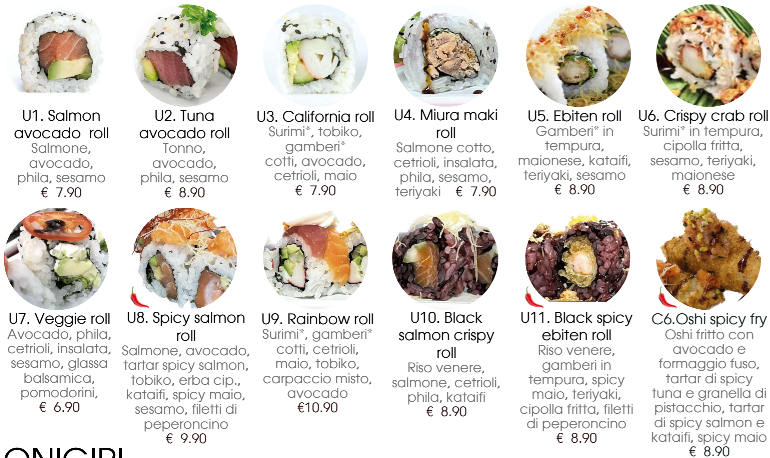
U1. Salmon avocado roll Salmone, avocado, phila, sesamo € 7.90 U2. Tuna avocado roll Tonno, avocado, phila, sesamo € 8.90 U3. California roll Surimi*, tobiko, gamberi* € 7.90 U4. Miura maki roll Salmone cotto, cetrioli, insalata, phila, sesamo, teriyaki € 7.90 U5. Ebiten roll Gamberi* in tempura, maionese, kataifi, teriyaki, sesamo € 8.90 U6. Crispy crab roll Surimi* in tempura, cipolla frita, sesamo, teriyaki, maionese € 8.90 U7. Veggie roll Avocado, phila, cetrioli, insalata, sesamo, glassa balsamica, pomodorini, € 6.90 U8. Spicy salmon roll Salmone, avocado, tartar spicy salmon, tobiko, erba cip., kataifi, spicy maio, sesamo, filetti di peperoncino € 9.90 U9. Rainbow roll Surimi*, gamberi* cotti, cetrioli, maio, tobiko, carpaccio misto, avocado € 10.90 U10. Black salmon crispy roll Riso venere, salmone, cetrioli, phila, kataifi € 8.90 U11. Black spicy ebiten roll Riso venere, gamberi in tempura, spicy maio, teriyaki, cipolla frita, filetti di peperoncino € 8.90 C6. Oshi spicy fry Oshi fritto con avocado e formaggio fuso, tartar di spicy tuna e granella di pistacchio, tartar di spicy salmon e kataifi, spicy maio € 8.90