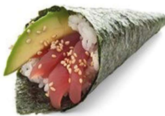
T1. Salmone Salmone, avocado, maionese, insalata € 4.00 T2. Tonno Tonno, avocado, maionese, insalata € 4.50 T3. Ebiten Gambero* in tempura, maio, insalata, avocado, teriyaki € 4.50 T4. Spicy salmon Tartar spicy salmon, avocado, erba cipollina, tobiko, spicy maio € 4.50 T5. Spicy tuna Tartar spicy tuna, avocado, erba cipollina, tobiko, spicy maio € 4.50 T6. Vegetariano Insalata, avocado, cetrioli, maionese € 3.80