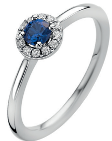
ZIR 2697B 79. 95