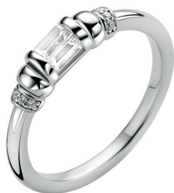
ZIR 2812 49.95