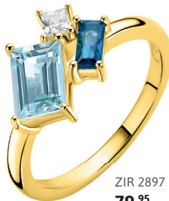
ZIR 2897 79.95