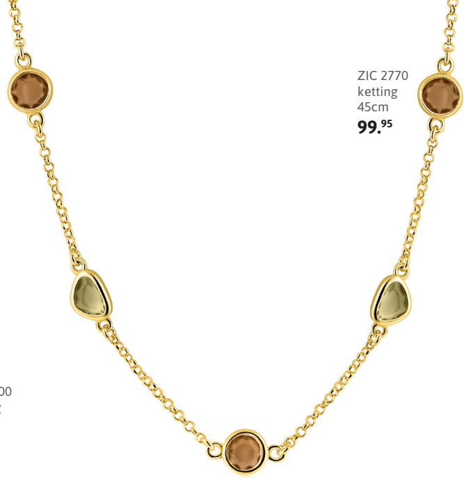
ZIC 2770 ketting 45cm 99.95