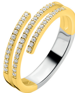
ZIR 2727Y 69. 95