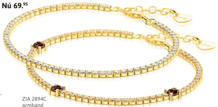
ZIA 2894C armband 99. 95