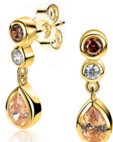
ZIO 2900 oorstekers 19mm 69.95