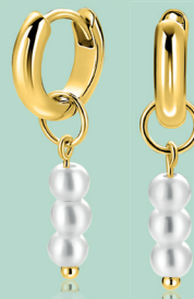
ZICH2734Y oorbels 18mm 34. 95 p.pr