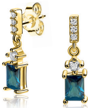
ZIO 2896 oorstekers 19mm 69.95