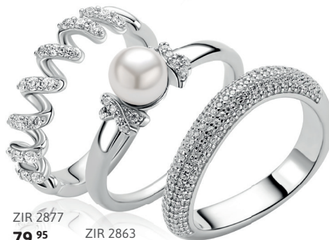
ZIR 2877 79. 95