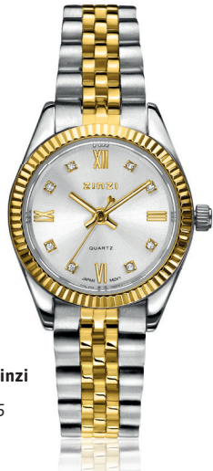
ZIW 2733 watch 24mm 'Mini Iconic bicolor' 139.-*

*Nu met gratis zilveren Zinzi armband t.w.v. 34,95