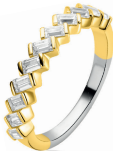
ZIR 2829 64. 95