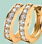
ZIO 191Y 15 x 3mm Nú 49.95