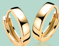
ZIO 191G 15 x 3mm 39.95