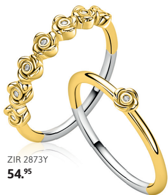
ZIR 2873Y 54. 95

Bloemvormen, frisse groentinten en verfijnde details brengen het gevoel van een zonnige lentedag tot leven. Met een knipoog naar de iconische klaver die al jarenlang symbool staat voor elegantie.