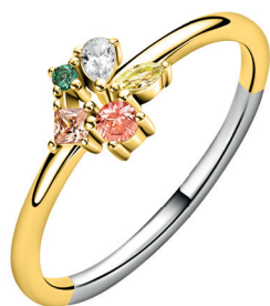
ZIR 2867 49. 95

Kleurrijke details en speelse vormen brengen flower power naar iedere zomerse look.