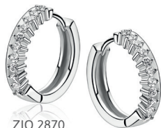
ZIO 2870 oorringen 15x3mm 59. 95