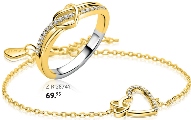
ZIR 2874Y 69. 95