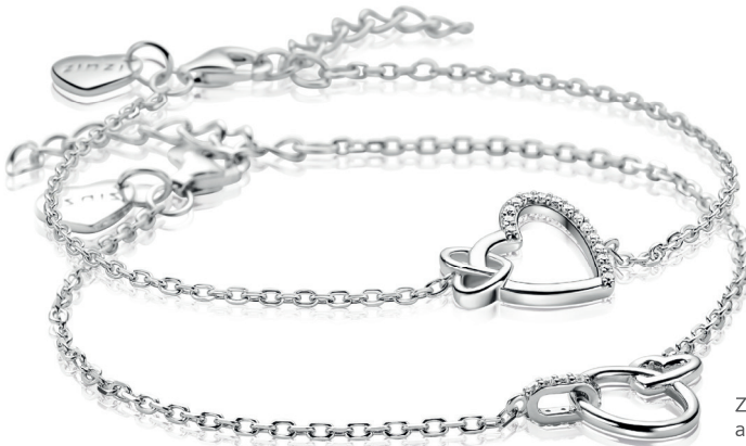
ZIA 2874 armband 69. 95