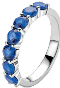
ZIR 2888B 69. 95

Diepblauwe stenen en koel zilver vangen de sfeer van de Middellandse Zee op een perfecte zomerdag.