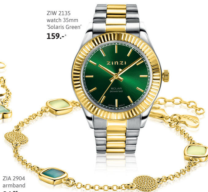
ZIW 2135 watch 35mm 'Solaris Green' 159.-*