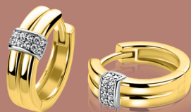
ZIO 2830 oorringen 15mm 79. 95