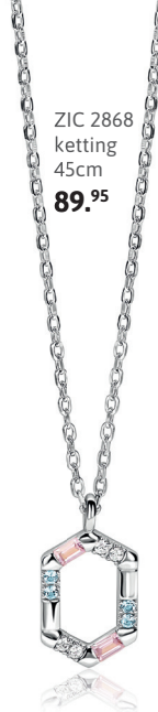
ZIC 2868 ketting 45cm 89. 95