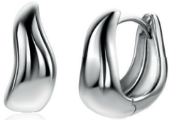
ZIO 2609 oorringen 15 x 6,5mm 94. 95