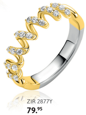
ZIR 2877Y 79.95