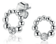
ZIO 2817 oorstekers 8mm 42. 95