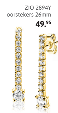
ZIO 2894Y oorstekers 26mm 49. 95