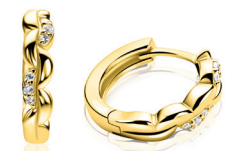
ZIO 2875 oorringen 13x3mm 54. 95