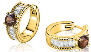
ZIO 2880 oorringen 15x5mm Nú 99. 95