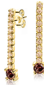
ZIO 2894C oorstekers 26mm 49. 95