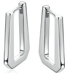
ZIO 2879 oorringen 19x2mm 89. 95