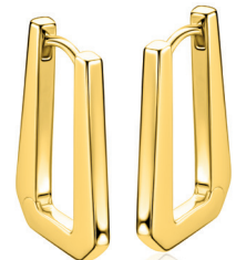
ZIO 2879G oorringen 19x2mm 89.95