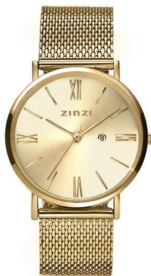
ZIW 510M watch 34mm 'Roman Gold' 119.-*