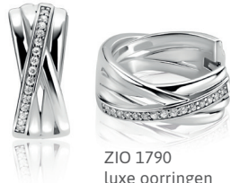
ZIO 1790 luxe oorbellen 17 x 7mm

Krachtige sieraden waarin lijnen elkaar kruisen. De uitstraling van meerdere ringen in één.