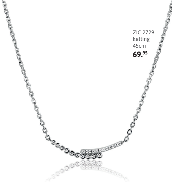
ZIC 2729 ketting 45cm 69. 95