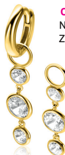
ZICH 2593Y oorbedels 24mm Nú 49.95 p.pr