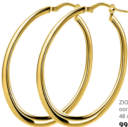
ZIO 2701G oorsieraden 48 x 2mm 99. 95

Deze oorkingen hebben een scharnierend mechanisme, waarbij een gebogen buisje door het oor gaat. Deze klikt vast in de V-vormige sluiting. Deze 'Italiaanse sluiting' is subtiel en onopvallend.