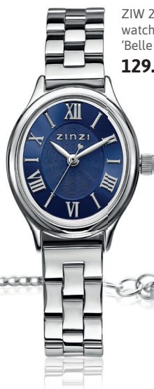
ZIW 2955 watch 26mm 'Belle Ovale Blue' 129.-*