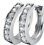
ZIO 191Z oorringen 15mm Nú 49. 95