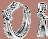
ZIO 2505 oorringen 16,5mm 89. 95