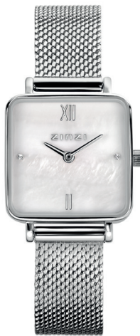
ZIW 1717 Stalen watch 22mm 'Square Mini Pearl' 99.-*