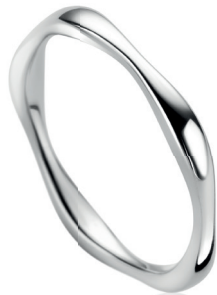
ZIR 2610 Nú 34. 95