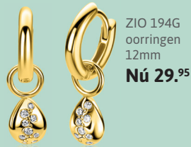
ZIO 194G oorringen 12mm Nú 29. 95