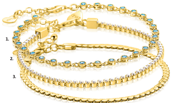
1. ZIA 2893BG 89.95 | 2. ZIA 2910 Nú 69.95 | 3. ZIA 2647G Nú 59.95