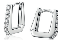
ZIO 2878 oorringen 12x2mm Nú 49. 95