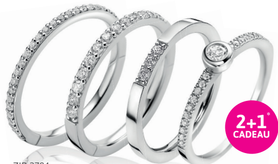
ZIR 2794 49. 95

Slanke silhouetten, fonkelende zirconia's en tijdloze ontwerpen. Verfijnde zilveren ringen die moeiteloos combineren en elke dag een vleugje luxe toevoegen. En bij aankoop van 2 aanschuifringen, krijg je de 3e ring cadeau!*