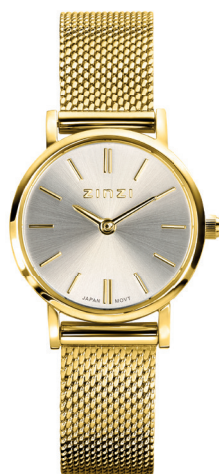
ZIW 1833 watch 24mm 'Retro Mini Gold' 109.-*