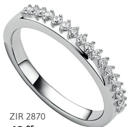
ZIR 2870 49. 95