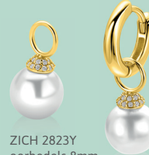
ZICH 2823Y oorbels 8mm 29. 95 p.pr