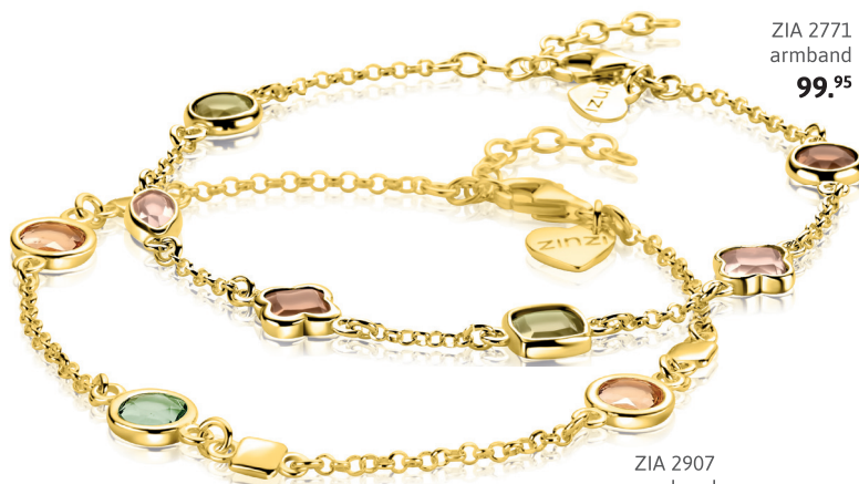
ZIA 2771 armband 99. 95