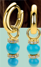
ZICH 2864T oorbels 11mm 39. 95