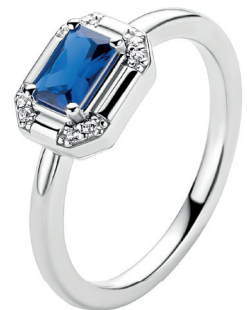
ZIR 2803B 69. 95