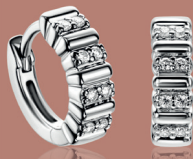
ZIO 2686 oorringen 14mm 69. 95