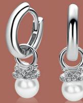
ZICH 2863 oorbedels parel 5mm 34. 95