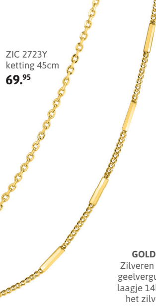
ZIC 2723Y ketting 45cm 69. 95