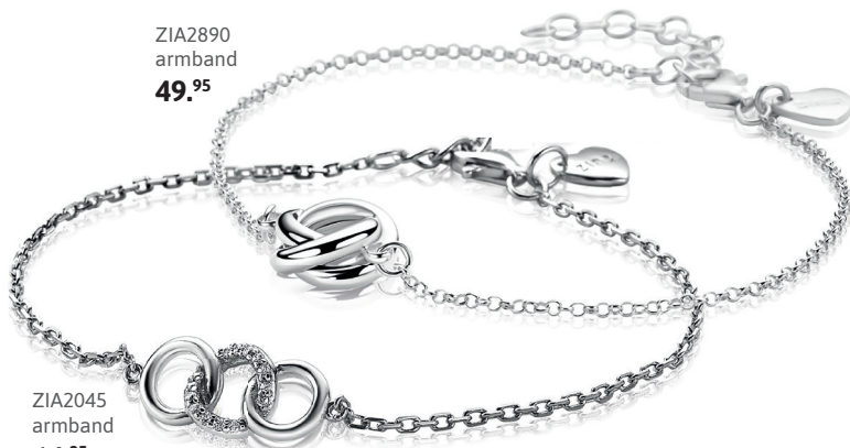
ZIA2890 armband 49. 95