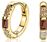
ZIO 2869 oorringen 13x2mm 54.95