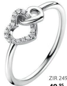
ZIR 2493 49. 95