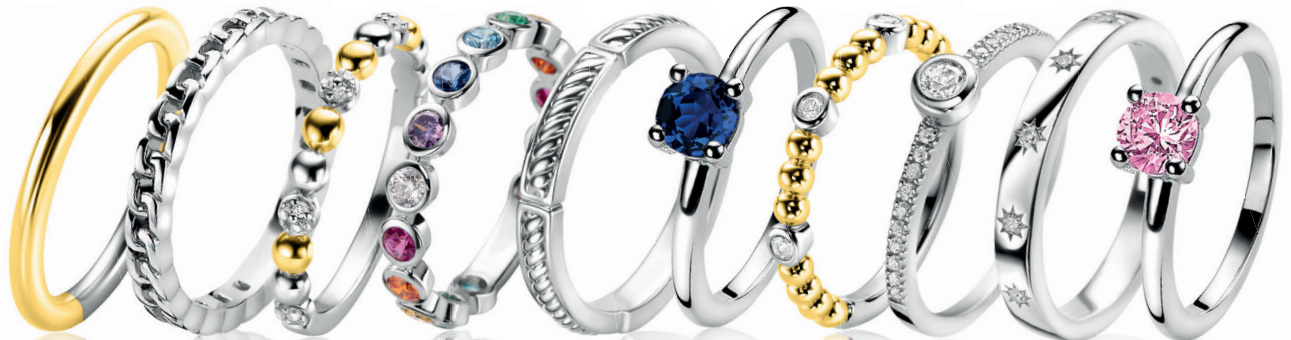
ZIR 2554G 44.95 ZIR 1175 44.95 ZIR 2393 59.95 ZIR 2599 79.95 ZIR 2395 54.95 ZIR 1300Q 44.95 ZIR 2569 59.95 ZIR 2422 59.95 ZIR 2491 59.95 ZIR 1300R 44.95