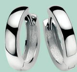
ZIO 191 15 x 3mm 39.95

Deze zilveren oorbedels met parels bevestigen je met gemak aan je oorringen met luxe scharniersluiting.