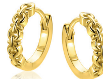
ZIO 2802 oorringen 15mm 59. 95

Zilveren oorringen met extra zekere scharniersluiting. Gemakkelijk in je oor te bevestigen door het simpel dichtklikken van de sluiting.