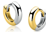
ZIO 2835 oorringen 12mm Nú 39. 95

Aan twee zijden te dragen, dus dubbel draagplezier!