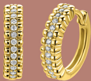
ZIO 2834Y oorringen 16mm 79. 95

Deze zilveren oorringen hebben een luxe scharniersluiting . Gemakkelijk in je oor te bevestigen door het simpel dichtklikken van de sluiting. Zinzi heeft de ruimste collectie zilveren oorringen van Nederland.