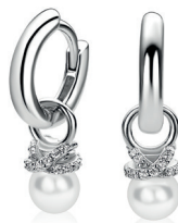
ZICH 2863 oorbels parel 5mm 34. 95