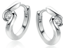
ZIO 2766 oorringen 14 x 4,5mm Nú 49. 95