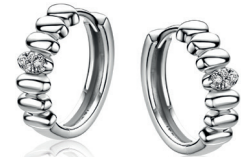
ZIO 2876 oorkingen 15x4mm 49. 95