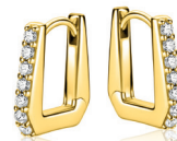
ZIO 2878Y oorringen 12x2mm 54.95