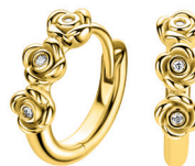
ZIO 2873Y oorringen 13x4mm 49. 95