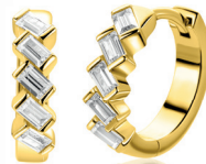
ZIO 2829 oorringen 15 x 4mm 74. 95