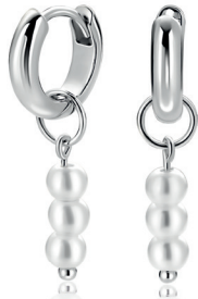
ZICH 2734 oorbedels 18mm 34. 95 p.pr

Vandaag aan je oorbellen, morgen aan je ketting. Deze bedels wisselen moeiteloos met je mee.