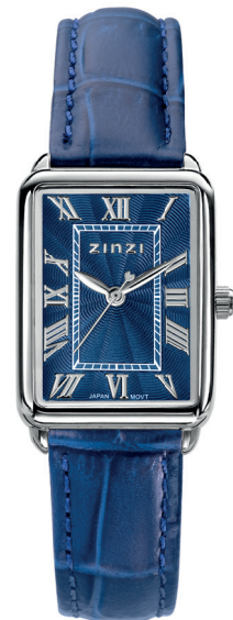
ZIW 1955B watch 28mm 'Elegance Blue' 119.-*