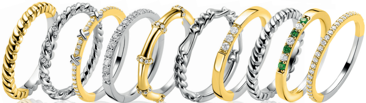
ZIR 2688G 49.95 ZIR 2320 69.95 ZIR 2814 59.95 ZIR 2795 59.95 ZIR 2687Y 59.95 ZIR 2291 49.95 ZIR 2130Y 54.95 ZIR 2688 49.95 ZIR 2557 59.95 ZIR 2794Y 49.95