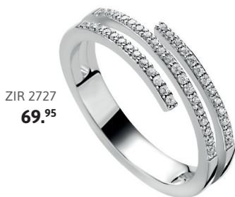
ZIR 2727 69. 95