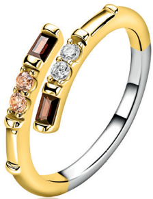
ZIR 2869 59.95

Waar geometrie en glamour elkaar ontmoeten. Gold plated zilveren sieraden met een moderne uitstraling en een knipoog naar de seventies. Warme bruine accenten maken de look compleet.