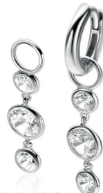
ZICH 2593 oorbedels 24mm Nú 49. 95 p.pr