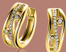
ZIO 2685 oorringen 16mm 94. 95