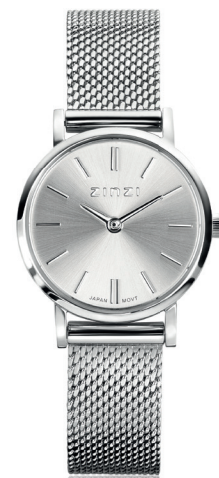
ZIW 1802 Stalen watch 24mm 'Retro Mini Silver' 99.-*