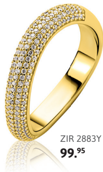
ZIR 2883Y 99.95