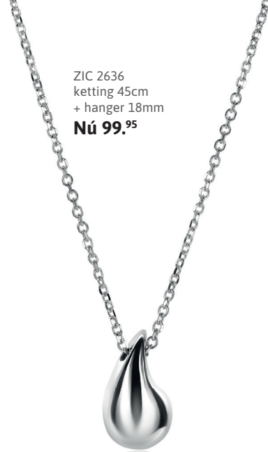
ZIC 2636 ketting 45cm + hanger 18mm Nú 99. 95