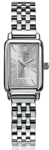
ZIW 2802 watch 22mm 'Small Elegance silver' 129.-*