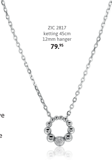
ZIC 2817 ketting 45cm 12mm hanger 79. 95

Het enige blauw waar wij een overwinning mee vieren. Van diepblauwe wijzerplaten tot fonkelende zirconia's: deze frisse kleurcombinaties brengen meteen de sfeer van centre court naar je look. Sportief en stijlvol.