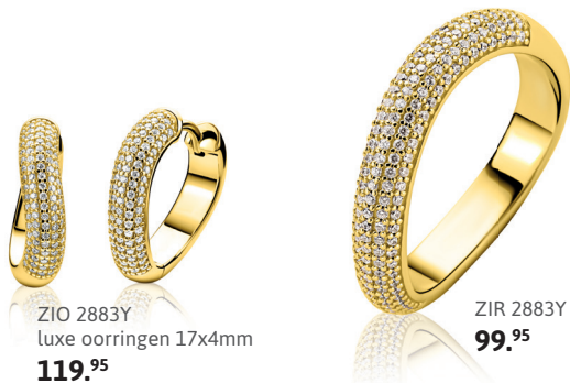
ZIO 2883Y luxe oorringen 17x4mm 119.95