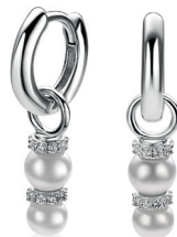
ZICH 2864 oorbels 11mm 39. 95