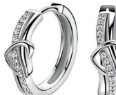
ZIO 2874 oorringen 15x5mm 59. 95