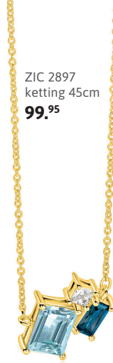
ZIC 2897 ketting 45cm 99.95