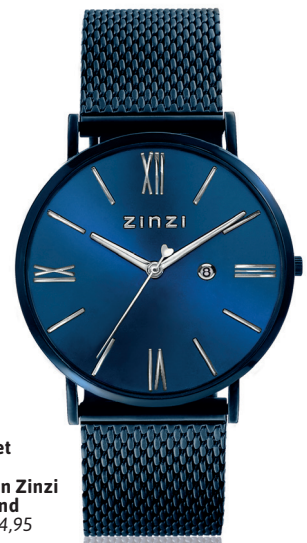
ZIW 551M watch 34mm 'Roman blue' 119.-*

*Nu met gratis zilveren Zinzi armband t.w.v. 34,95