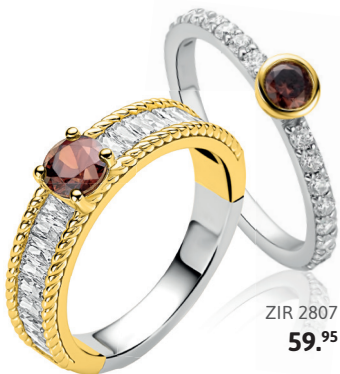
ZIR 2807 59. 95