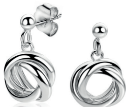
ZIO 2890 oorstekers 16mm 49. 95