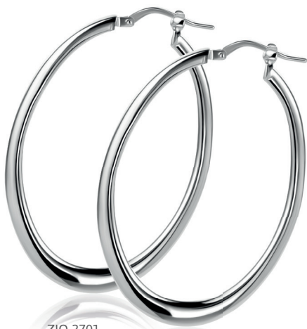
ZIO 2701 oorkingen 48 x 2mm 99. 95