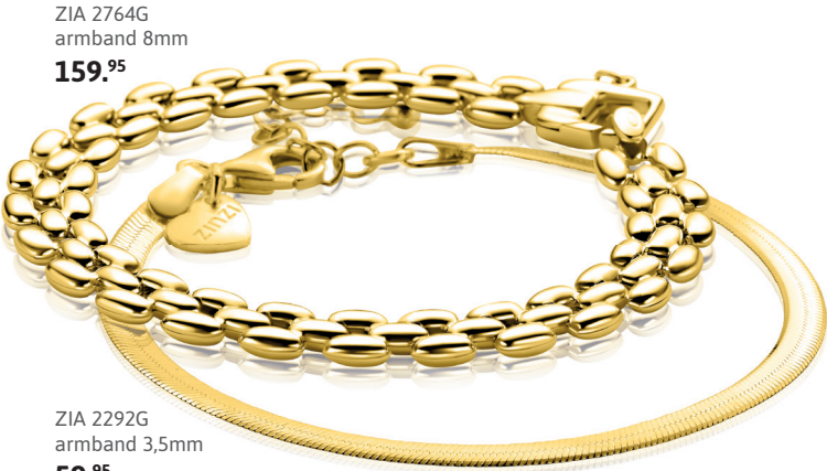
ZIA 2764G armband 8mm 159. 95

MINI ICONIC Klein van formaat, groot in uitstraling. Met hun 24mm kast en fonkelende witte crystals zijn deze horloges pure polsluxe.