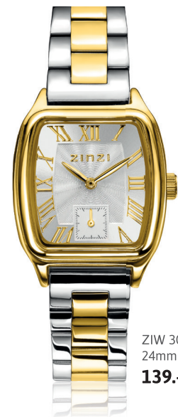
ZIW 3033 24mm 139.-*