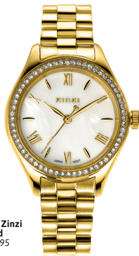
ZIW 2434 watch 32mm 'Tresor Pearl Gold' 159.-*

*Nu met gratis zilveren Zinzi armband t.w.v. 34,95