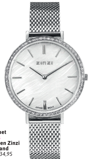
ZIW 1317 watch 34mm 'Grace Silver' 139.-*

*Nu met gratis zilveren Zinzi armband t.w.v. 34,95