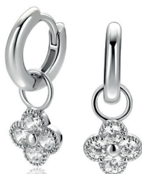
ZICH 2735 oorbedels 8mm Nú 49.95 p.pr

Hartjes, klavers en zachte blauwtinten maken deze collectie net zo persoonlijk als stijlvol. Kleine symbolen die geluk, liefde en herinneringen dichtbij houden.