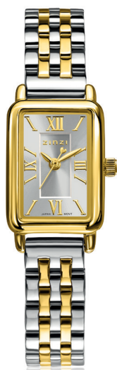
ZIW 2833 watch 22mm 'Small Elegance' 139.-*