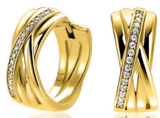
ZIO 1790Y luxe oorringen 17 x 7mm 99. 95