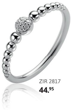
ZIR 2817 44. 95