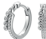
ZIO 2729 oorkingen 15mm 54. 95