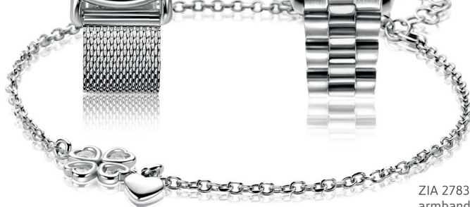
ZIA 2783 armband 49.95

*Nu met gratis zilveren Zinzi armband t.w.v. 34,95