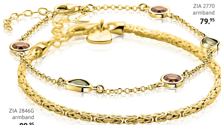
ZIA 2770 armband 79.95