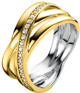
ZIR 1790Y 99. 95