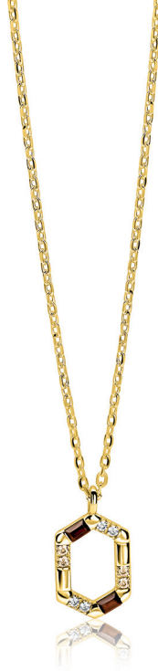
ZIC 2869 ketting 45cm 18mm 89.95