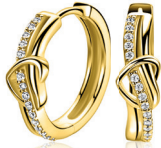
ZIO 2874Y oorringen 15x5mm 59. 95