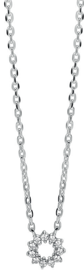
ZIC 2870 ketting 45cm zon 8mm 69. 95

Fatima laat zien hoe één ketting mooi kan zijn, maar meerdere samen nét wat spannender worden. Door verschillende lengtes te combineren ontstaat een speelse look met een vleugje seventies glamour.