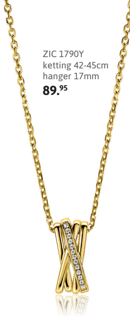
ZIC 1790Y ketting 42-45cm hanger 17mm 89. 95