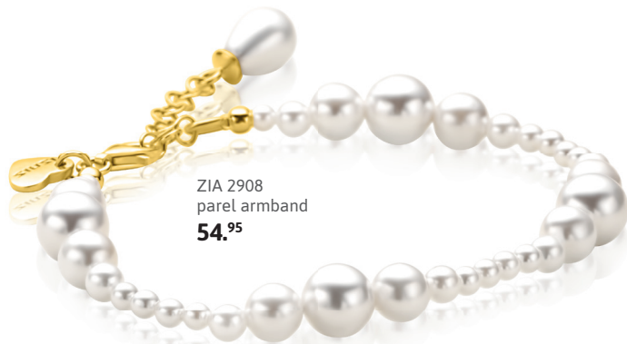
ZIA 2908 parel armband 54. 95