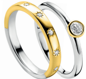
ZIR 2491Y 59.95 ZIR 1177Y 44.95