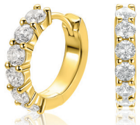
ZIO 2888Y luxe oorringen 15x3mm 79. 95