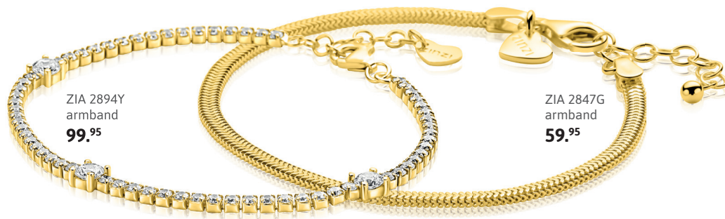
ZIA 2894Y armband 99. 95