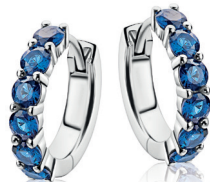
ZIO 2888B oorringen 15x3mm 79. 95