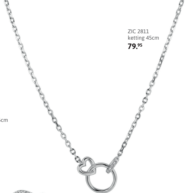
ZIC 2811 ketting 45cm 79. 95