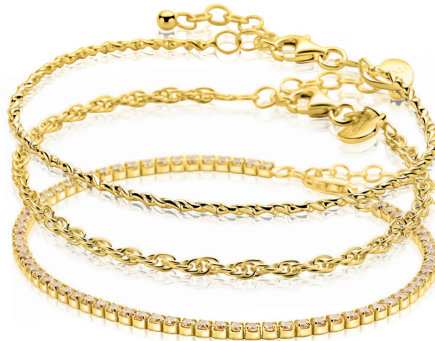
ZIA 2843G armband Nú 39.95