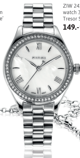
ZIW 2417 watch 32mm 'Tresor Silver' 149.-*