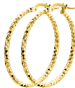
ZIO 2911G oorsieraden 32 x 2mm 54. 95