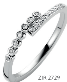
ZIR 2729 44. 95