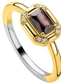
ZIR 2803 74.95