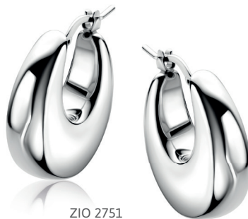
ZIO 2751 oorkingen 22mm Nú 99. 95