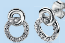
ZIO 2045 | 11mm 54. 95