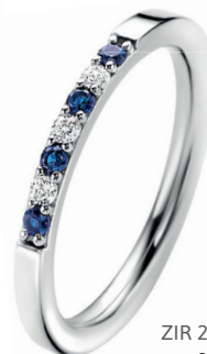
ZIR 2559 59.95