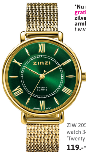
ZIW 2054 watch 34mm 'Twenty Green' 119.-*

*Nu met gratis zilveren Zinzi armband t.w.v. 34,95