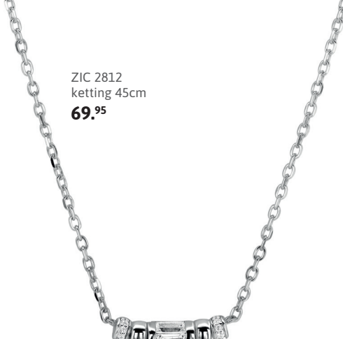
ZIC 2812 ketting 45cm 69.95