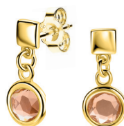
ZIO 2907 oorstekers 16mm 39. 95