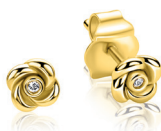
ZIO 2872Y oorstekers 6mm 34. 95