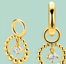
ZICH 2816 oorbels 10mm 42. 95 p.pr