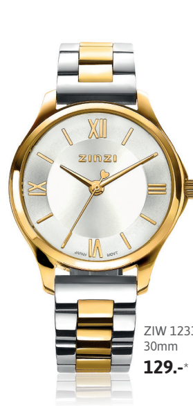
ZIW 1233 30mm 129.-*