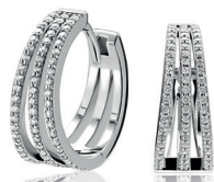
ZIO 2727L luxe oorkingen 18mm Nú 99. 95