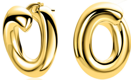
ZIO 2903G oorringen 25mm 129. 95