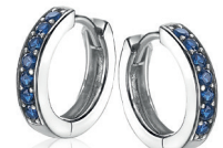
ZIO 191DB oorringen 15mm Nú 49. 95