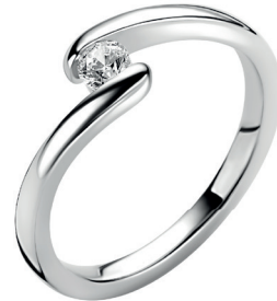
ZIR 2766 Nú 49. 95