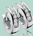
ZIO 187Z 12 x 3mm 44.95