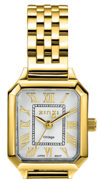
ZIW 2633 watch 24mm 'Vintage gold' 139.-*

*Nu met gratis zilveren Zinzi armband t.w.v. 34,95