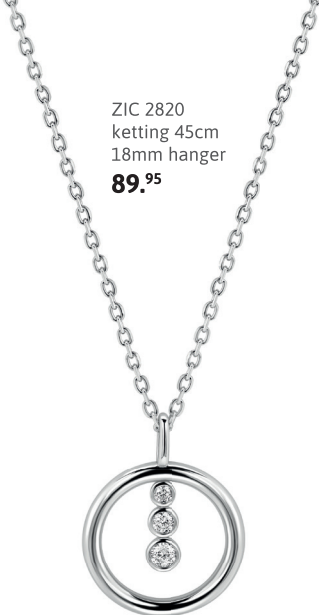
ZIC 2820 ketting 45cm 18mm hanger 89. 95

Net als op het centre court draait het hier om klasse. Amaka combineert glanzend zilver met verfijnde zirconia's en tijdloze horloges voor een je ne sais quoi look. Van de eerste opslag tot de laatste zonnestralen.