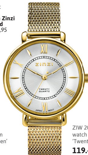
ZIW 2033 watch 34mm 'Twenty Gold' 119.-*

*Nu met gratis zilveren Zinzi armband t.w.v. 34,95