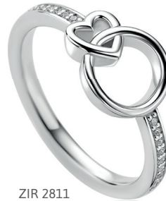
ZIR 2811 54. 95