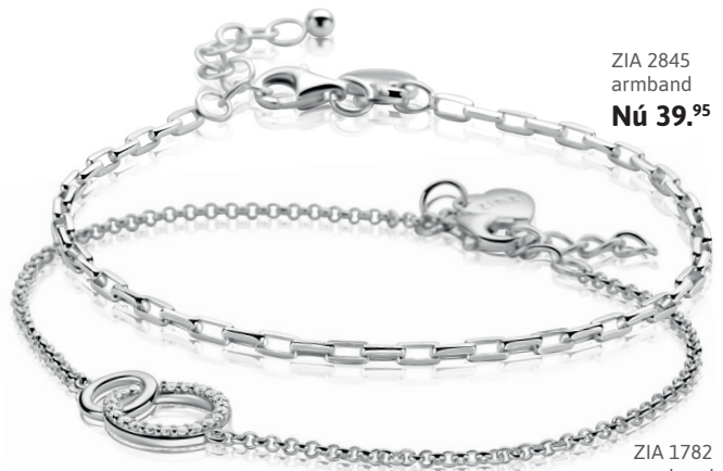
ZIA 2845 armband Nú 39. 95