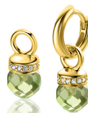
ZICH 2428 oorbedels 15mm 69. 95 p.pr