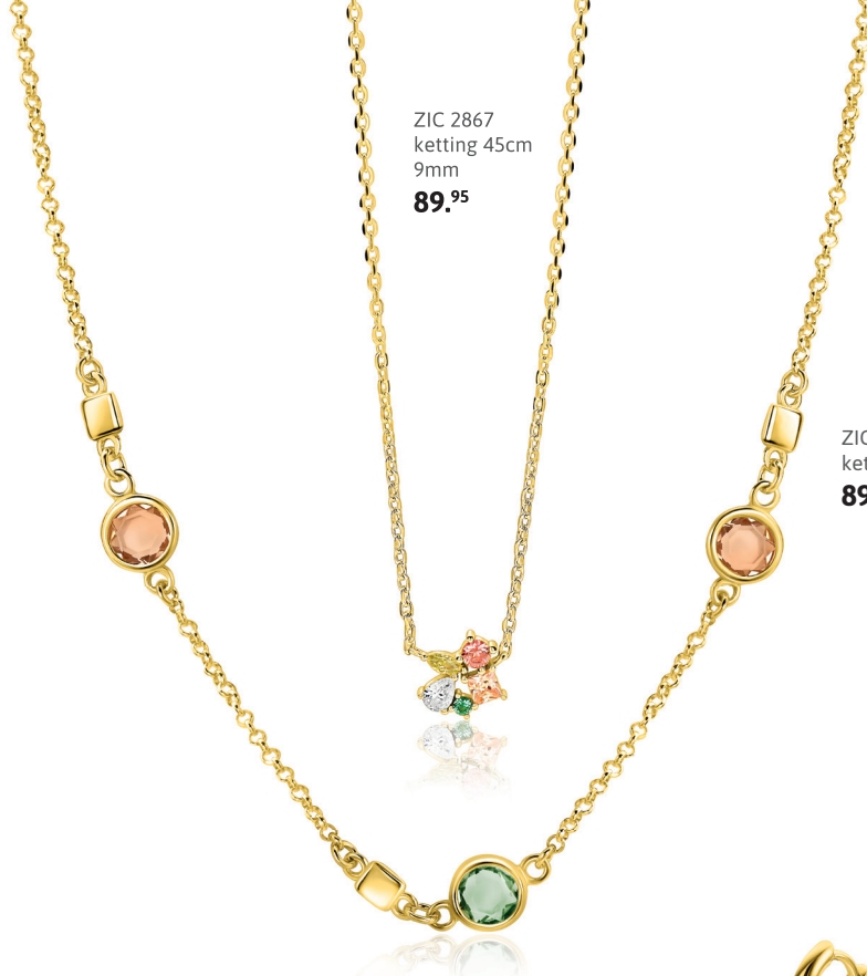
ZIC 2867 ketting 45cm 9mm 89. 95