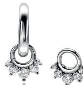
ZICH 2632 oorbedels 9mm 39. 95 p.pr