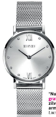
ZIW 628M watch 28mm 'Lady Silver' 109.-*