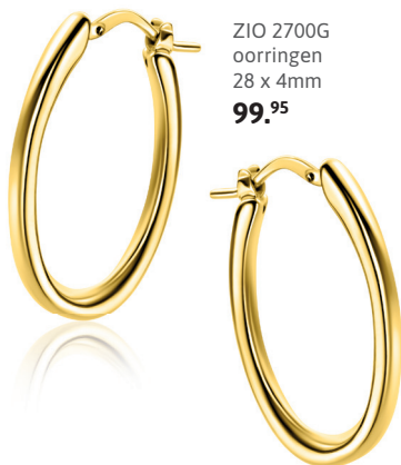
ZIO 2700G oorringen 28 x 4mm 99.95