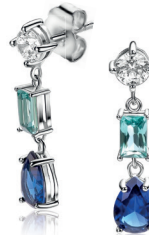
ZIO 2901 oorstekers 23mm 69. 95