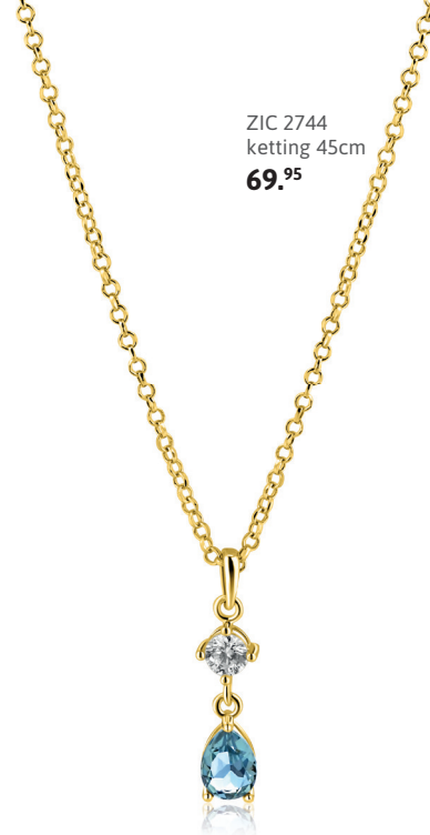
ZIC 2744 ketting 45cm 69.95