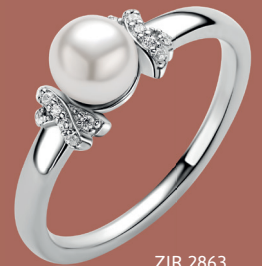
ZIR 2863 49. 95