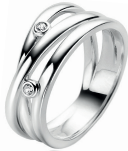
ZIR 2571 84. 95