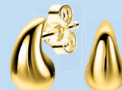
ZIO 2636G oorstekers 11mm Nú 59. 95