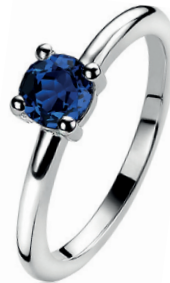
ZIR 1300Q 44. 95