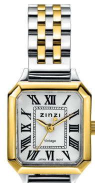
ZIW 2607 watch 24mm 'Vintage bicolor' 139.-*