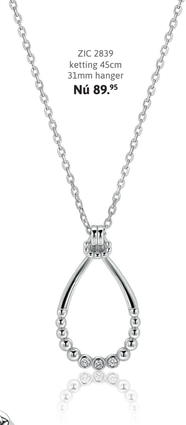
ZIC 2839 ketting 45cm 31mm hanger Nú 89. 95