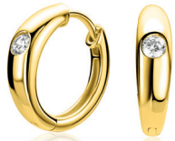
ZIO 2898 oorringen 16mm 89. 95

Geïnspireerd op de glamour van de seventies. Van krachtige schakels en vloeiende vormen tot verfijnde klassiekers: tijdloze sieraden met karakter. Who's calling who?