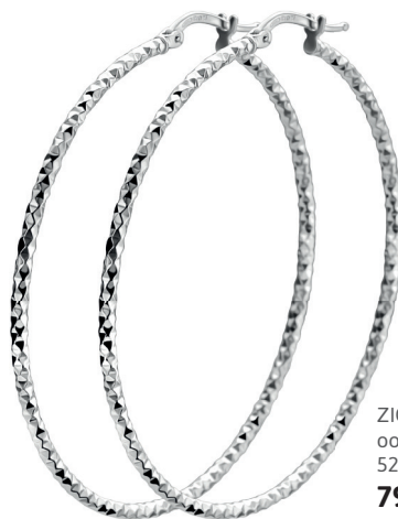
ZIO 2912 oorsieraden 52 x 2mm 79. 95