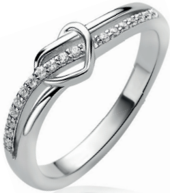
ZIR 2874 69. 95