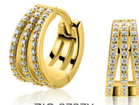
ZIO 2727Y luxe oorringen 13 x 6mm 89. 95

GOLD PLATED Zilveren sieraden in geelverguld: een dun laagje 14k goud is op het zilver gelegd.