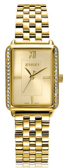
ZIW 2310 watch 28mm 'Lucia Gold' 159.-*