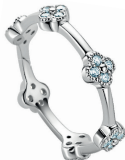
ZIR 2663 59.95