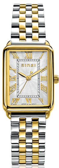
ZIW 1907 watch 28mm 'Elegance Bicolor' 149.-*