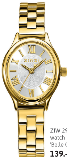
ZIW 2933 watch 26mm 'Belle Ovale Gold' 139.-*

GOLD PLATED Zilveren sieraden in geelverguld: een dun laagje 14k goud is op het zilver gelegd.