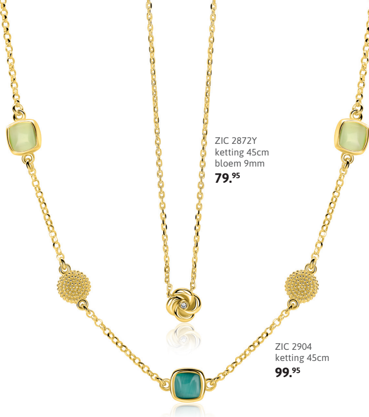
ZIC 2872Y ketting 45cm bloem 9mm 79. 95