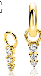
ZICH 2887Y oorbedels 8mm 34.95 p.pr