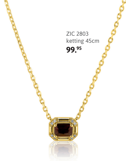
ZIC 2803 ketting 45cm 99.95