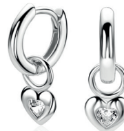
ZICH 2886 oorbedels 6mm 34. 95