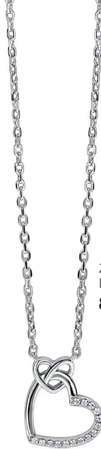
ZIC 2874 ketting 45cm 89. 95

Een klein hartje zegt soms meer dan duizend woorden. Draag het voor jezelf of geef het aan iemand die je lief is.