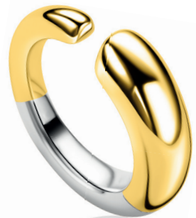
ZIR 2788G 99. 95