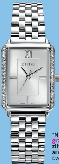
ZIW 2302 watch 28mm 'Lucia Silver' 149.-*

Lichtblauw, zilver en een vleugje vintage. Fatima straalt alsof ze zo uit een seventies zomerfilm is gestapt. De fonkelende zirconia's en witte parels geven iedere look een frisse, tijdloze uitstraling.