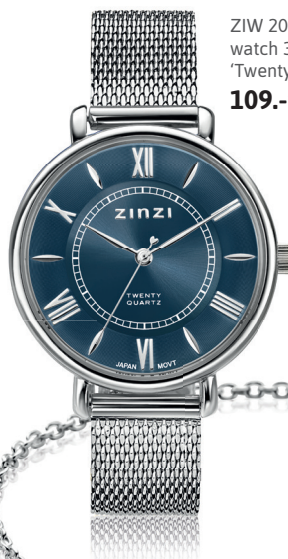
ZIW 2053 watch 34mm 'Twenty Blue' 109.-*