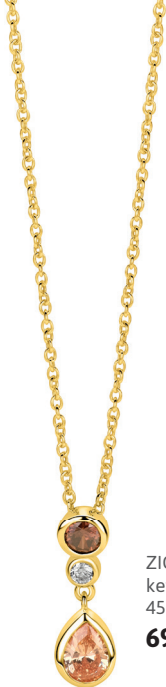
ZIC 2900 ketting 45cm 69.95

De zon zakt langzaam achter de baan terwijl de laatste ballen worden geslagen en de spanning stijgt bij het publiek. De warme kleuren van deze zirconia's vangen precies dat moment. Een beetje sportief, een beetje chic en helemaal klaar voor de nazomer. Punt!