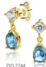
ZIO 2744 oorstekers 17mm 59.95