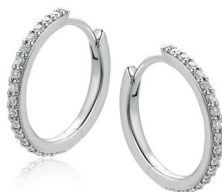
ZIO 2832 oorringen 16mm Nú 39. 95