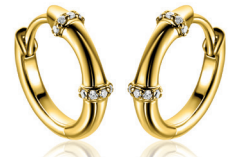
ZIO 2687Y oorringen 15mm 59. 95