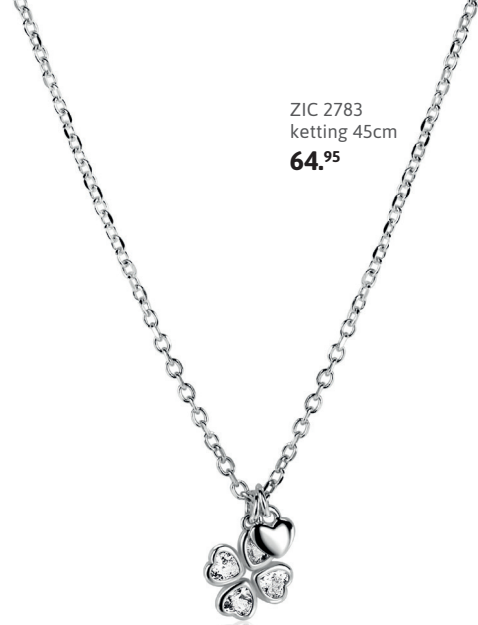
ZIC 2783 ketting 45cm 64.95