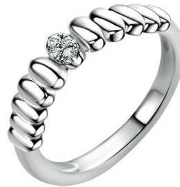
ZIR 2876 49. 95