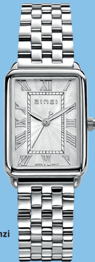
ZIW 1906 watch 28mm 'Elegance Silver' 139.-*

*Nu met gratis zilveren Zinzi armband t.w.v. 34,95