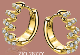
ZIO 2877Y oorringen 16mm 89. 95