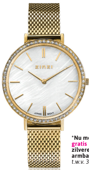
ZIW 1334 watch 34mm 'Grace Gold' 149.-*

*Nu met gratis zilveren Zinzi armband t.w.v. 34,95