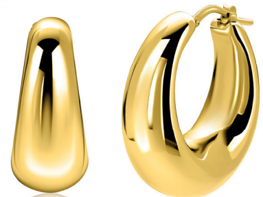
ZIO 2750G oorkingen 31mm 149. 95