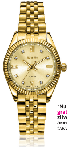
ZIW 2710 watch 24mm 'Mini Iconic gold' 139.-*