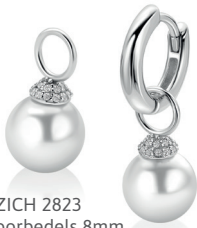
ZICH 2823 oorbedels 8mm 29. 95 p.pr