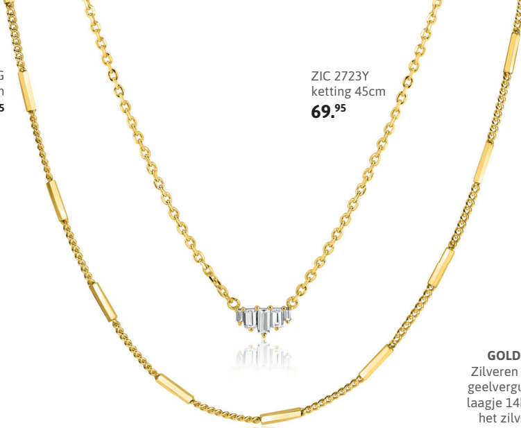
ZIC 2723Y ketting 45cm 69. 95