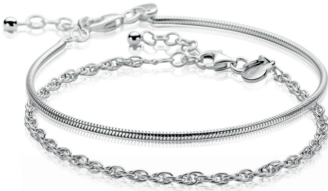
ZIA 2848 armband 1,7mm breed 39. 95