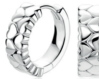
ZIO 2882 oorringen 16mm 89. 95