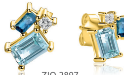
ZIO 2897 oorstekers 11mm 79.95