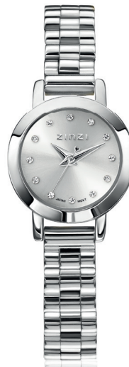
ZIW 3102 watch 20mm 'Étoile Nuit Silver' 119.-*

De Zinzi Étoile met een kastmaat van 20mm is een elegante mix van tijdmeting en sieraad.