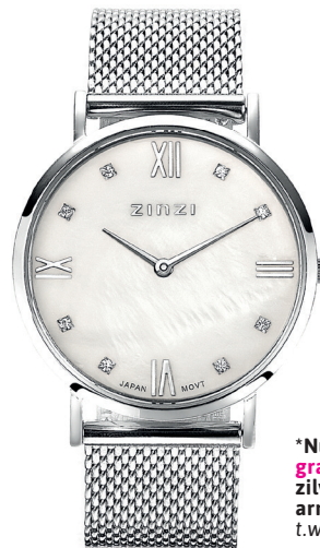
ZIW 521M watch 34mm 'Roman Pearl' 119.-*