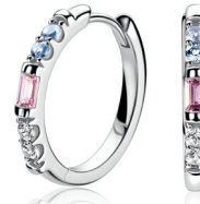
ZIO 2868 oorringen 19x2mm 64. 95