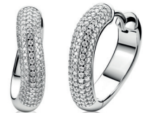
ZIO 2883 oorringen 17x4mm 119. 95