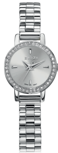
ZIW 3202 watch 20mm 'Étoile Silver' 129.-*