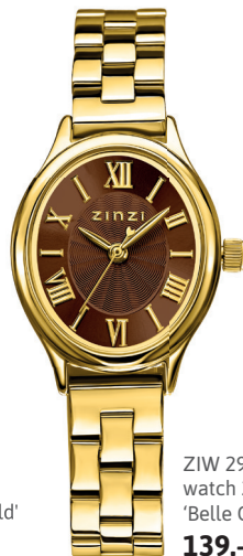
ZIW 2936 watch 26mm 'Belle Ovale Brown' 139.-*