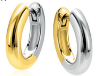
ZIO 2836 oorringen 15mm 49. 95