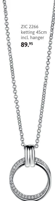
ZIC 2266 ketting 45cm incl. hanger 89. 95