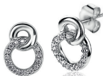
ZIO 2045 oorstekers 11mm 54. 95