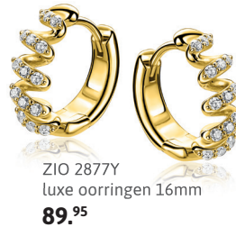
ZIO 2877Y luxe oorringen 16mm 89.95