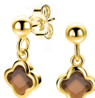
ZIO 2772 oorstekers 16mm 49. 95