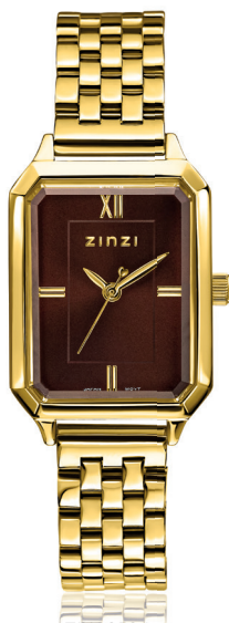
ZIW 2536 watch 30mm 'Allure Brown' 139.-*