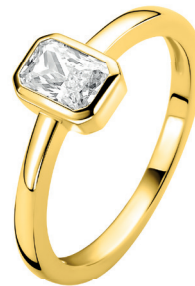
ZIR 2899 64. 95

Een erbetoon aan het decennium waarin zelfvertrouwen en stijl samenkwamen. De geometrische vormen en de gouden glans geven dat extra vleugje seventies glamour!