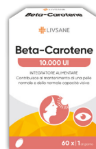
BETA-CAROTENE 60 compresse

Betacarotene, Zinco e Vitamina C, il tuo alleato quotidiano sotto il sole