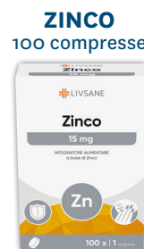
ZINCO 100 compresse