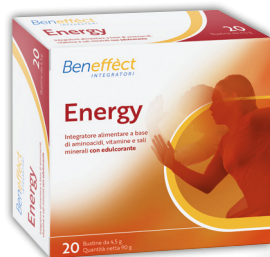
ENERGY 20 bustine

Tonico, Melatonina e Magnesio per sostenere energia di giorno e favorire il riposo notturno