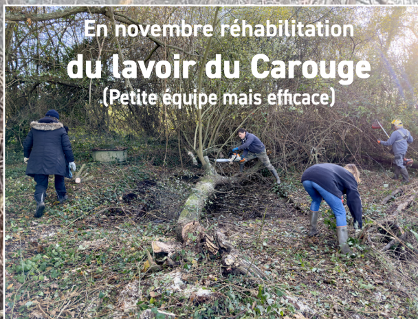
En novembre réhabilitation du lavoir du Carouge (Petite équipe mais efficace)

Plinet et la Ville Billy - Roc-St-André - 28 janvier 2023