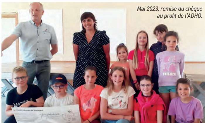
Mai 2023, remise du chèque au profit de l'ADHO.

Début juin , le repas du club sera agrémenté d'un spectacle de voltige, spécialement préparé par nos élèves.