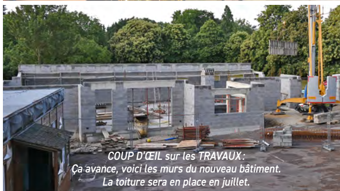
COUP D'ŒIL sur les TRAVAUX : Ça avance, voici les murs du nouveau bâtiment. La toiture sera en place en juillet.