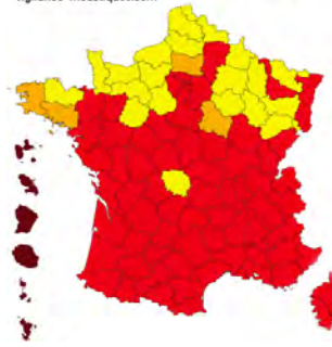
Carte du moustique tigre 2023 vigilance-moustiques.com

Quatre départements en France ont été placés en vigilance orange (dont le 56), signifiant que le moustique tigre y a été détecté de manière ponctuelle