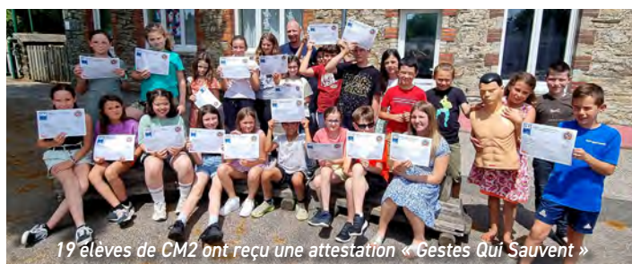
19 élèves de CM2 ont reçu une attestation « Gestes Qui Sauvent »