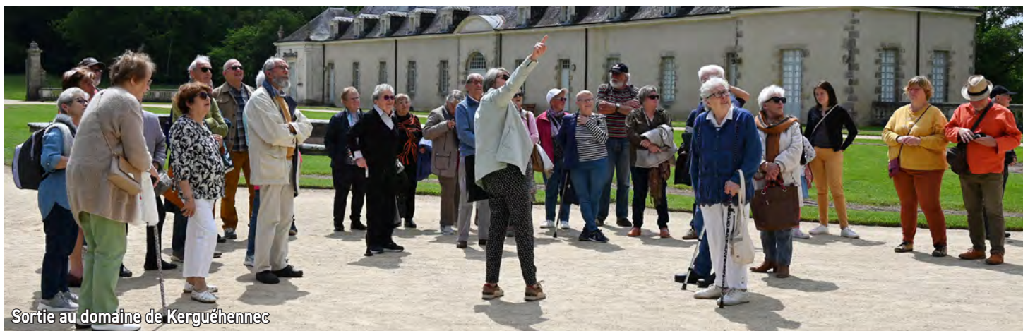
Sortie au domaine de Kerguéhennec

Parmi les faits marquants du semestre écoulé, notre visite au domaine de Kerguéhennec mérite une mention spéciale. Avec près de 50 participants, cette escapade a été une occasion de découvrir l'exposition « Après nous le déluge », et de tisser des liens dans une atmosphère conviviale.