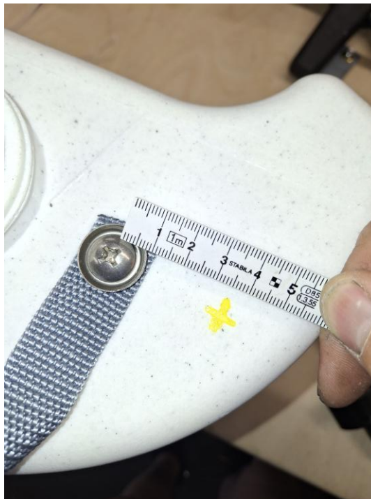
(Vorschlag positionierung Bohrung)

Bohre mit einer Lochkreissäge ein Loch 30 mm. Der pipiGUARD kann links als auch rechts am Kanister montiert werden!