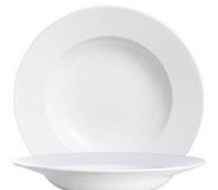
Assiette creuse 0,28€ TTC