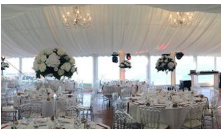
VELUM & HABILLAGE POTEAU