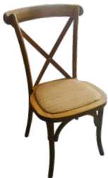
Chaises en bois dos croisé 7,98€ TTC