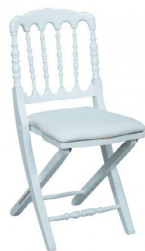
Chaise napoléon blanche 9,46€ TTC