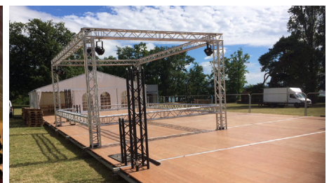
PLANCHER BOIS VITRIFIÉ (sur trame métallique, posé, déposé) avec structure / sans structure