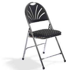
Chaise pliante 4,14€ TTC