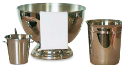
Seau à champagne 5.19€ TTC Seau à glaçon 3.12€ TTC Vasque inox 17.46€ TTC