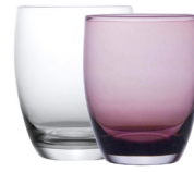
Verre à eau violette ou anthracite 0,41€ TTC