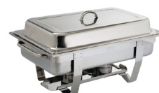
Shaffing dish 47,69€ TTC