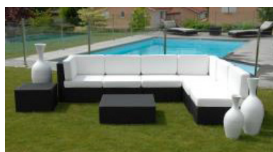
Ensemble Douggy 168€ TTC