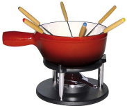
Caquelon à fondue 14.40€ TTC Pic à fondue 0,34€ TTC