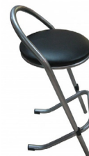
Tabouret de bar 8,61€ TTC