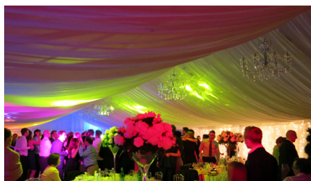
ECLAIRAGE spot standard / spot alu cinéma / led / spot extérieur