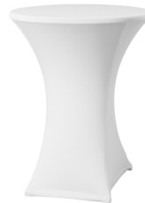
Housse mange debout