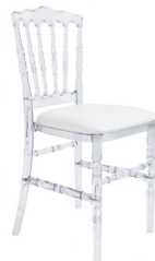
Chaise Napoléon Cristal avec coussin blanc 9,83€ TTC