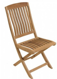
Chaise Teck 5,88€ TTC + Coussin 2,72€ TTC