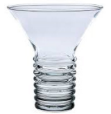
Verre à cocktail 0,34€ TTC