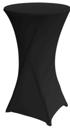
Housse mange debout