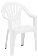
Chaise plastique avec accoudoir 2,50€ TTC