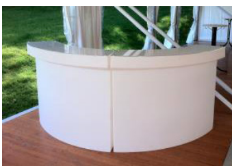
Bar Lumineux 151,20€ TTC