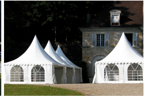
TENTE GARDEN 5X5m (sans éclairage, sans plancher)