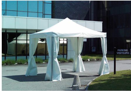
SAS 3X3m (sans éclairage, sans plancher)