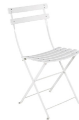
Chaise square 4,74€ TTC