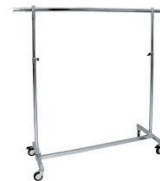
Vestiaire 15,88€ TTC Cintre bois 0,32€ TTC Ticket de vestiaire (par 50) 6,85€TTC