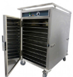
Etuve électrique 138.92€ TTC