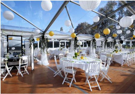
CHAPITEAU 2 PENTES CRISTAL posé déposé 6m, 8m ou 10m de large (sans éclairage, sans plancher) à partir de 36m 2