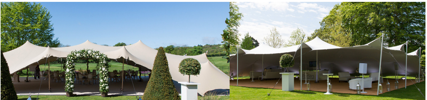
TENTE STRETCH (SUR DEVIS)

NOUS ÉTUDIONS TOUS VOS PROJETS POUR VOUS PROPOSER UN DEVIS PERSONALISÉ EN FONCTION DE LA SURFACE ET DES OPTIONS* : CONTACTEZ-NOUS AU 04 50 27 36 77