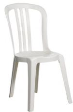
Chaise plastique sans accoudoir 2,50€ TTC