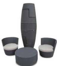
Ensemble Easy 138,60€ TTC