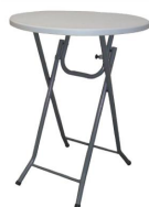
Mange debout 19,66€ TTC