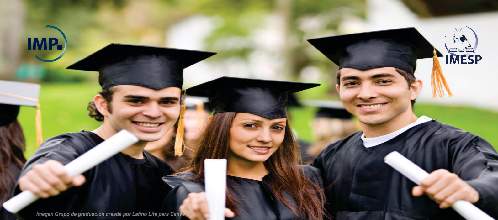
Imagen Grupo de graduación creada por Latino Life para Canva