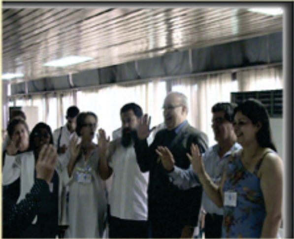
Nombramiento de la Nueva Mesa Directiva - Cuba