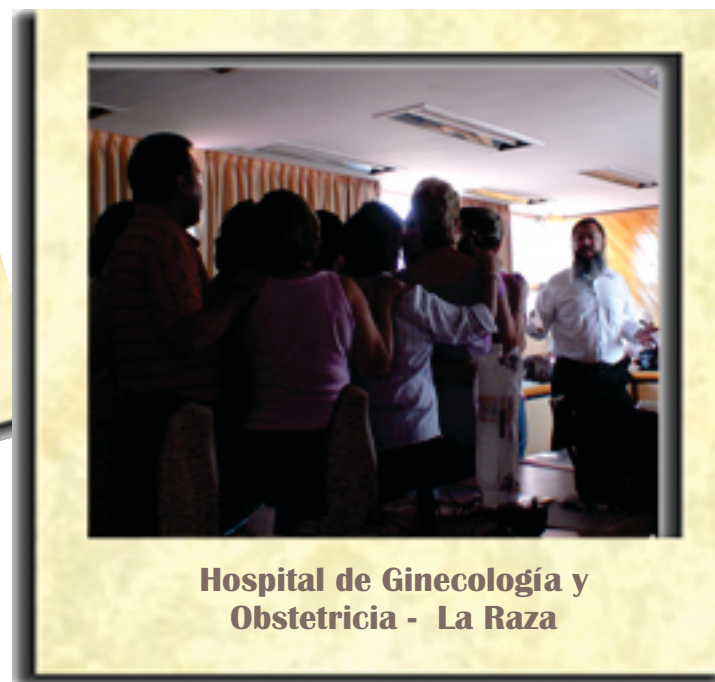
Hospital de Ginecología y Obstetricia - La Raza