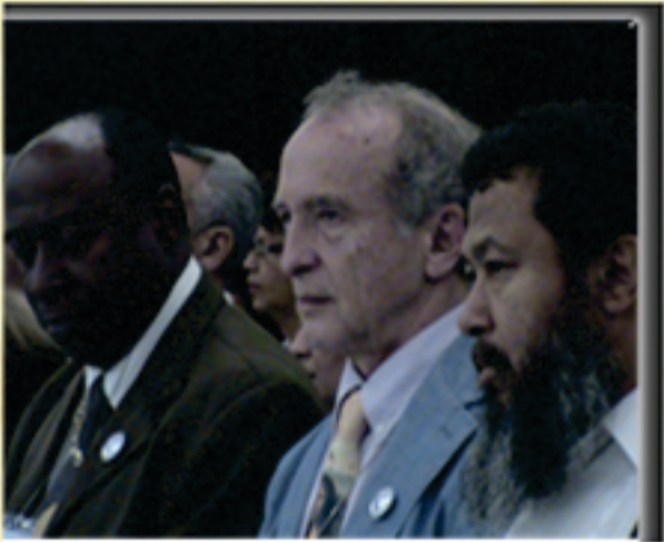
Personalidades de la Hipnosis