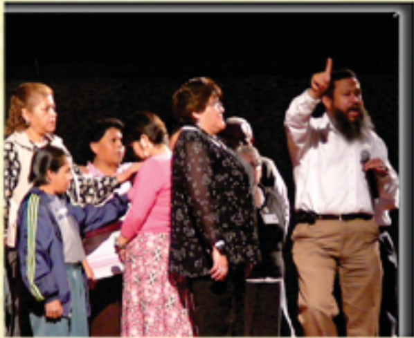
2a. Sesión Académica de Nefrología - Siglo XXI (IMSS)