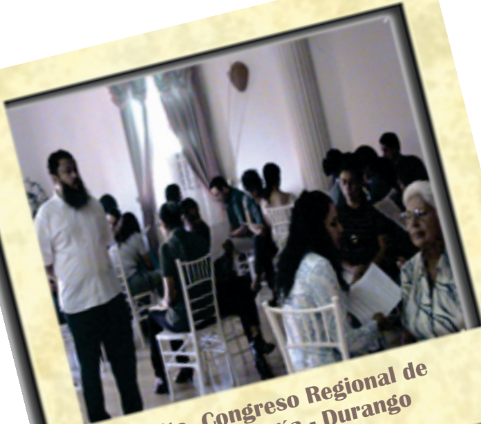
5to. Congreso Regional de Tanatología - Durango