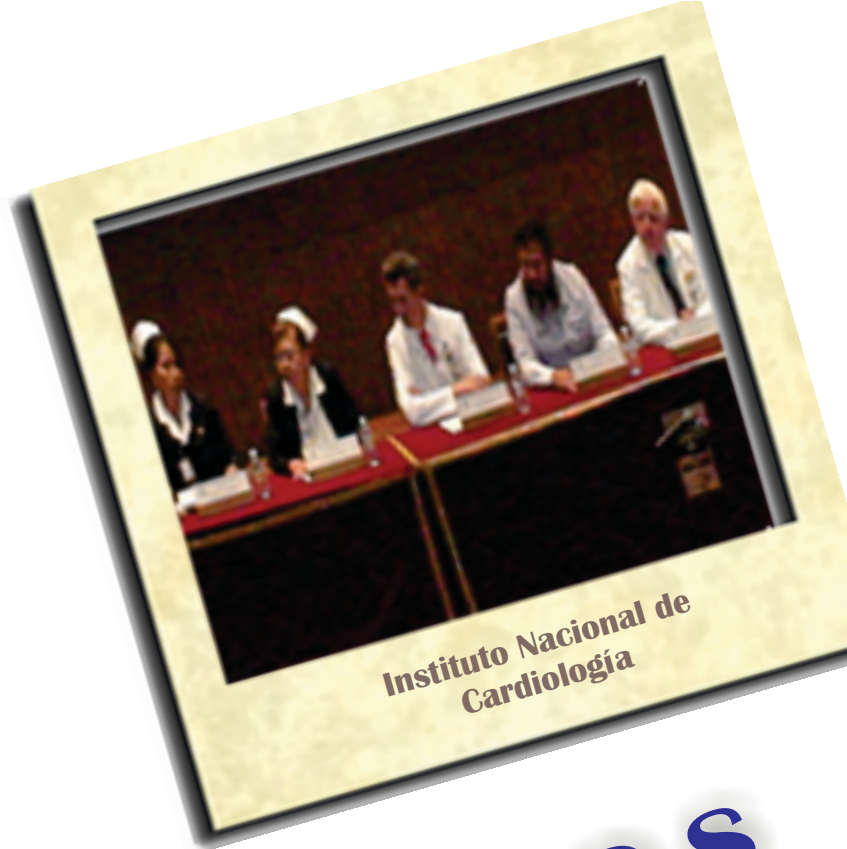
Instituto Nacional de Cardiología