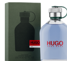
150 Hugo Hugo Boss