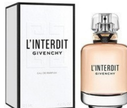
121 L'INTERDIT GIVENCHY