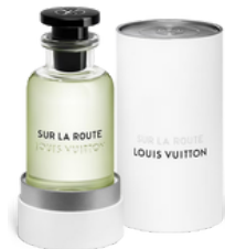
113 SUR LA ROUTE LOUIS VUITTON