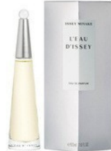
29 L'EAU D'ISSEY ISSEY MIYAKE