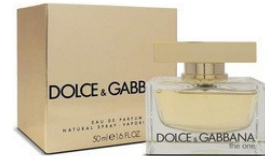
70 THE ONE D&G