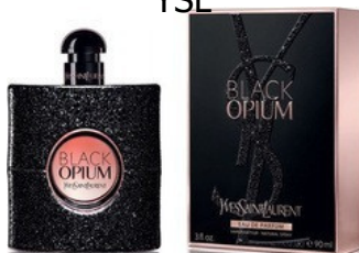
55 BLACK OPIUM YSL