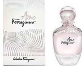
97 AMO FERRAGAMO SALVATORE FERRAGAMO