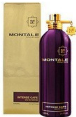
105 INTENSE CAFE MONTALE