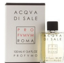
69 ACQUA DI SALE PROFUMO DI ROMA