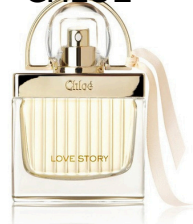
154 CHLOË LOVE CHLOË