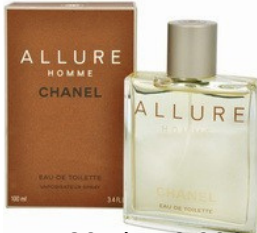
48 ALLURE MEN CHANEL