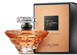
27 TRÉSOR LANCÔME