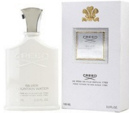
44 SILVER MOUNTAIN CREED