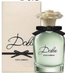
49 DOLCE D&G