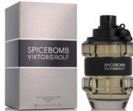
32 SPICE BOMB VIKTOR ROLF