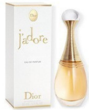
7 J'ADORE DIOR