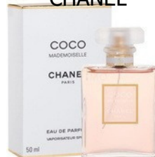
51 COCO MADEMOISELLE CHANEL