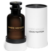
114 OMBRE NOMADE LOUIS VUITTON