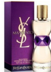
14 MANIFESTO YSL

30ml - 18.00€ 70ml - 35.00€ 24 CHANEL N°5 CHANEL