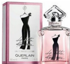
120 LA PETITE ROBE GUERLAIN