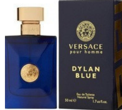
84 BLUE DYLAN VERSACE