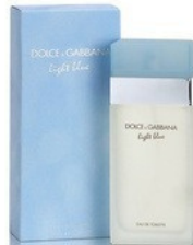
11 LIGHT BLUE D&G

30ml - 18.00€ 70ml - 35.00€ 19 LADY MILLION PACCO RABLANE