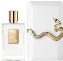
50ml - 52.00€