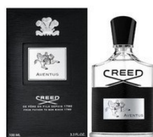
68 AVENTUS CREED