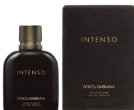
62 INTENSO D&G