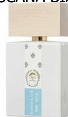
50ml - 52.00€