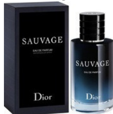
94 SAUVAGE DIOR