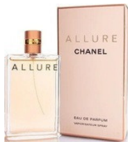
71 ALLURE CHANEL