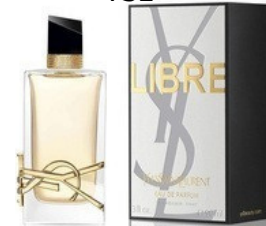
122 LIBRE YSL