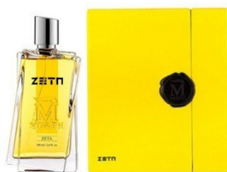
50ml - 52.00€