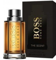
157 Hugo Boss The Scent