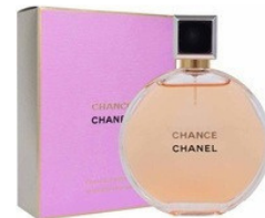
85 CHANCE CHANEL