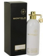
100 WHITE AQUA MONTALE