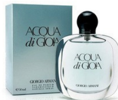
76 ACQUA DI GIOIA ARMANI