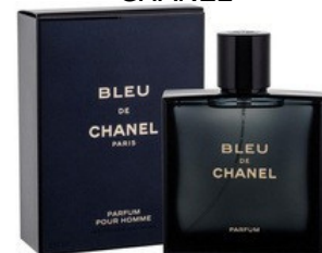
38 BLEU CHANEL