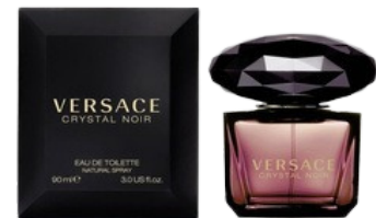
47 CRYSTAL NIOR VERSACE