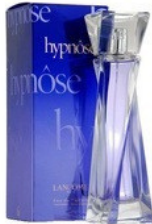
40 HYPNOSE LANCÔME