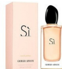
80 SI GIORGIO ARMANI