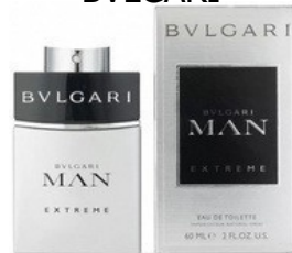
37 MAN BVLGARI