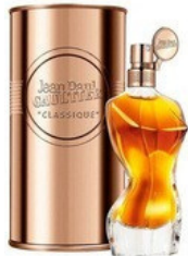
81 CLASSIQUE ESSENCE JEAN PAUL GAULTIER