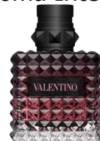
161 Valentino Born in Roma Intense