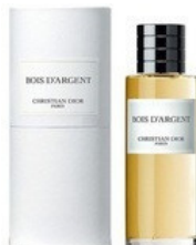
135 BOIS D'ARGENT CHRISTIAN DIOR