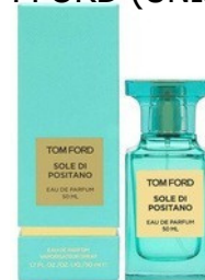
50ml - 52.00€

Alle Düfte sind auch in 15ml für das Taschenetui ab 11,90- 22,90€ erhältlich. Bei Interesse, wende Dich bitte an deinen Berater.