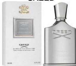
73 HIMALAYA CREED