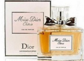
39 MISS DIOR CHERIE DIOR