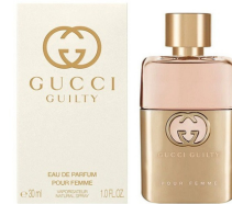
151 Guilty Gucci