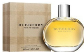
159 Burberry Burberry for Woman