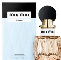
163 Miu Miu Miutine