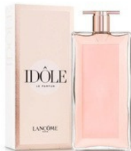
115 IDOLE LANCÔME