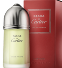
52 PASHA 150 CARTIER