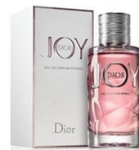
98 JOY DIOR