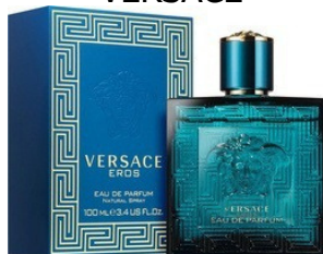
140 EROS VERSACE