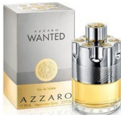
87 WANTED AZZARO