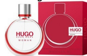
156 Hugo Hugo Boss