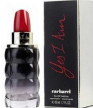
116 YES I AM CHACHAREL