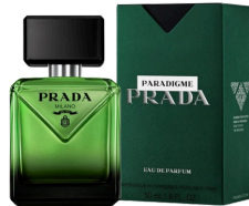
164 Prada Paradigme