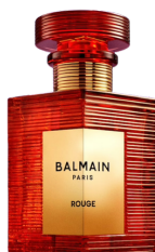
50ml - 52.00€