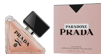
133 PARADOXE PRADA