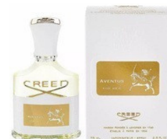
93 AVENTUS FOR HER CREED