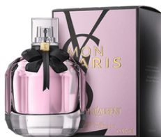
89 MON PARIS YSL