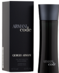
33 BLACK CODE ARMANI