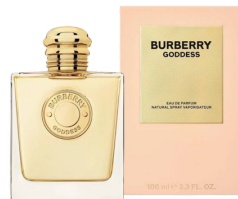
148 Goddess Burberry