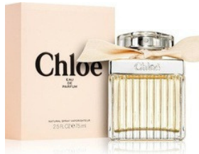
153 CHLOË CHLOË