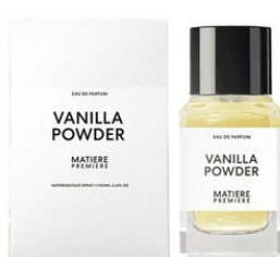
50ml - 52.00€