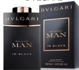
88 MAN IN BLACK BVLGARI