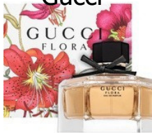
158 Flora Gucci