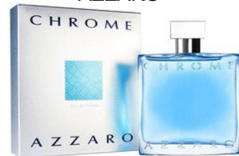
91 CHROME AZZARO