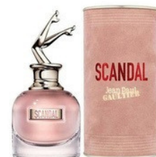
119 SCANDAL JEAN PAUL GAULTIER