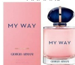
132 MY WAY ARMANI