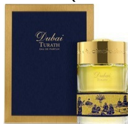
50ml - 65.00€