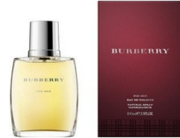
160 Burberry Burberry for Men