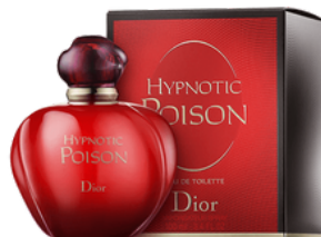
23 HYPNOTIC POISON DIOR

30ml - 18.00€ 70ml - 35.00€ 24 CHANEL N°5 CHANEL