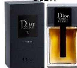
136 HOMME INTENSE DIOR