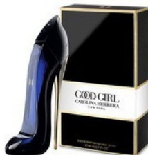
131 GOOD GIRL CAROLINA HERRERA