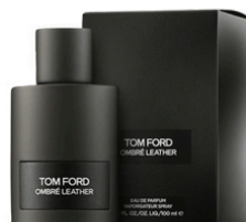
142 OMBRE LEATHER TOM FORD