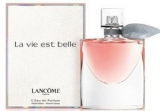
42 LA VIE EST BELLE LANCÔME