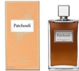
72 PATCHOULI REMINISCENCE