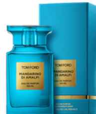
99 MARDARINO DI AMALFI TOM FORD