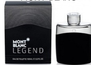
86 LEGEND MONT BLANC