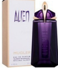
10 ALIEN THIERR MUGLER

30ml - 18.00€ 70ml - 35.00€ 19 LADY MILLION PACCO RABLANE