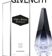
56 ANGE OU DEMON GIVENCHY