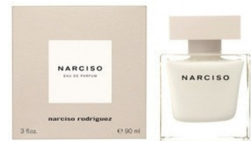
53 NARCISO NARCISO RODRIGUEZ