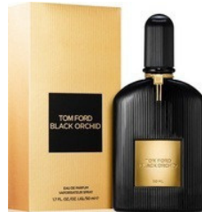
54 BLACK ORCHID TOM FORD