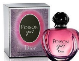
90 POISON GIRL DIOR