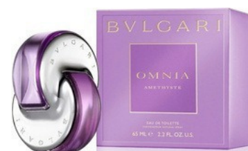
57 OMNIA AMETHYSTE BVLGARI