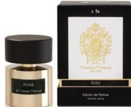
110 KIRKE TIZIANA TEREZZI