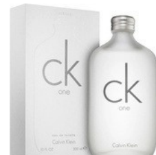
155 THE ONE CALVIN KLEIN