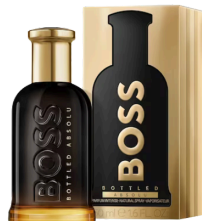
147 BOSS BOTTLED ABSOLU HUGO BOSS