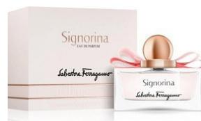
82 SIGNORINA SALVATORE FERRAGAMO