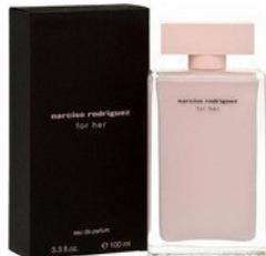
25 FOR HER NARCISO RODRIGUEZ