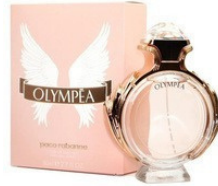
67 OLYMPÉA PACO RABANNE