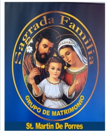
St. Martin De Porres

El 2do y 4to Viernes Del mes a las 7:30 pm