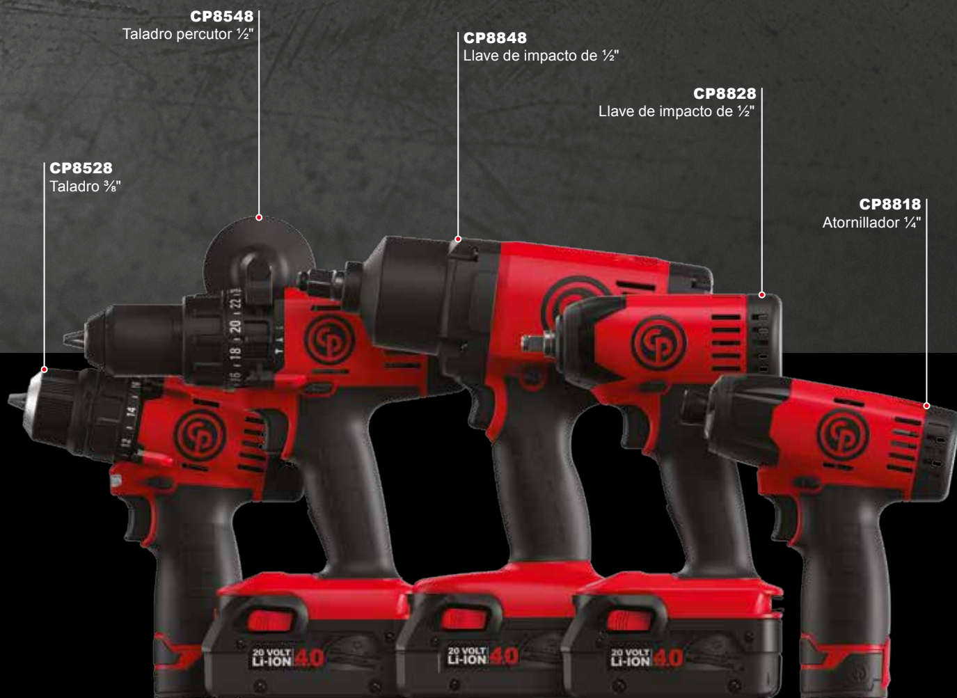
CP8528 Taladro 3/8"