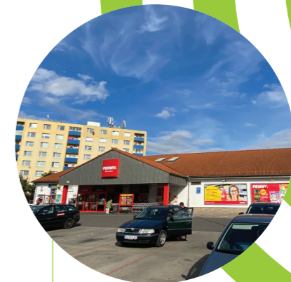
PENNY Chrudim, CZ