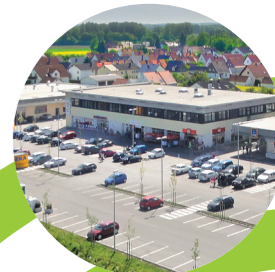
EDEKA, ALDI Manching, DE