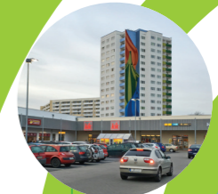
NETTO Erfurt, DE