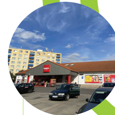
PENNY Chrudim, CZ