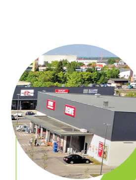
REWE Augsburg, DE