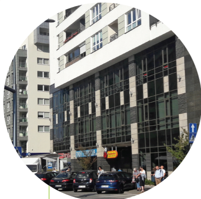
BIEDRONKA Warschau, PL