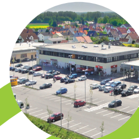
EDEKA, ALDI Manching, DE