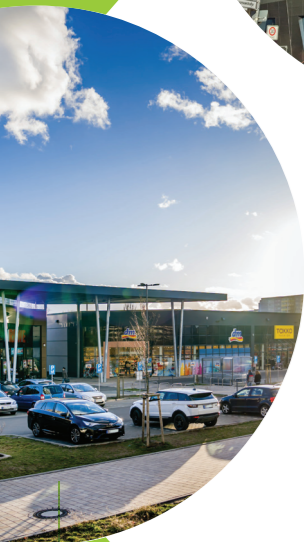
REWE Berlin, DE