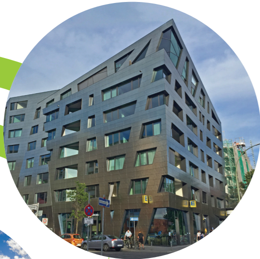
EDEKA Berlin, DE