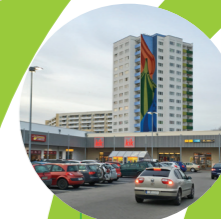
NETTO Erfurt, DE