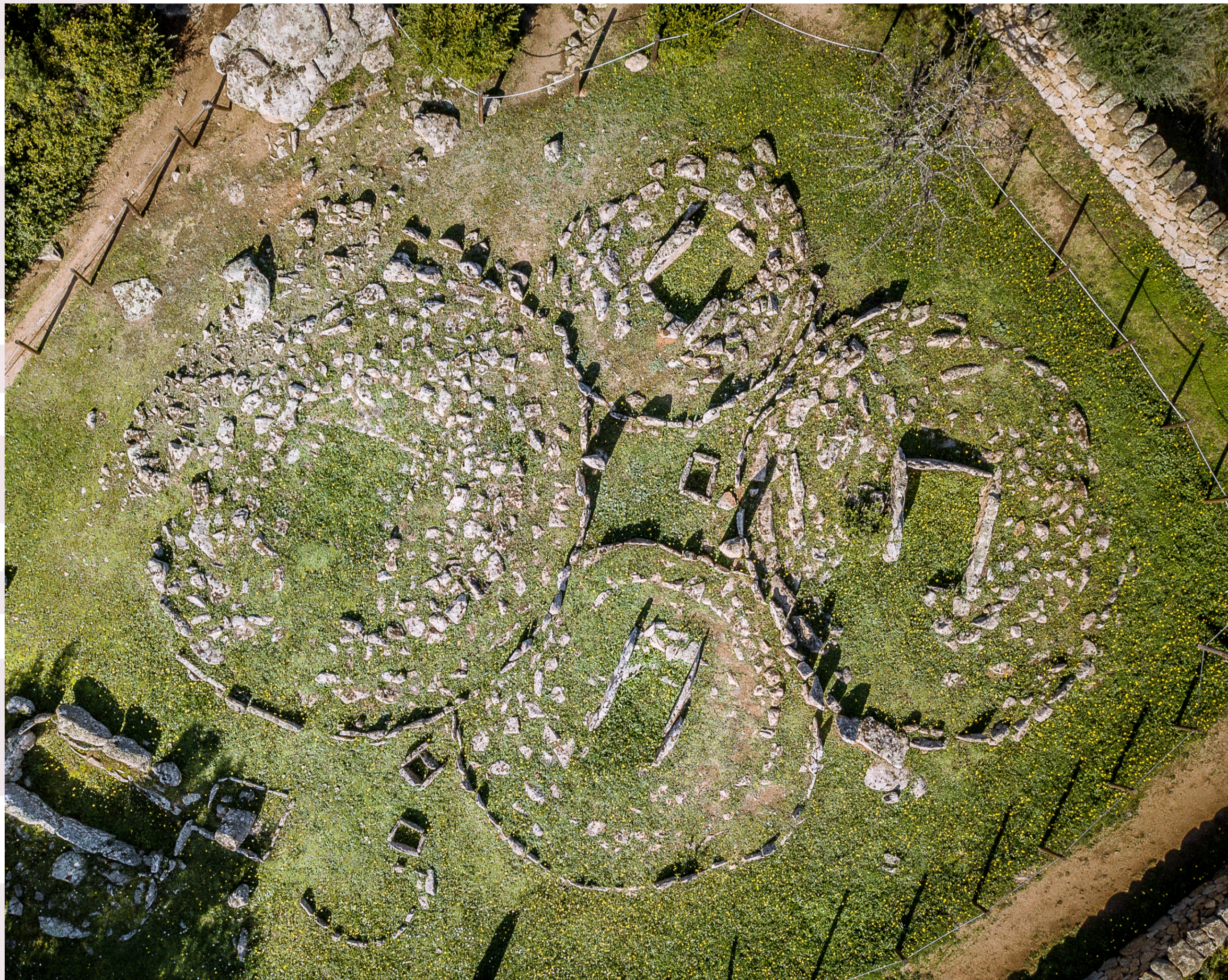
I circoli funerari misurano tra i 5 e gli 8,5 metri di diametro