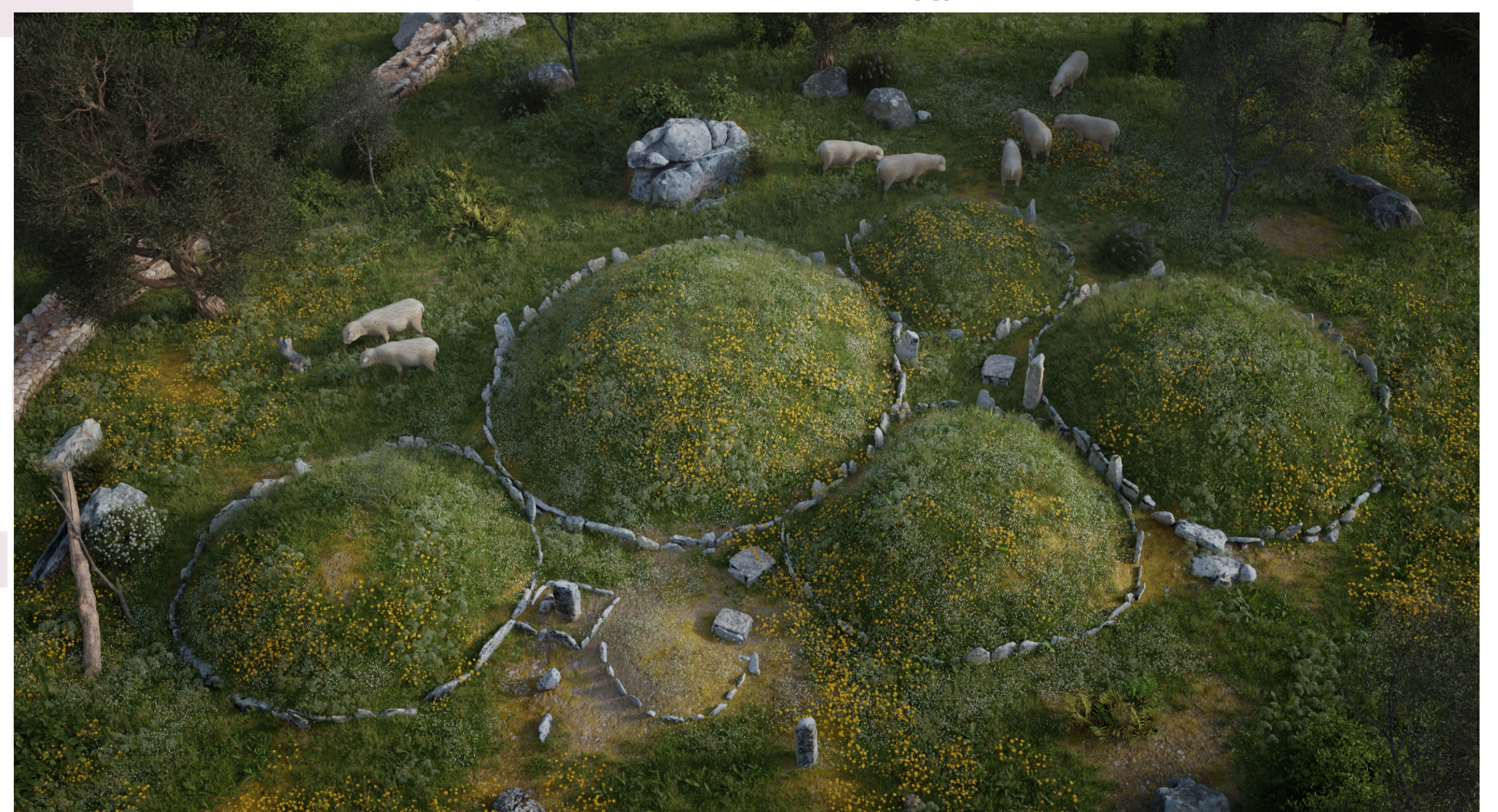
Ipotesi ricostruttiva generale (progetto Sardegna Virtual Archaeology) la necropoli aveva l'aspetto di una serie di collinette artificiali.