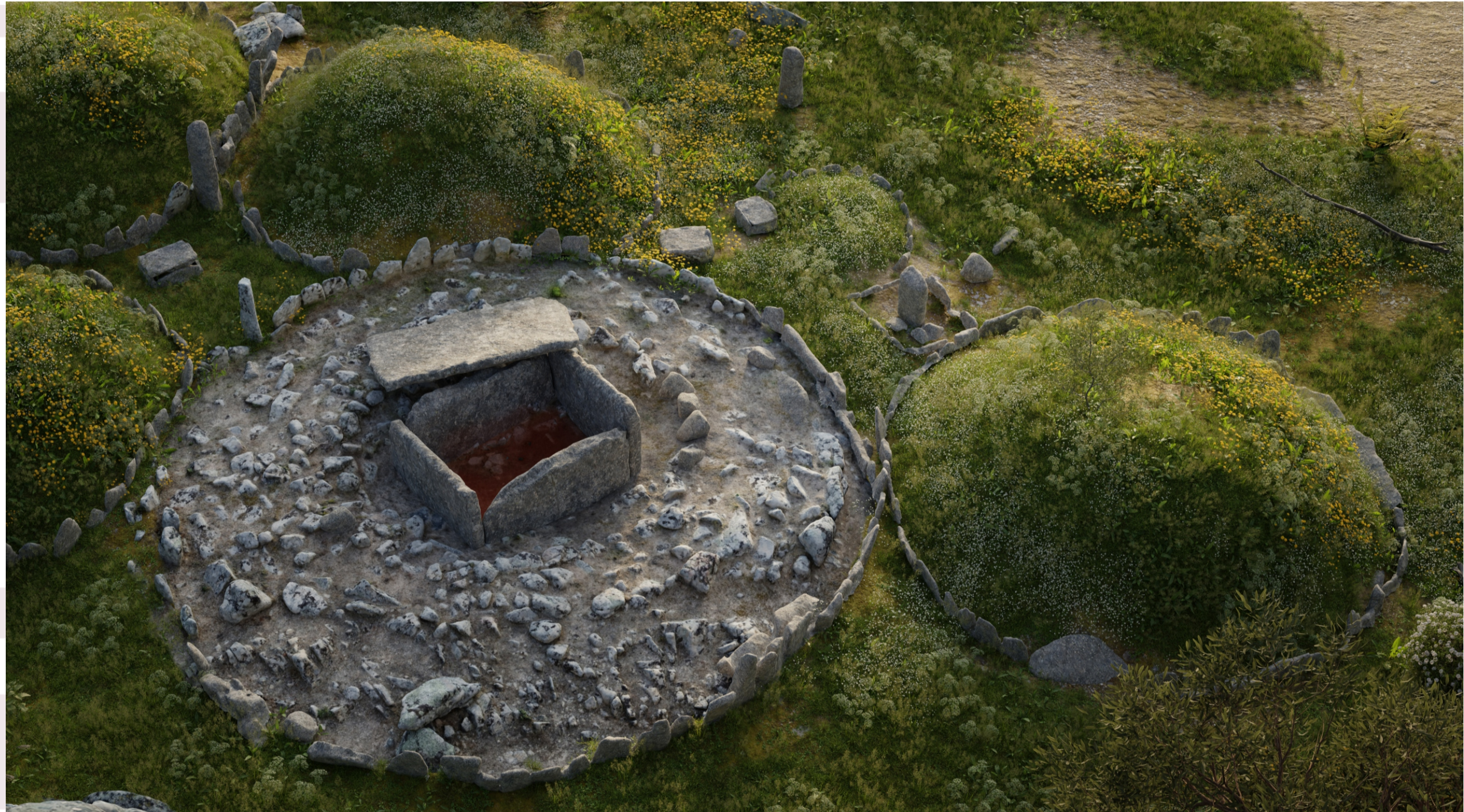
Ipotesi ricostruttiva della tumba 4 realizzata dal CNR per il Comune di Arzachena ( www.ispc.cnr.it ): un tumulo di terra e pietrame ricopriva la tumba.