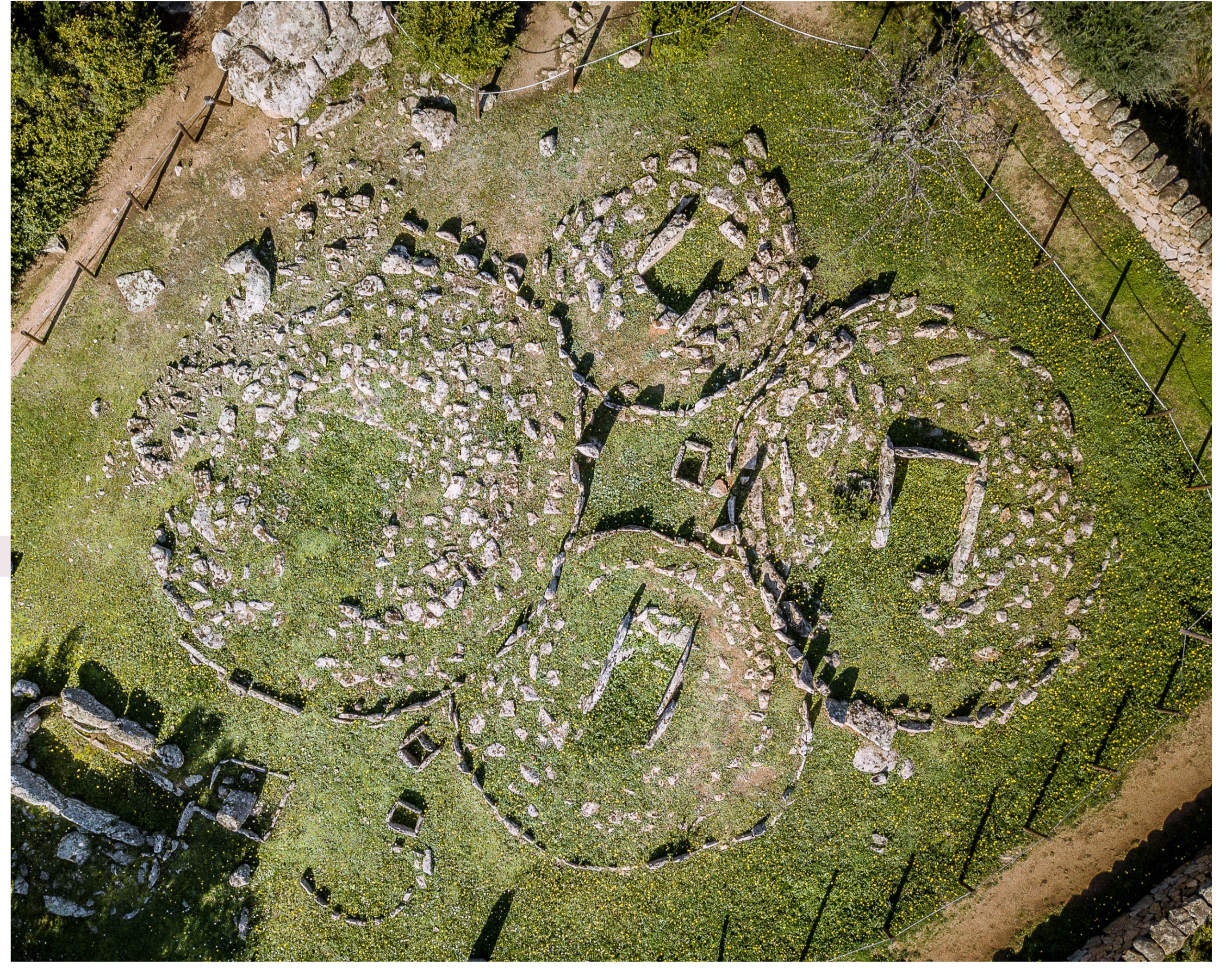
I cíccoli funerari misurano tra i 5 e gli 8,5 metri di diametro