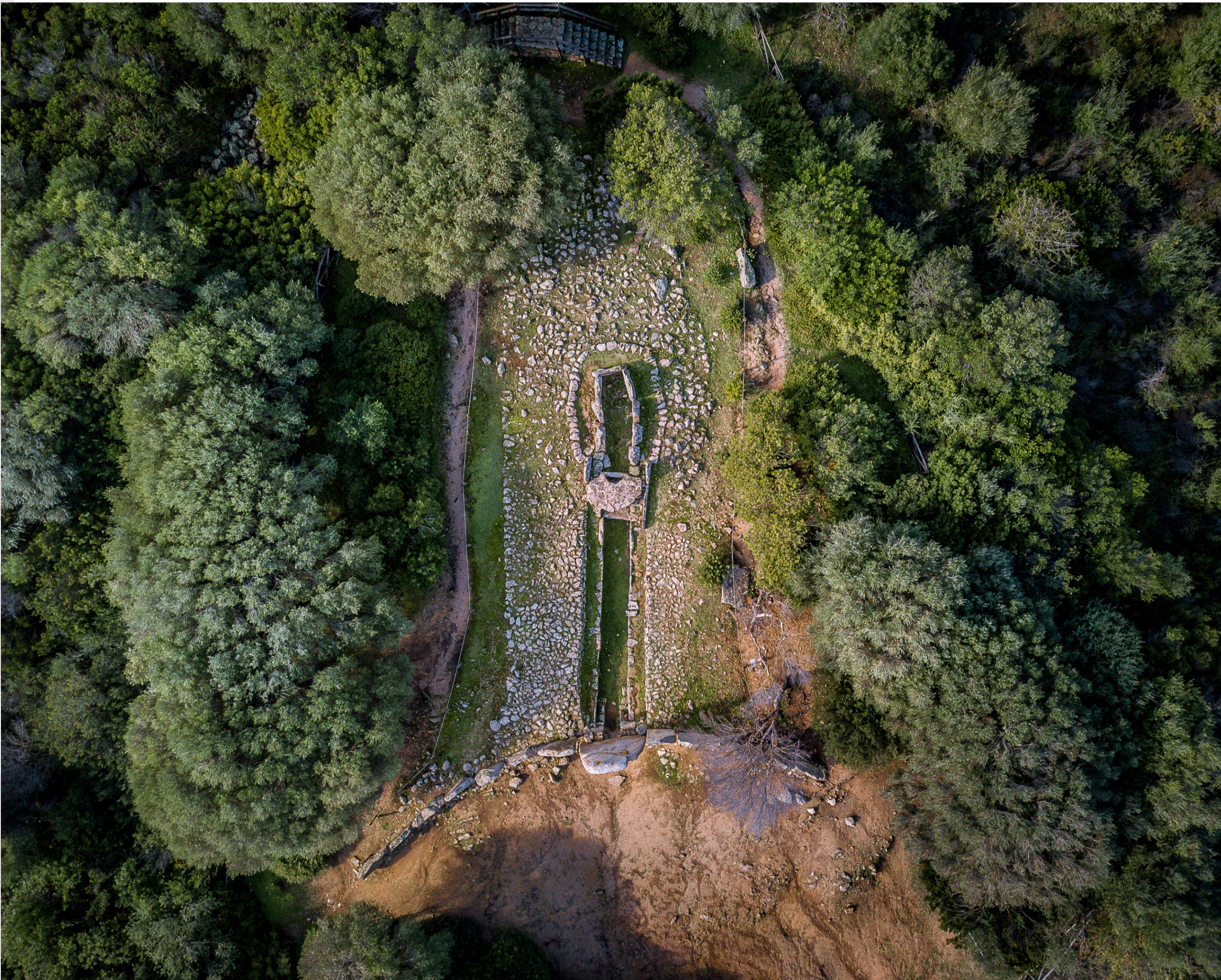
Quella di Li Lolghi è la piú maestosa delle tombe nuragiche del territorio di Arzachena e una delle piú grandi della Sardegna. L'aspetto monumentale risponde all'esigenza delle comunità di segnalare la propria presenza nel territorio.

Chissa di Li Lolghi è la piú maistosa di li tumbi naràggjichi di li cussoggi d'Arzachena e una di li piú manni di Saldigna. La fattura monumentalì rispondi a lu bisognu di la cumunitai di signalà la so' prisènzia illu tarritóriu.