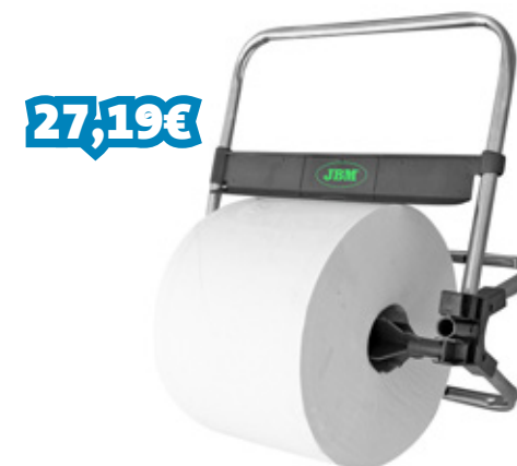
SUPORTE PAREDE P/ ROLO PAPEL LIMPEZA INDUSTRIAL REF: JBM53922

Material Hoja de sierra bimetálica/Bimetal saw blade Lâmina de corte 12" - 300mm (24T) Peso 0,49Kg Dimensões (CxL) 300x98mm