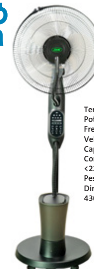
VENTOINHA PULVERIZAÇÃO ÁGUA 75W REF: JBM54508

Tensão 220-240V Potência 75W Frequência 50Hz Velocidades 3 Capacidade 2,8L Consumo de água <220ml/h Peso 8,00Kg Dimensões (CxLxA) 430x380x1250mm