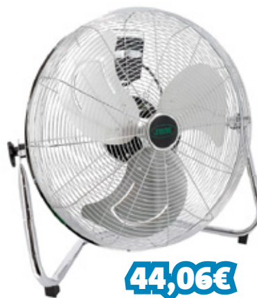
VENTOINHA CHÃO 120W REF: JBM53190

Lente em poliéster PPMA Caixa em poliéster ABS Refletor em poliéster PPMA Poliéster PVC Fluorescente Cobertura protetora em poliéster PP