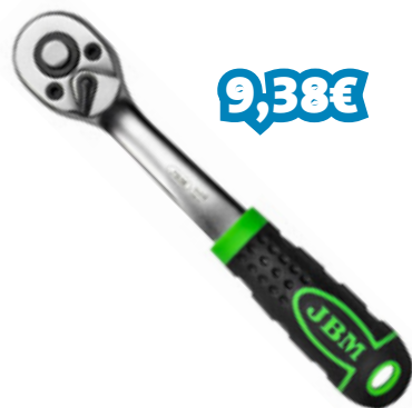
ROQUETE JBM 1/4 REF: JBM54018