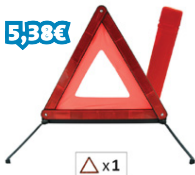
TRIÂNGULO PRÉ SINALIZAÇÃO AUTO REF: JBM52795

Montagem na parede: Altura: 580 mm Largura: 450 mm Profundidade: 270 mm+