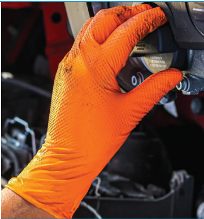
LUVAS DESCARTÁVEIS NITRILO LARANJA TEXTURA DIAMANTE CX. 100 UNI. (M, L) REF: JBM53551, JBM53552