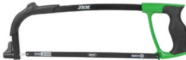
SERROTE FERRO 300MM REF: JBM52831

Medida do quadrado 1/4" Acabado Cincado/Zinc Material CrV Número de dentes 72 Comprimento 145mm Peso 0,14Kg