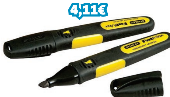
MARCADOR FATMAX PONTA BISELADA PRETO 2 UNI. REF: STN0-47-314_000317

Lixadeira manual que é feita de corpo de alumínio nervurado resistente. Possui um design eficiente de braçadeira que permite segurar o papel ou a tela firmemente no lugar. A lixadeira manual aceita a maioria dos papéis de lixa e telas de lixamento.