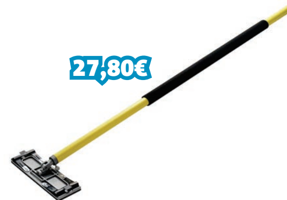
LIXADORA ALUMÍNIO POSTE 1.3M REF: STNSTHT0-05928_002143

Lápis para marcar todo o tipo de superfícies. Núcleo de grafite retangular (tipo 4H) para marcar clara. Secção oval. Lápis de cor verde.