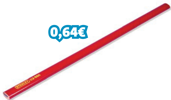
LÁPIZ CARPINTEIRO 176MM VERMELHO REF: STN1-03-850_000049