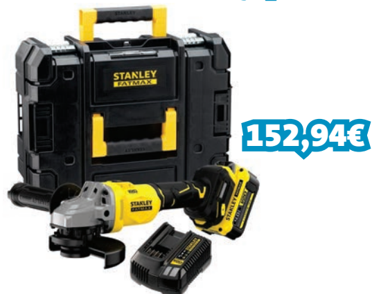
REBARBADORA 18V 125MM REF: STNSFMCG710M1T-QW_011818

Tecnologia da bateria V20: sem efeito de memória e com uma auto-descarga mínima. Tecnologia do motor sem escovas. 8.500 rpm para aplicações agressivas. Fornecida com proteção para lixar e cortar. Manual lateral de 3 posições, para uma precisão, conforto e controlo óptimos. Interruptor de bloqueio, para reduzir a fadiga durante uma utilização prolongada. Cabo fino e borracha texturizada, para maior conforto e controlo ao puxar. Chave armazenada no punho para mudar facilmente de disco. Inclui: 1 bateria V20 4.0Ah 18v; carregador; caixa fatmax pro-stack.