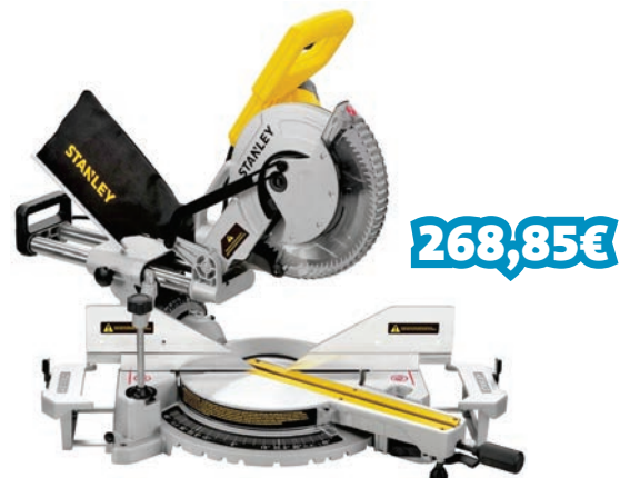
SERRA ESQUADRIA TELESCÓPICA 1800W 254MM REF: STNSM1800-QS_020775

Motor poderoso 1800w, para cortes rápidos limpos e eficientes. Linha de corte com sombra led, para um corte 100% exato e melhor iluminação sem necessidade de calibração. Duplo bisel, capaz de cortar o bisel em ambas as direções sem rodar totalmente o material. Capacidade de esquadria: Esquerda: 47°; Direita: 52°. Velocidade de carga: 4800 rpm. Diâmetro da lâmina: 254 mm. Diâmetro do furo da lâmina: 30 mm. Largura de corte: 310 mm. Profundidade de corte: 92 mm.