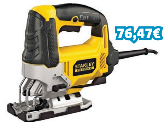
SERRA TICO TICO 710W REF: STNFME340K-QS_005909

Luz de trabalho LED. Design compacto e ergonômico para maior durabilidade e versatilidade. Potente motor 710W motor dá um corte limpo e eficiente. Substituição da lâmina sem ferramentas. Acção de pêndulo para um desempenho de corte melhorado. Aceita lâminas tipo U e tipo T. Capacidade de bisel sem ferramentas 45°. Soprador de poeiras mantém a linha de corte limpa. Parte a gama con cable Stanley FatMax. Cabo de 4m.