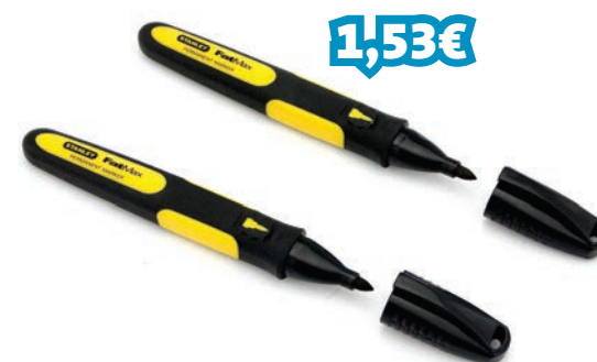
MARCADOR FATMAX PONTA FINA PRETO 2 UNI. REF: STN0-47-316_000118

Marcador permanente cor preto com ponta em bisel. Excelente resistência à água e ao óleo. Seca em segundos. Tampa com clipe e corpo bimaterial ergonómico para uso mais fácil. Adere a muitas superfícies: concreto, material de cobre, madeira e metal. Perfeito para muitas aplicações especiais tais como pintar porcas e parafusos, marcar ferramentas, tubos de gás ou tubos de aço. Uso industrial.