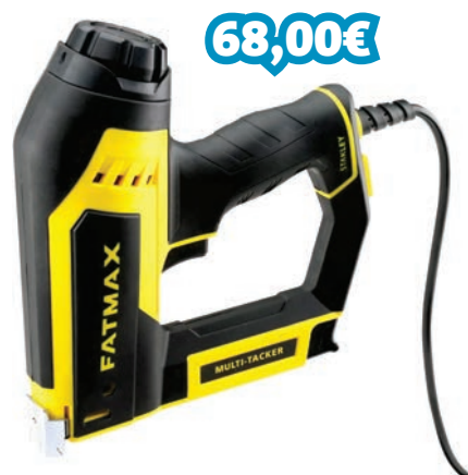
MULTI-AGRAFADOR ELÉTRICO REF: STNFMHT6-75934_005243

5 tipos de agrafos/pregos. Roda para ajuste de potência que permite maior controlo dependendo do material a agrafar. Punho do género das ferramentas eléctricas, para maior ergonomia. Carga traseira com carril de abertura fácil. Guia para fio integrado, posiciona de forma segura o agrafó à volta do fio.