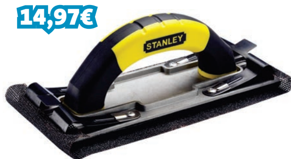
LIXADORA MANUAL C/ CLIP MELHORADO REF: STNSTHT0-05927_001154

Alça de madeira e corpo de Alumínio reforçado se mantém plano e adquire rigidez. Design da pinça eficiente mantém o papel de sujeito na sander. Concorda a grande maioria dos papéis de lixar. Tamanho da base: 230 x 80 mm.