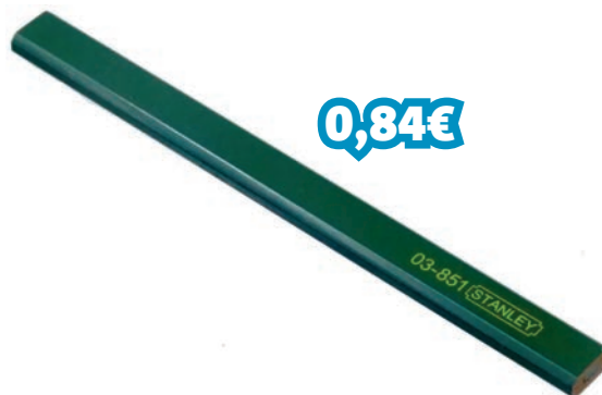
LÁPIZ PEDREIRO 176MM VERDE REF: STN1-03-851_000064

Lápis para marcar todos os tipos de superfícies. Núcleo de grafite retangular (tipo 2B) para excelente marcação. Lápis de cor vermelha.