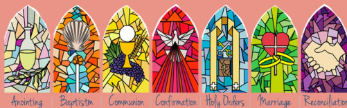
Anointing Baptism Communion Confirmation Holy Orders Marriage Reconciliation

Quince & Presentations: Please call the Parish office/contact us at lhernandez@bsdallas.org / Llama a la Oficina parroquial