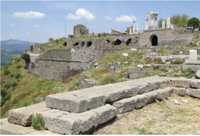
BERGAMA PERGAMON ANTİK KENTİ