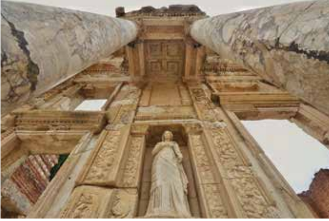
EFES ANTİK KENTİ