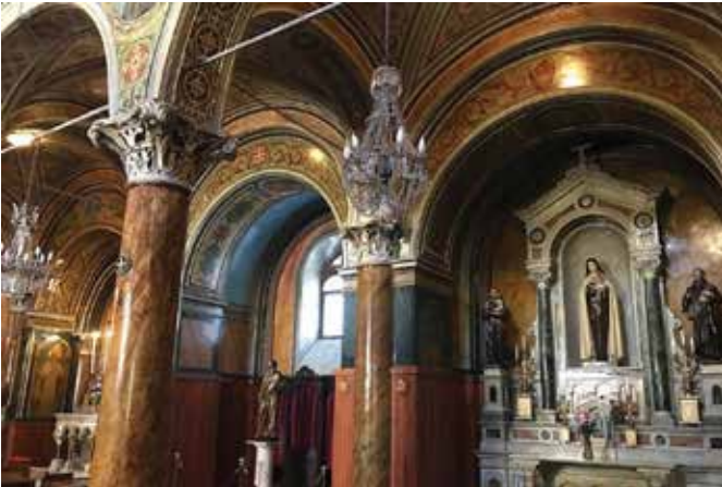
SAİNT POLYCARP KİLİSESİ