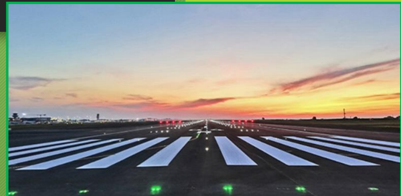
IL LAYOUT DELL'INFRASTRUTTURA DI VOLO DELL'AEROPORTO MARCO POLO DI VENEZIA PRIMA DELL'AVVIO DEI LAVORI DI RIQUALIFICA