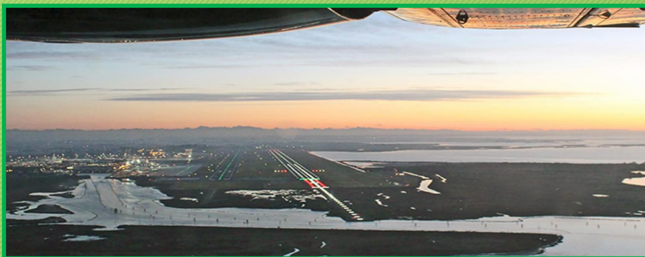
Gli impianti AVL in funzione per pista principale 04R/22L