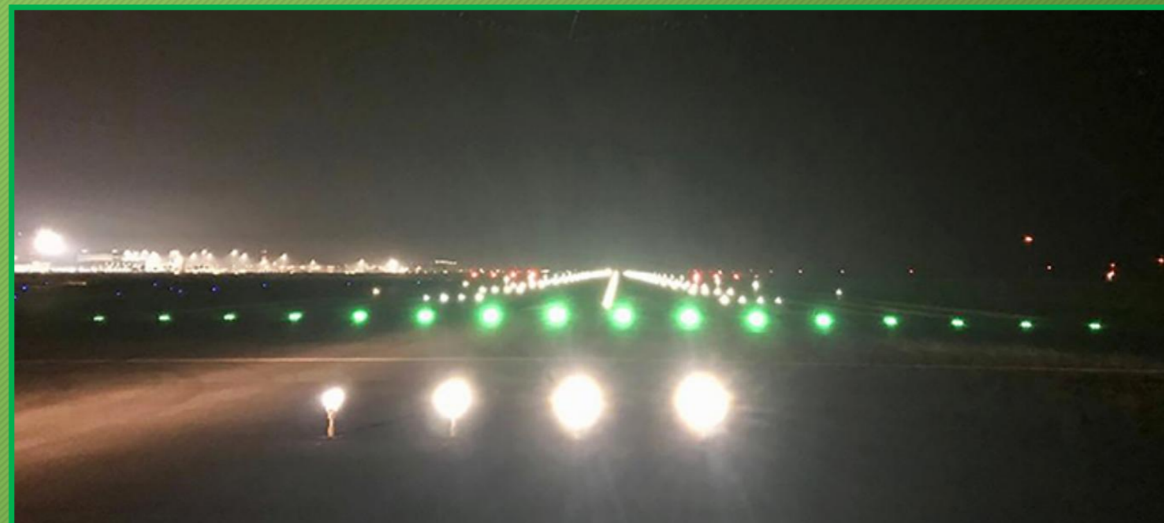
L'accensione dei nuovi impianti AVL lungo le piste