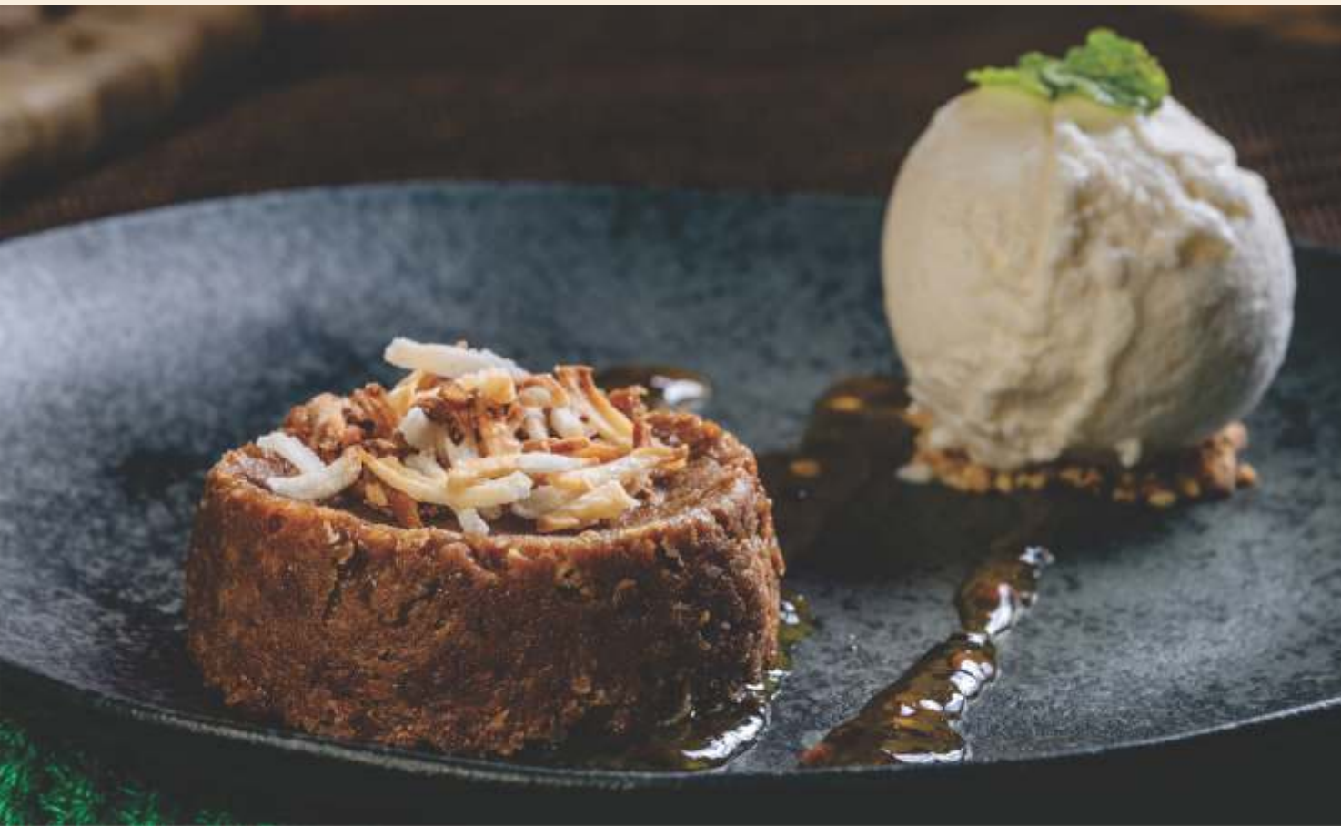
COCADA MARIA BONITA

Cocada cremosa ao forno, servida com sorvete artesanal de tapioca sobre castanha de caju. Acompanha calda de maracujá.