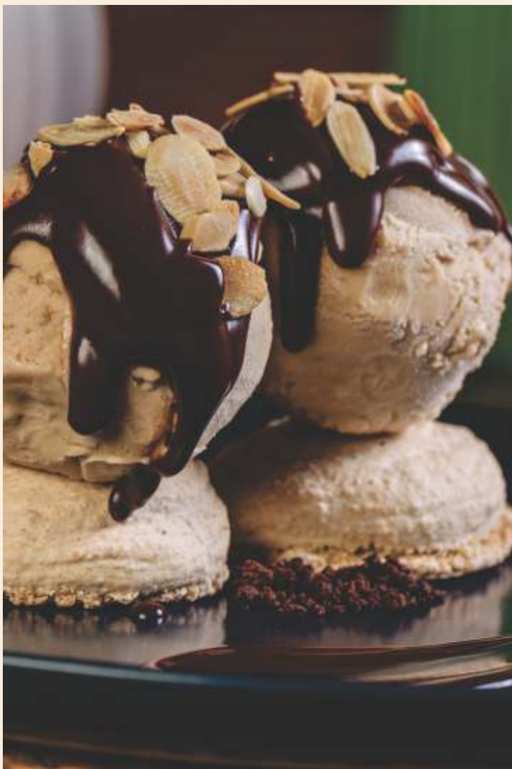
MACARON PETIT COM SORVETE DE AVELÃ