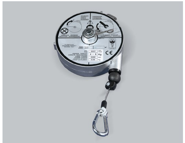
Suspensores y Equilibradores para flejadoras

Mod. TCHL: Desbloqueo a una mano con liberador.