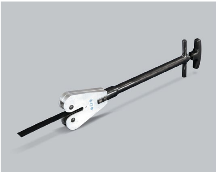
Tirador de chapas · TCH / TCHL

Ligera, manejable y sencilla, está especialmente diseñada para evitar las lesiones que puede ocasionar al operario la manipulación de chapas y flejes.