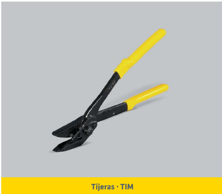
Tijeras · TIM

ANCHO DEL FLEJE (mm) : 19 / 25 / 32 ESPESOR DEL FLEJE: 0,8 - 1 mm