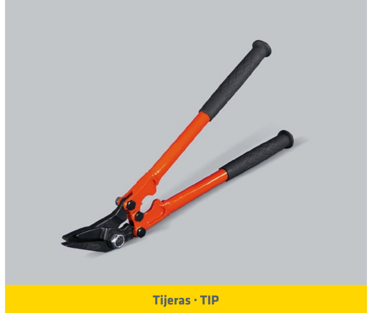
Tijeras · TIP

ANCHO DEL FLEJE (mm) : 19 / 25 / 32 ESPESOR DEL FLEJE: 0,8 - 1 mm