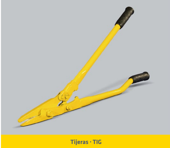
Tijeras · TIG

ANCHO DEL FLEJE (mm) : 19 / 25 / 32 ESPESOR DEL FLEJE: 0,8 - 1 mm