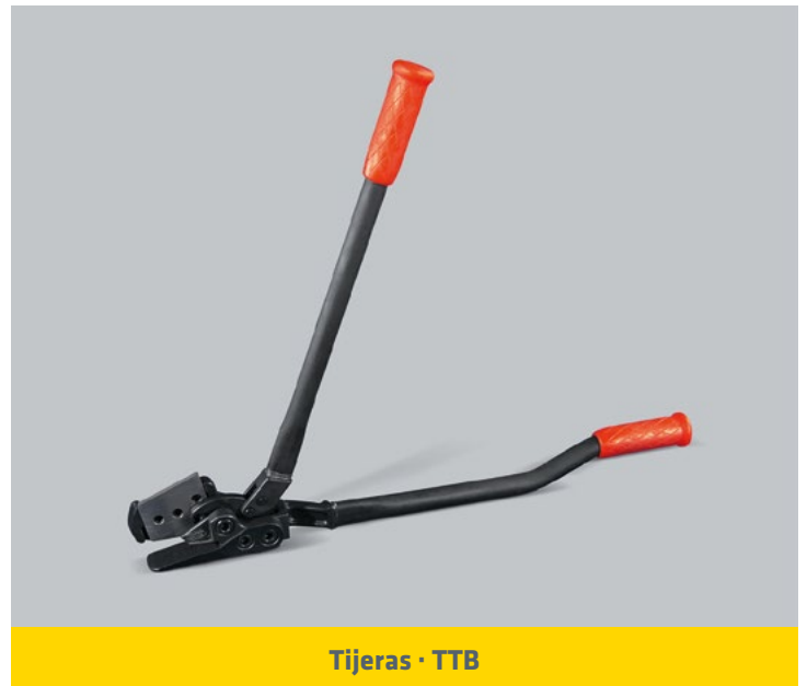
Tijeras · TTB

ANCHO DEL FLEJE (mm) : 13 / 16 / 19 / 32 ESPESOR DEL FLEJE: 0,4 - 1 mm