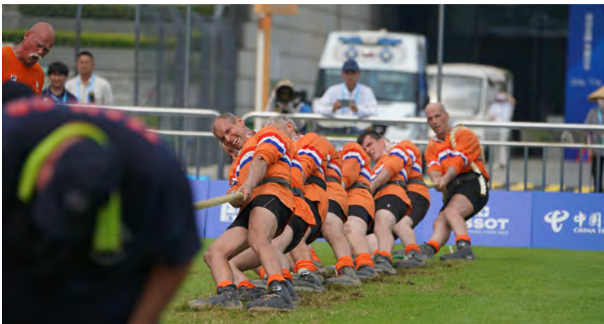
Heren 640 kg. klasse, Foto: Jelle van der Velde