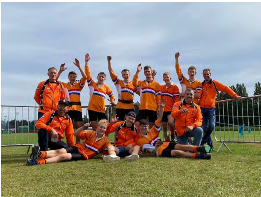
In 2025 Nederlands team, WK Engeland

De wens van zijn ouders was om zijn kist te laten dragen door zijn teamgenoten. Op deze manier konden we hem de laatste eer