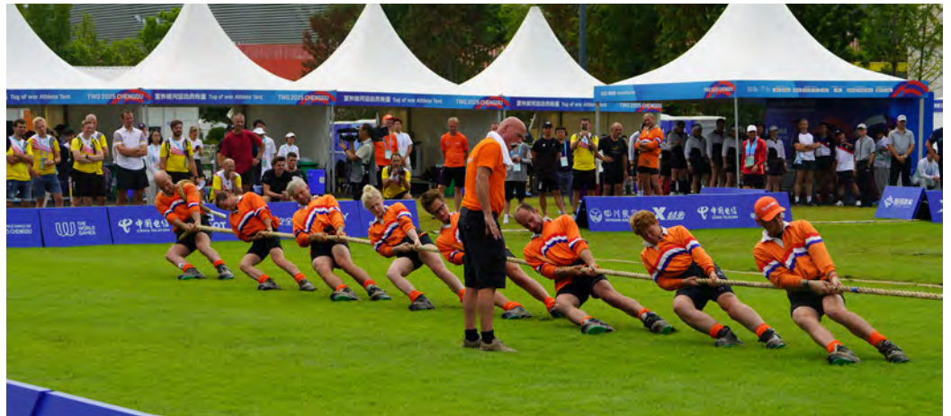
Mix 580 kg. klasse

's avonds alweer terug om 's morgens om 06.30 te landen op Frankfurt, waar Heure er uit ging en het team van Valleitrekkers door vloog naar Schiphol. Een geweldige ervaring deze World Games in China, helaas niet weten te bekronen met een prijs. Na afloop was er nog een evaluatie door NOC*NSF over de World Games, waarbij de conclusies door hen getrokken zeker van toepassing zijn op onze mooie touwtreksport. De eerste was dat op de WG niet overal de beste sporters stonden die Nederland voorhanden had, door diverse oorzaken. (geld, tijd, zin, bondsbestuur). De 2e conclusie was, dat bij de Nederlandse teams op de World Games de "performance on delivery" (presteren als het moet) onvoldoende was. Er werd beter gepresteerd op WK's en World Cup wedstrijden dan op de World Games. NOC*NSF wil, dat Nederland structureel bij de beste 10 landen ter wereld zit op