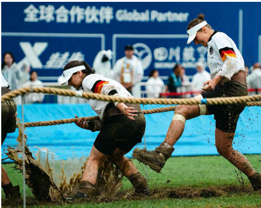
De dames klasse in de modder

De maandag was de regen gestopt en lag het veld er (heel iets) beter bij. Het mixteam mocht aantreden! In de openingstrek tegen België had Nederland weinig in te brengen, de 2e trekbeurt tegen Duitsland ging weliswaar ook verloren, maar kon er nog degelijk tegenstand geboden worden. Ook hier werd voor de 3e beurt gewisseld om vervolgens tegen Chinees Taipei een gelijkspel af te dwingen. De laatste 2 wedstrijden tegen Italië en Zwitserland werd er wel degelijk tegenstand geboden, maar werd er toch verloren. Zwitserland 1 en België 2 in de poule met 13 punten, Duitsland 3e met 7 punten en Italië 4e met 5 punten. Chinees Taipei (2 punten) en Nederland (1 punt) mochten strijden om de 5e plek. Helaas waren de krachten er meest uit bij ons mixteam en werd het de ondankbare 6e plaats voor Nederland. In de halve finales wonnen Zwitserland en België van Italië en Duitsland, waarna Duitsland het brons haalde in de kleine finale. Zwitserland won uiteindelijk de finale van België in 2 beurten.