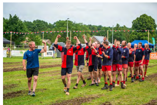
TTV Wittink op weg naar het podium

Tijdens het NK zelf was het warm, erg warm. Dit maakte de wedstrijden tot een echte uitputtingsslag. Gelukkig was er op het veld voldoende water aanwezig, waarvan dankbaar gebruik gemaakt werd om de hoofden wat koel te houden tussen de beurten door. Na afloop van de wedstrijden werd er dankbaar gebruik gemaakt van de "Jakoezie" of het aanwezige zwembad om wat verfrissing op te zoeken. Het bleef beide avonden na de wedstrijddag nog lang gezellig in de feesttent naast het veld. Op zaterdagavond werd hier zelfs nog spontaan het "staphorster kampioenschap overdekt touwtrekken" in de tent georganiseerd door de aanwezige feestgangers.