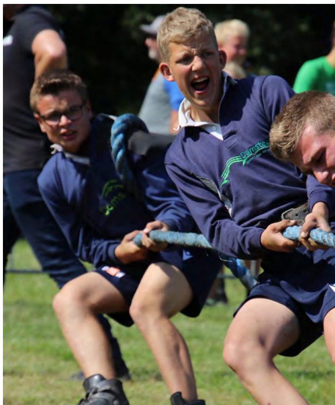
In actie voor TTV Streefkerk

bewijzen. Emotioneel zwaar en indrukwekkend om te doen, maar het voelde goed om hierop in te gaan. Met twee dappere 6-tallen hebben we de kist zowel tijdens de uitvaartdienst naar binnen gedragen, als er weer uit richting de begraafplaats.