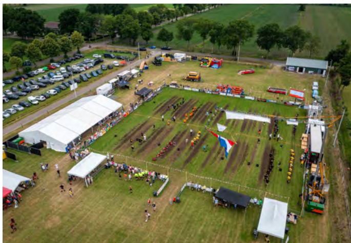
Een foto vanuit de lucht van het wedstrijdterrein

Vanaf dat moment zijn wij met alle leden van onze kleine vereniging hard aan het brainstormen gegaan. Ook hebben we veel contact gehad met andere verenigingen die het NK de