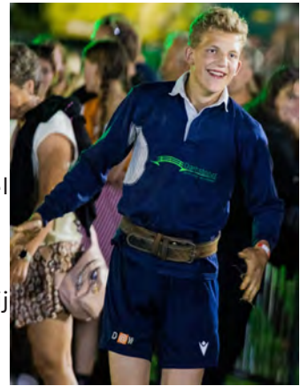
In 2024 Koudekerk a/d Rijn

Een van zijn grootste dromen was om Nederlands kampioen te worden. Dankzij jaren hard trainen, discipline en doorzettingsvermogen, heeft hij die droom afgelopen jaar samen met zijn teamgenoten mogen waarmaken. Dat maakte hem intens trots - en wij waren trots op hém.