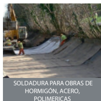
SOLDADURA PARA OBRAS DE HORMIGÓN, ACERO, POLIMÉRICAS