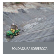
SOLDADURA SOBRE ROCA