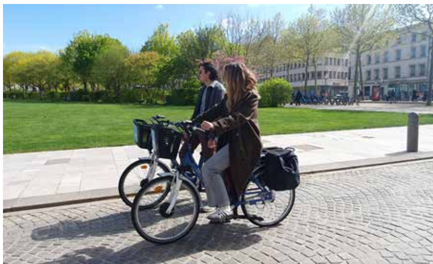
Ville de Niort

Niort Agglo et Transdev, opérateur du réseau tanlib, participent à l'opération nationale Mai à vélo, destinée à promouvoir la pratique du vélo auprès du grand public. Tout au long du mois, plusieurs rendez-vous viendront rappeler l'enjeu croissant des mobilités douces sur le territoire.