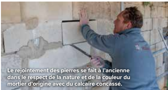
Le rejointement des pierres se fait à l'ancienne dans le respect de la nature et de la couleur du mortier d'origine avec du calcaire concassé.