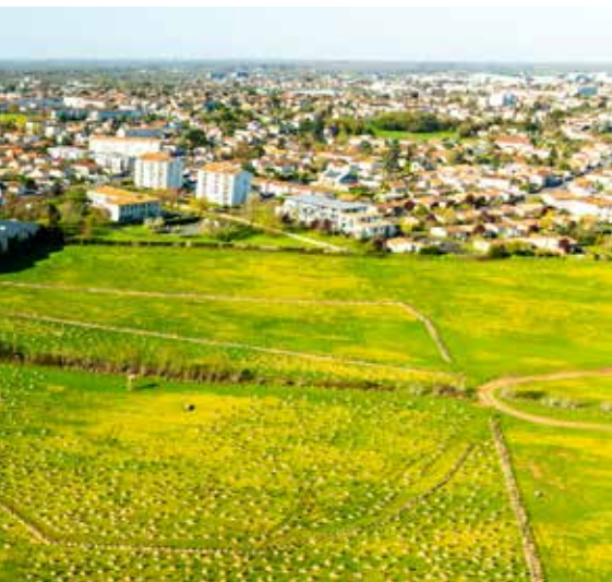
Unité 5 Production