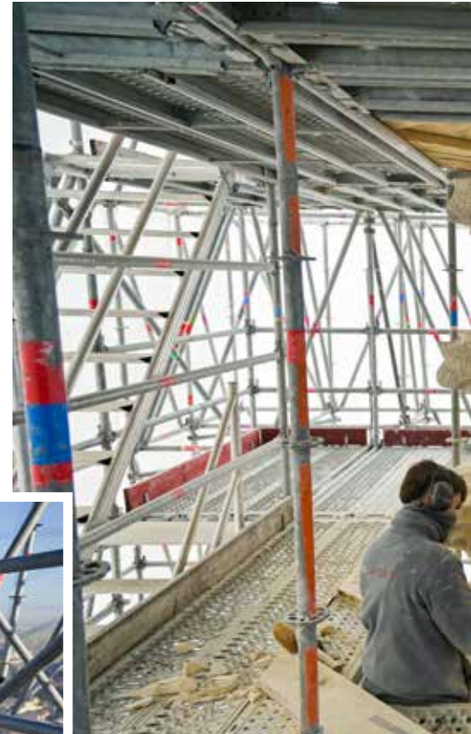
Taillée à l'ancienne, à la main par les compagnons de l'entreprise Somebat, la pierre sommitale est une création originale pour l'église Notre-Dame qui a retrouvé son fleuron disparu depuis le début du XIX e siècle. Il mesure 77 cm de haut et 62 cm de diamètre.

La 2 e tranche démarrera en juin et concernera la restauration du clocher avec l'intervention de restaurateurs-conservateurs de pierres sculptées à environ 40 mètres en haut. À partir des croquis de restitution de l'Architecte du Patrimoine, ils travailleront sur les statues, dont ils compléteront les fragments manquants, les gargouilles et autres décorations en pierre de ce remarquable édifice de style gothique. ●