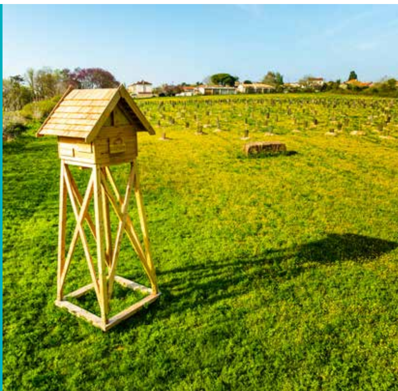
Unité 5 Production

Retrouvez la vidéo de la tour à chauves-souris sur Niort TV en scannant ce QR code