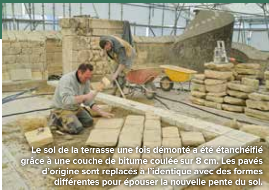
Le sol de la terrasse une fois démonté a été étanchéifié grâce à une couche de bitume coulée sur 8 cm. Les pavés d'origine sont remplacés à l'identique avec des formes différentes pour épouser la nouvelle pente du sol.

Depuis novembre 2025, l'entreprise locale Somebat restaure la tour nord en alliant méthodes traditionnelles et outils modernes. Un tailleur de pierre et deux apprentis, ainsi que trois maçons, œuvrent conjointement sur ce chantier qui s'achèvera en janvier 2027. Des menuisiers interviennent sur les fenêtres et la main courante de l'escalier, tandis que des métalliers réalisent les garde-corps de la terrasse. Un nouveau métier, celui d'étancheur, participe à la mise hors d'eau de l'ouvrage