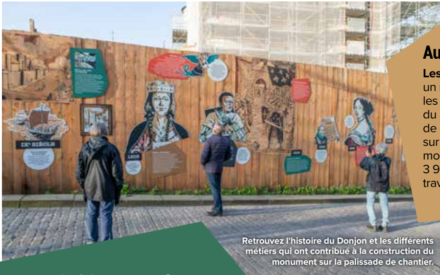
Retrouvez l'histoire du Donjon et les différents métiers qui ont contribué à la construction du monument sur la palissade de chantier.