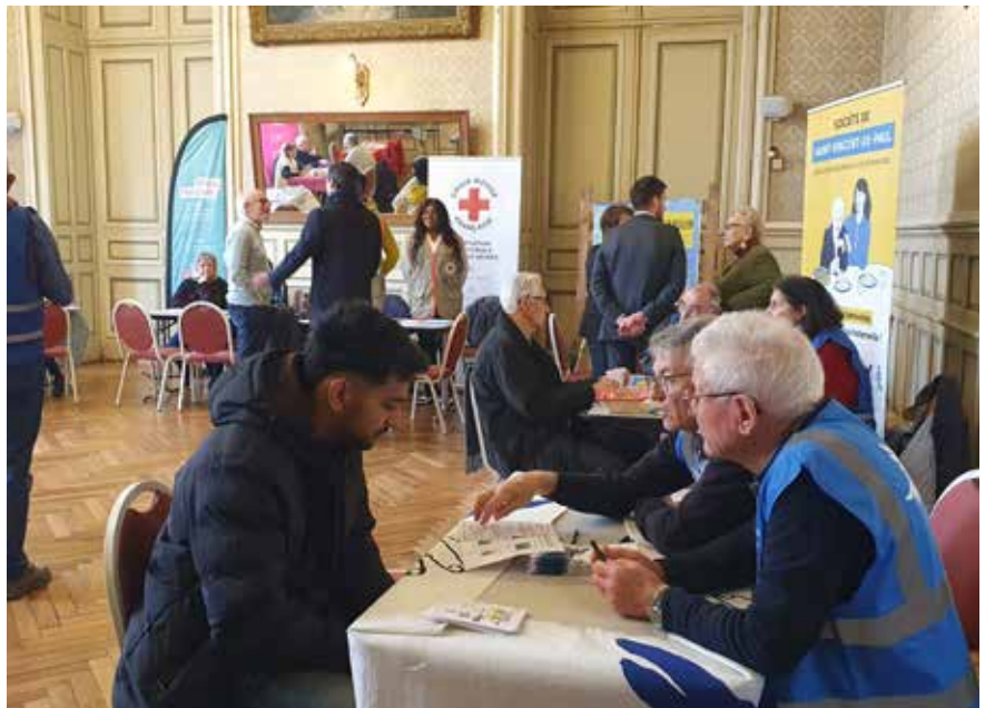
Ville de Niort

N ombreux sont celles et ceux qui souhaitent se rendre utiles, agir pour les autres et participer à la solidarité locale, sans toujours savoir par où commencer. Le Forum du bénévolat a justement pour vocation de faciliter ce premier pas, en créant un espace d'échange direct entre habitants et associations. Une rencontre, une discussion, et l'envie d'aider peut rapidement se transformer en engagement. Les besoins sont nombreux et les formes d'implication très variées : participation aux maraudes, aide aux