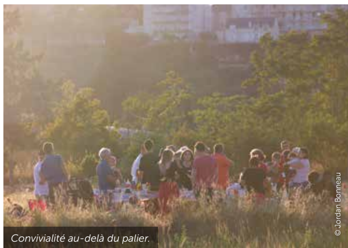
Convivialité au-delà du palier.