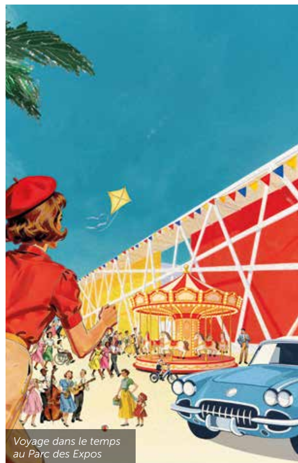
Voyage dans le temps au Parc des Exos