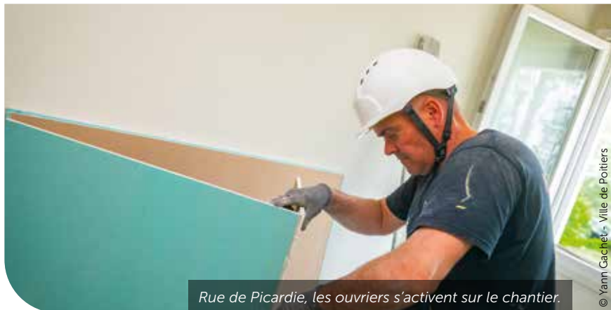
Rue de Picardie, les ouvriers s'activent sur le chantier.