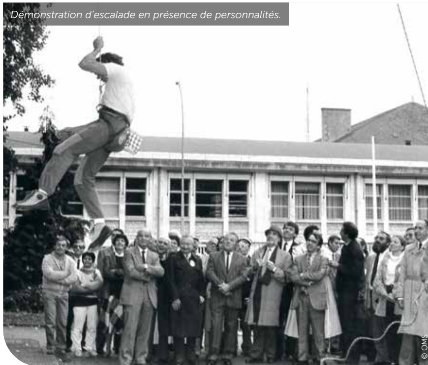
Démonstration d'escalade en présence de personnalités.