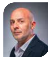
Francis GOTTI Évaluation des politiques publiques