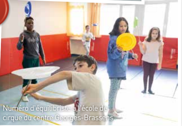
Numéro d'équilibriste à l'école de cirque du centre Georges-Brassens