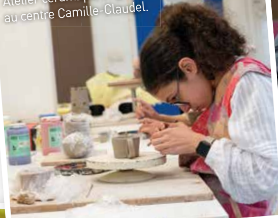
Atelier céramique et gravure au centre Camille-Claudel.