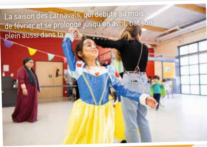
La saison des carnivals, qui débute au mois de février et se prolonge jusqu'en avril, bat son plein aussi dans ta ville.