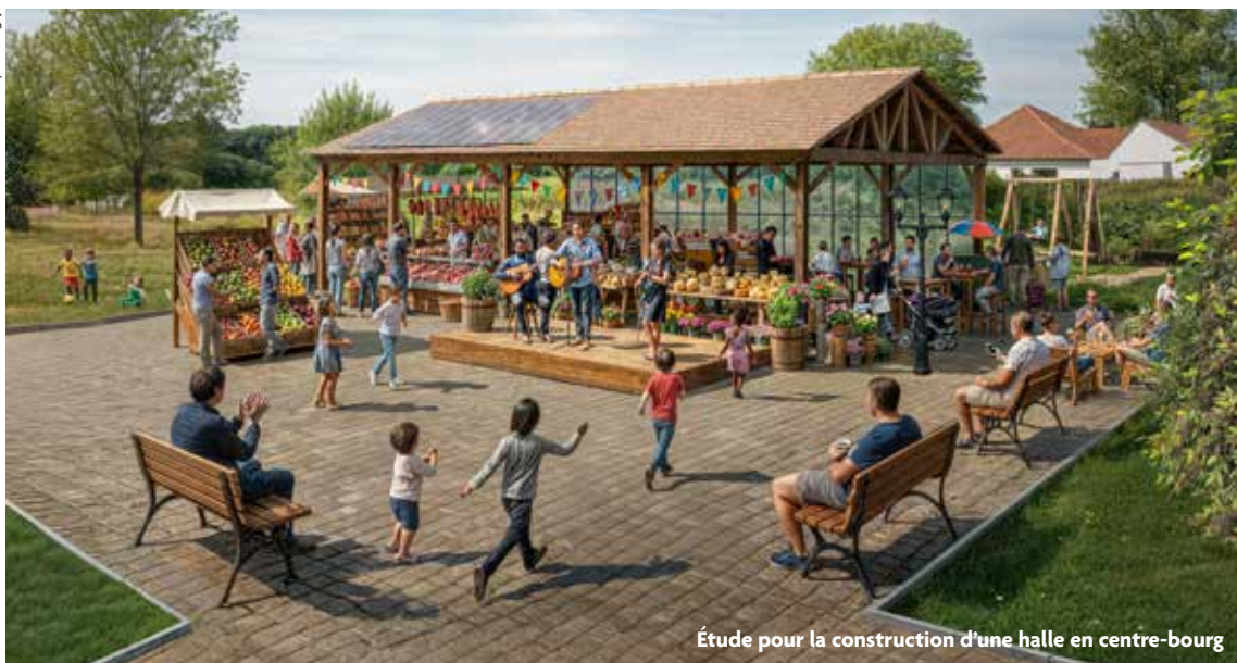
Étude pour la construction d'une halle en centre-bourg