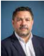
GWENN LE NAY, Maire de Plouay 7 e vice-président Patrimoine communautaire et intelligence numérique du territoire