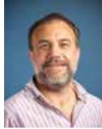
MARC BOUTRUCHE, Maire de Quéven 2 e vice-président Planification, aménagement du territoire