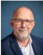
GILLES CARRÉRIC, Maire de Lanester 8 e vice-président Sport et équipements d'intérêt communautaire