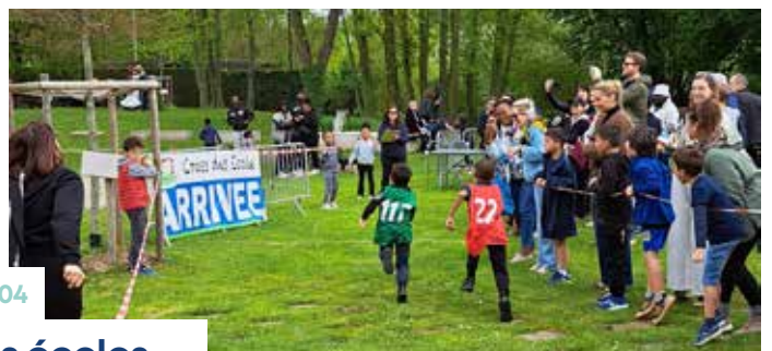
Cross des écoles