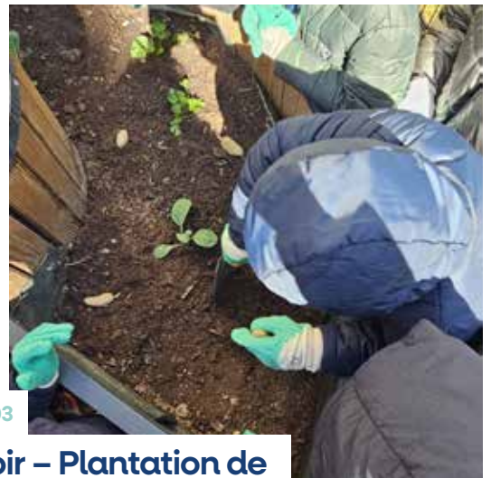
École Auguste Renoir – Plantation de légumes dans le jardin composteur