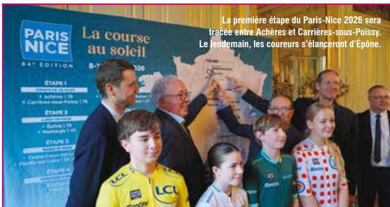
La première étape du Paris-Nice 2026 sera tracée entre Achères et Carrières-sous-Poissy. Le lendemain, les coureurs s'élanceront d'Épône.