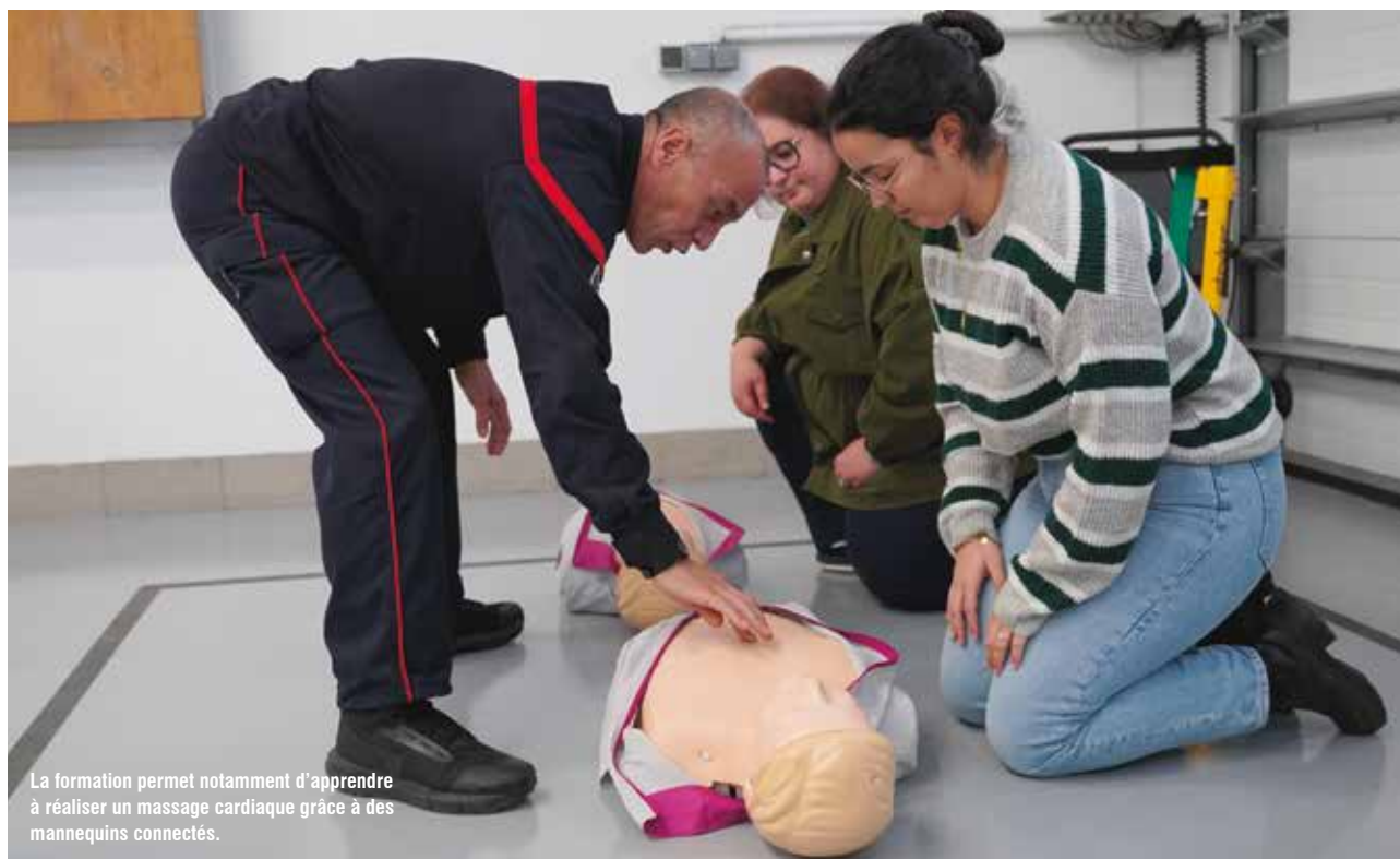
La formation permet notamment d'apprendre à réaliser un massage cardiaque grâce à des mannequins connectés.

Le Service départemental d'incendie et de secours (SDIS 78) a ouvert les portes d'un lieu unique en France, la Maison des sapeurs-pompiers dans l'ancienne caserne de Viroflay, dédié à la sensibilisation et à la formation des citoyens aux risques, aux gestes et comportements qui sauvent.