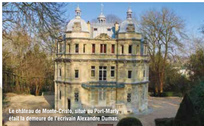
Le château de Monte-Cristo, situé au Port-Marly, était la demeure de l'écrivain Alexandre Dumas.

Dans les Yvelines, on dénombre 14 lieux culturels labellisés « Maisons des Illustres ». Des lieux uniques, ayant appartenu à des artistes de renommée nationale, voire internationale.