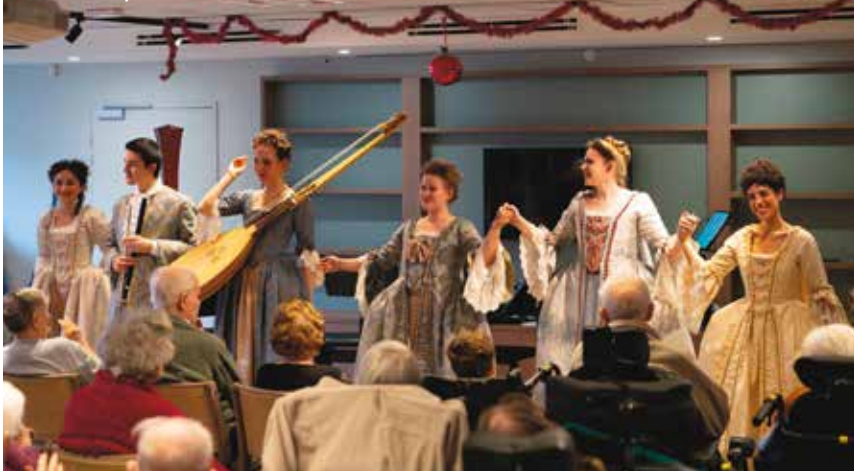
L'Opéra Royal de Versailles a rendu visite aux résidents de l'EHPAD Lépine en décembre 2025 à Versailles.