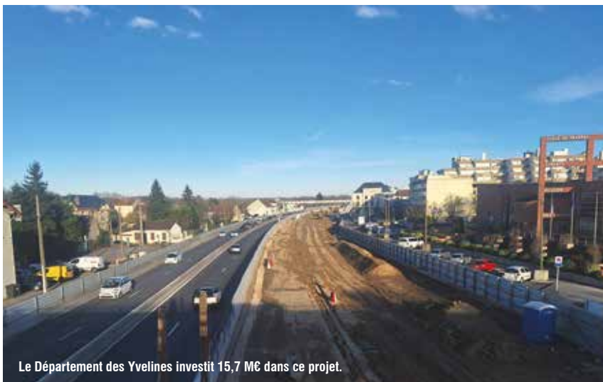
Le Département des Yvelines investit 15,7 M€ dans ce projet.

La requalification de la RN10 s'intègre dans un large projet de rénovation urbaine qui vise à réunifier la ville de Trappes, séparée en deux par cet axe où passent chaque jour 80 000 véhicules. Le chantier est aujourd'hui dans sa phase la plus conséquente, l'enfouissement de la route.