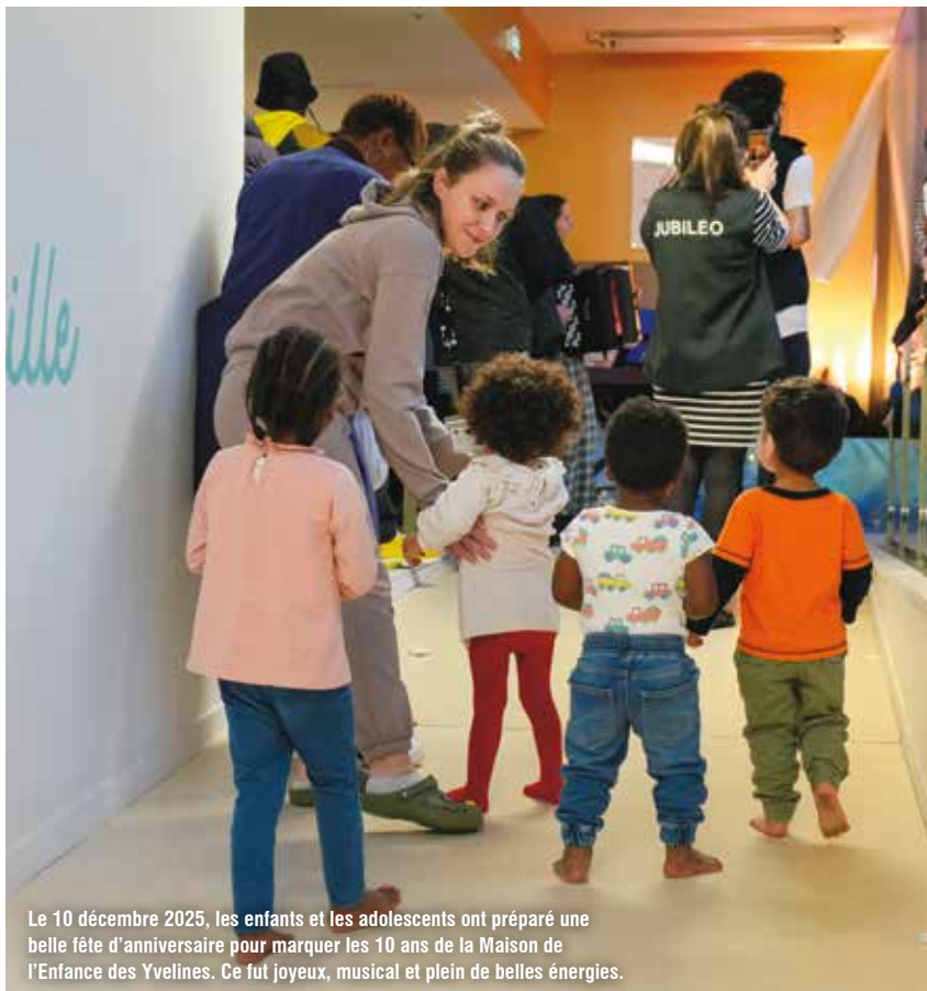
Le 10 décembre 2025, les enfants et les adolescents ont préparé une belle fête d'anniversaire pour marquer les 10 ans de la Maison de l'Enfance des Yvelines. Ce fut joyeux, musical et plein de belles énergies.

La Maison de l'Enfance des Yvelines (MEY) est le seul établissement départemental assurant un service d'accueil inconditionnel d'urgence. Depuis 2015, elle prend en charge des mineurs en danger ou en situation de crise, confiés au titre de l'Aide Sociale à l'Enfance (ASE). La MEY accueille 68 enfants âgés de 0 à 18 ans.