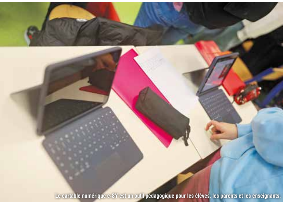
Le cartable numérique e-SY est un outil pédagogique pour les élèves, les parents et les enseignants.

Depuis plusieurs années, le Département accompagne les collégiens avec la distribution de cartables numériques. Suite à la réorientation du dispositif, ce sont les élèves et enseignants des établissements publics volontaires qui pourront bénéficier de ce projet numérique.