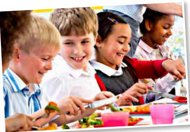
↖ Avoir, à la cantine, de bons repas à moindre coût