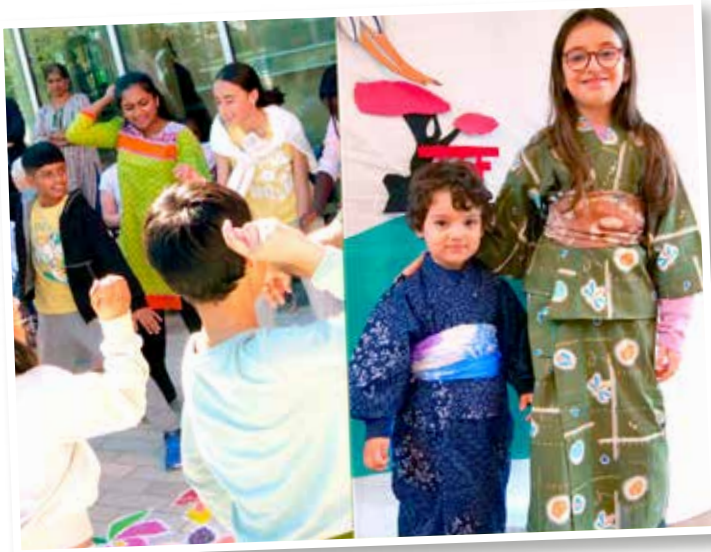
↖ Découvrir de multiples cultures