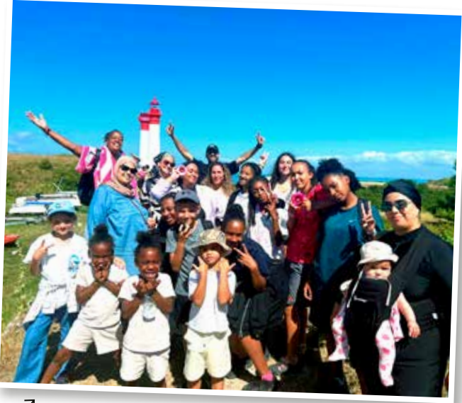
↑ Partir en vacances en famille ou entre amis