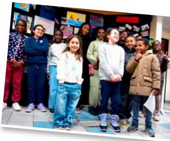
↓ Exposer ses œuvres