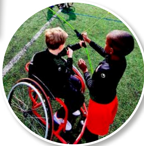
↖ Être inclusif et solidaire