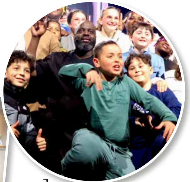
↑ Côtoyer des stars !