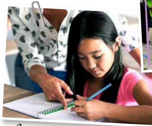
↖ Être soutenu dans ses études