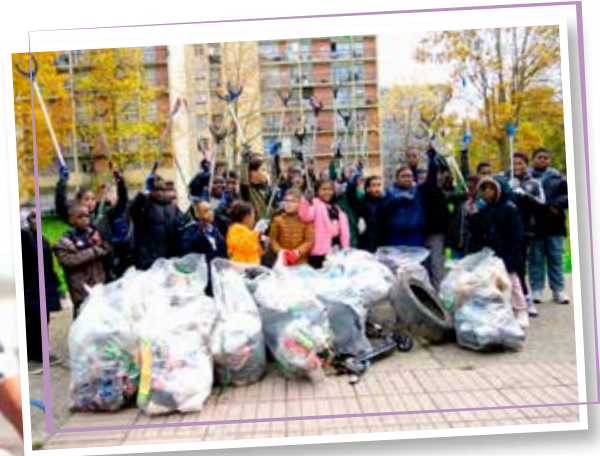
↖ Prendre soin de son environnement