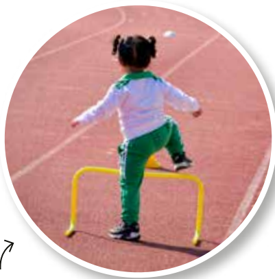
↖ Sprinter avec l'École municipale des Sports