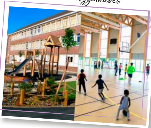
↓ Avoir de belles écoles et de nouveaux gymnases