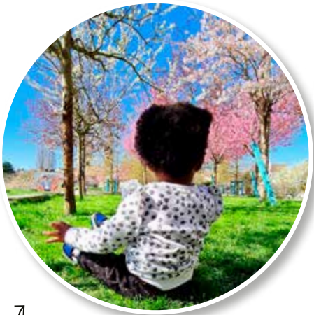
↑ Profiter des jolis parcs