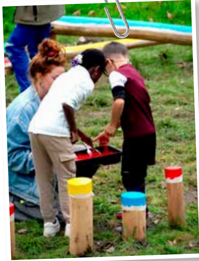
↑ Dessiner son quartier