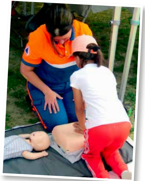
↑ Un jour, peut-être, sauver des vies