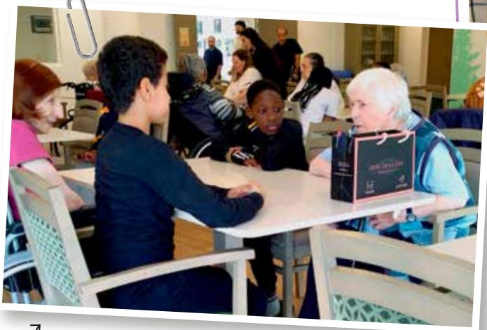
↖ Prendre soin de ses aînés