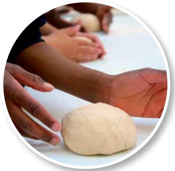
↑ Acquérir un savoir-faire