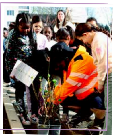
↑ Jardiner avec les agents de la Ville