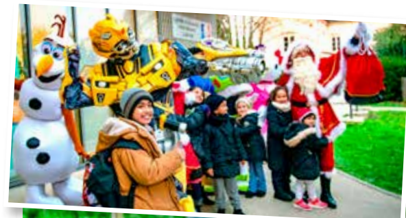
↖ Profiter de l'hiver comme de l'été!