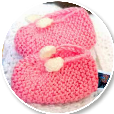
↑ Penser à moi avant que je ne sois là !