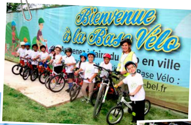
La Base vélo et les pistes cyclables