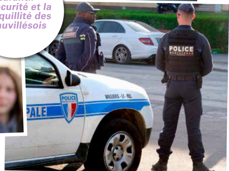
La Police municipale