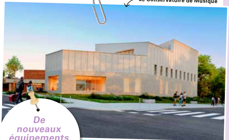
Le Conservatoire de Musique

De nouveaux équipements culturels et sportifs