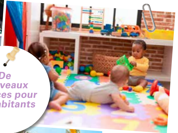
De nouvelles crèches