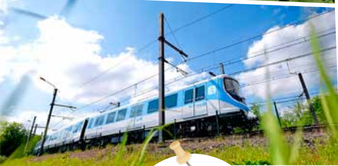
La ligne de métro 19

De nouveaux équipements culturels et sportifs