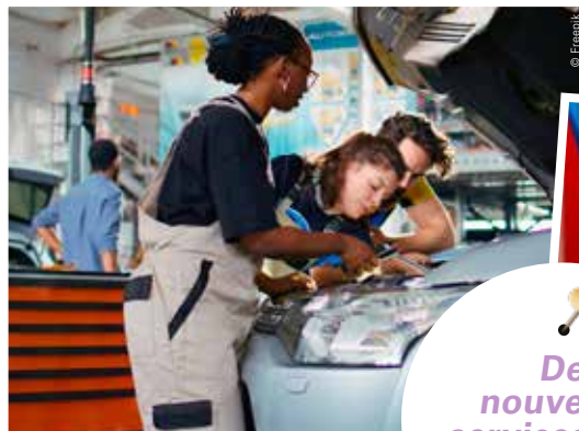
Un garage solidaire