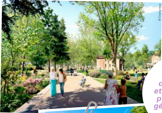
Le grand parc central de Derrière-les-Murs et du Puits-la-Marlière

À l'horizon 2032, les Beauvillésoises et Beauvillésois auront bénéficié d'un cadre vie amélioré avec d'importantes constructions finalisées ou engagées, et la mise en place de nouveaux services. Voici un petit échantillon des réalisations à venir.