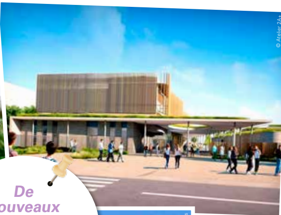
Le futur collège

De nouveaux établissements scolaires et des écoles rénovées