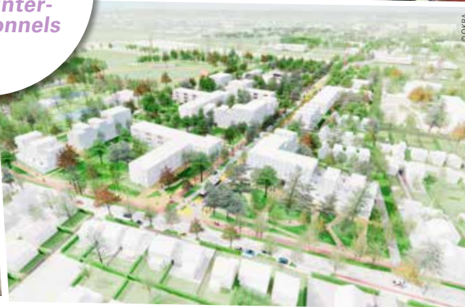
La gare Villiers-le-Bel/ Gonesse-Arnouville aux Carreaux