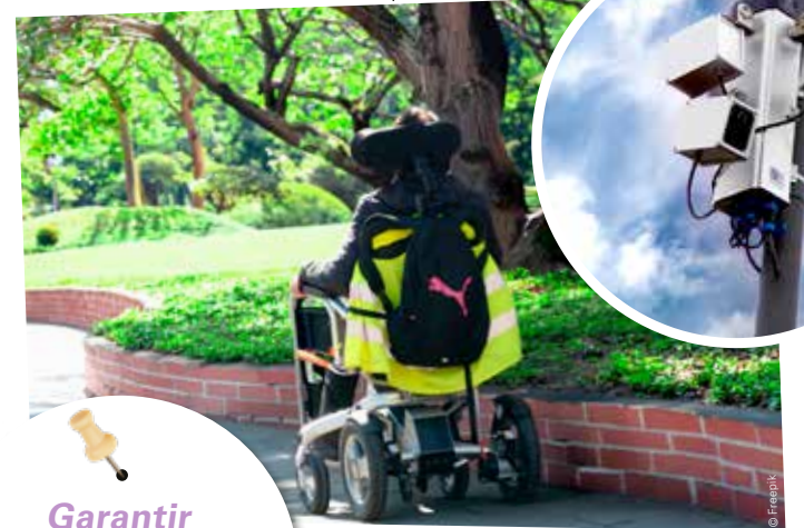
Assurer l'accessibilité pour tous

Garantir la sécurité et la tranquillité des Beauvillésois