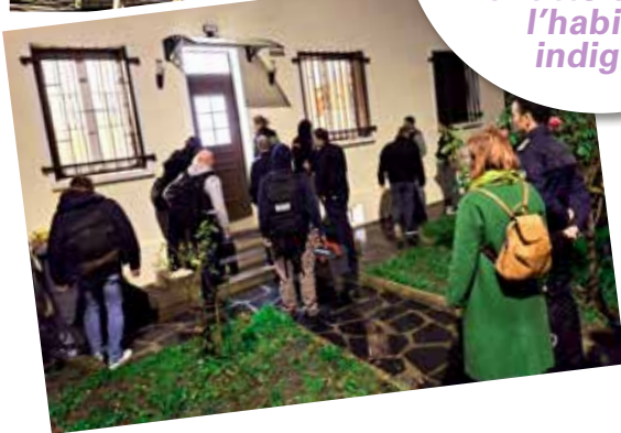
Lutter contre les marchands de sommeil