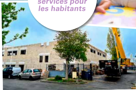
Le futur centre d'imagerie médicale