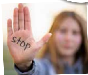
Lutter contre toutes les formes de violence

Garantir la sécurité et la tranquillité des Beauvillésois