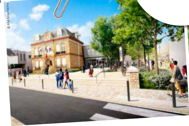
Le parc de la Mairie au Village

Des quartiers désenclavés et des espaces publics inter-générationnels