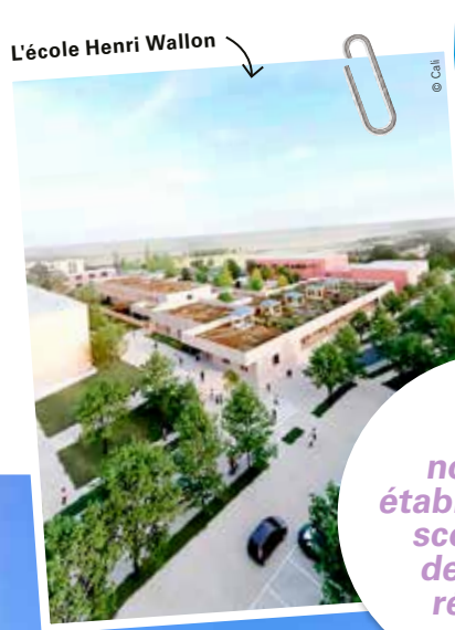
L'école Henri Wallon

De nouveaux établissements scolaires et des écoles rénovées