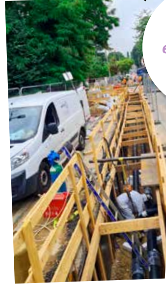
Les travaux de géothermie

De futurs logements adaptés, des copropriétés sauvegardées, la lutte contre l'habitat indigne