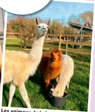
Les animaux de la ferme