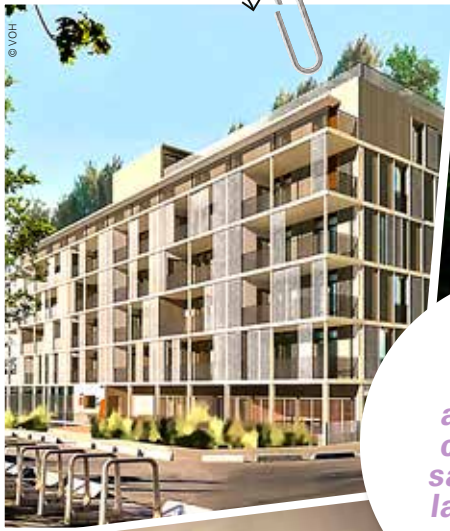
La résidence égalitaire