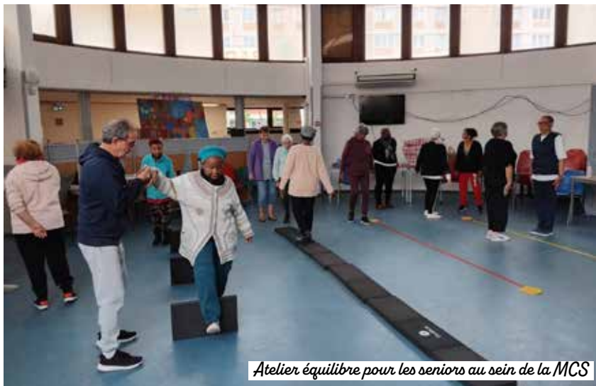
Atelier équilibre pour les seniors au sein de la MCS

plémentaires : la Croix-Rouge française, le Secours catholique, le Secours populaire et les Compagnons Bâtisseurs. Distribution de repas et de vêtements, accompagnement social, cours de français, ateliers de bricolage ou chantiers d'insertion : ce lieu est entièrement dédié aux solidarités et à l'entraide.