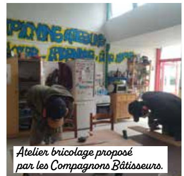
Atelier bricolage proposé par les Compagnons Bâtisseurs.

Les Compagnons Bâtisseurs sont présents avec un atelier installé à la Maison communale des solidarités. Notre association d'éducation populaire lutte contre le mal-logement en aidant les habitants à améliorer leurs conditions de vie. Nous réalisons les travaux avec eux, tout en proposant des animations collectives et des initiations au bricolage. Le fait de partager ce lieu avec trois autres associations est très positif. Chacune est représentée au sein du Conseil, ce qui permet de monter des projets communs, comme des chantiers collectifs. L'objectif est clair : développer plus d'actions ensemble, être plus visibles et permettre à davantage d'habitants de bénéficier de nos actions communes.