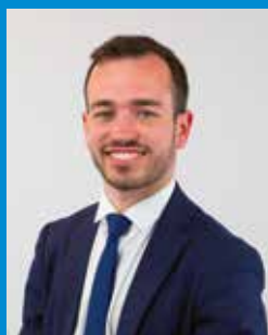
Quentin LE GAILLARD Maire de Concarneau