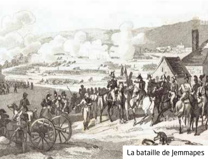
La bataille de Jemmapes

Le gros de la troupe va rejoindre le 1 er bataillon de Saint-Denis. De leur participation aux différentes opérations, nous ne savons pas grand-chose, sinon qu'ils étaient principalement utilisés dans des opérations de reconnaissance. C'est après la bataille de Jemmapes (6 novembre 1792) qu'ils vont faire parler d'eux en suscitant ce qu'il convient d'appeler une rébellion. De cet épisode, nous disposons de deux versions conservées aux archives communales : celle de l'autorité militaire et celle des intéressés eux-mêmes.