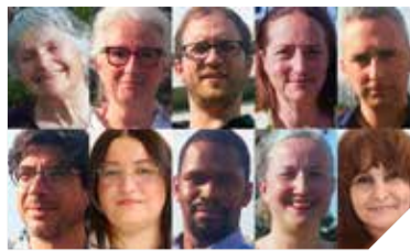
LES ÉCOLOGISTES, GÉNÉRATION.S, CITOYENS