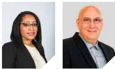
GRUPE NANTERRE POUR TOUTES ET TOUS