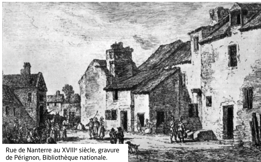
Rue de Nanterre au XVIII e siècle, gravure de Pérignon, Bibliothèque nationale.