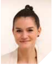
GROUPE NANTERRE ENSEMBLE