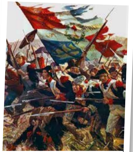
La bataille de Jemmapes (détail)