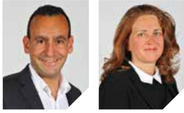
GROUPE NOUS SOMMES NANTERRE

Pour nous écrire : nanterreensemble92@gmail.com