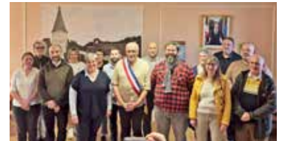
Le conseil municipal de Chezal-Benoît