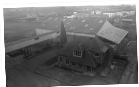
Usine Laprade, avenue Jean Bonnefont vers 1950