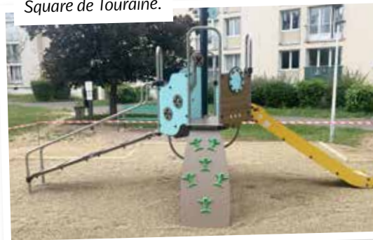
Square de Touraine.