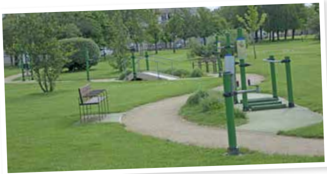
Un parcours de santé seniors est installé au parc François-Mitterrand depuis septembre 2022.

Pour les plus sportifs, une station de Street-Workout est installée au parc des Champs d'Amour, à proximité du lycée et du gymnase Cligman et un parcours de santé est proposé au parc des Champs d'Amour. À Frapesle, essayez l'aire de jeux avec une station de résistance.