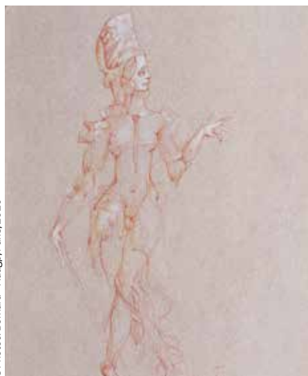
Leonor Fini, Les fêtes secrètes n°10 , 1977-1982.