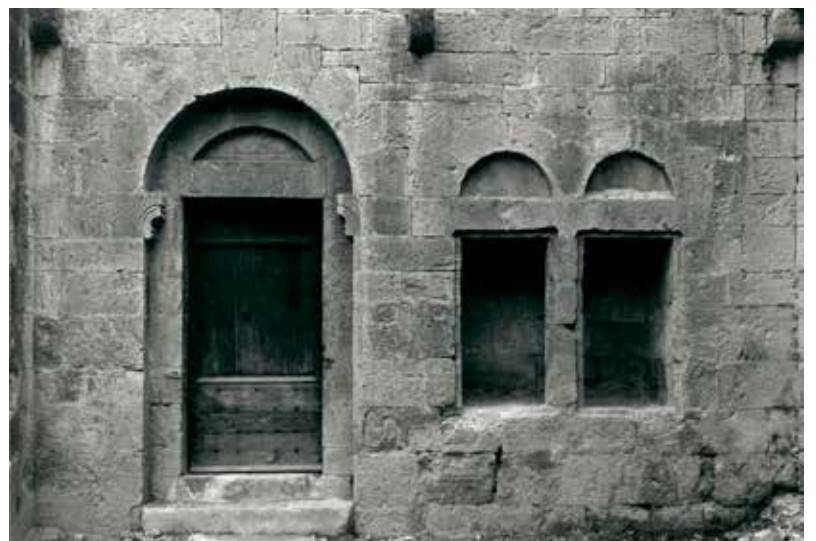
1991 : porte des convers et armarium

On ignore le temps exact qu'il fallut aux bâtisseurs pour élever l'église abbatiale. La pierre calcaire, le tuf et le sable de la Brague étaient extraits à proximité puis travaillés sur place, permettant à la fois de réduire coûts et efforts du transport et d'intégrer