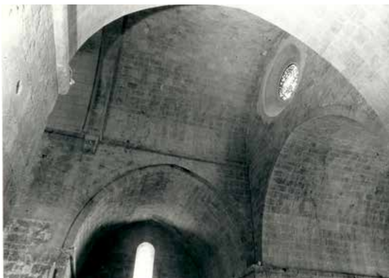
1971 : croisée de transept collection abbyvalb