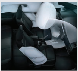
7 airbags de serie.

DISPONIBLE ○ | NO DISPONIBLE x | DISPONIBLE SOLO EN VERSIONES AUTOMÁTICAS △