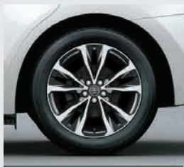
Llantas de aleación de 17".