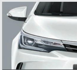
Ópticas delanteras Bi-LED.