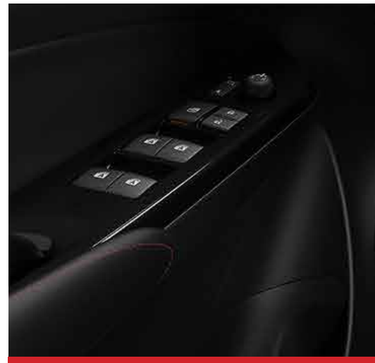
Levanta cristales eléctricos con función "one touch" en las cuatro puertas. 1