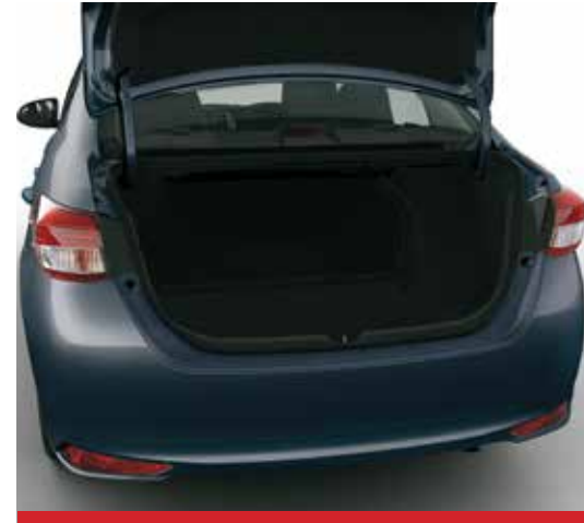
Apertura de baúl con comando a distancia. 1