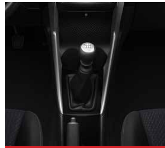
Caja Manual de 6 marchas. 1