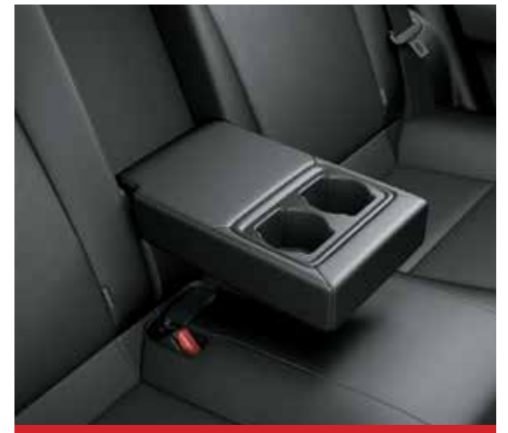
Apoyabrazos trasero. 2