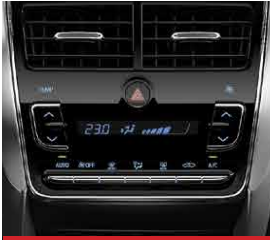
Climatizador Automático Digital. 2