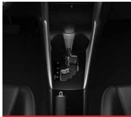
Caja automática CVT de 7 velocidades con control de velocidad crucero. 1