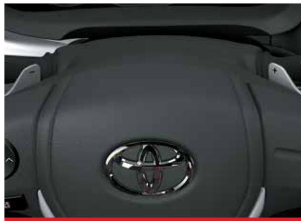
Paddle Shifts (levas en el volante). 1