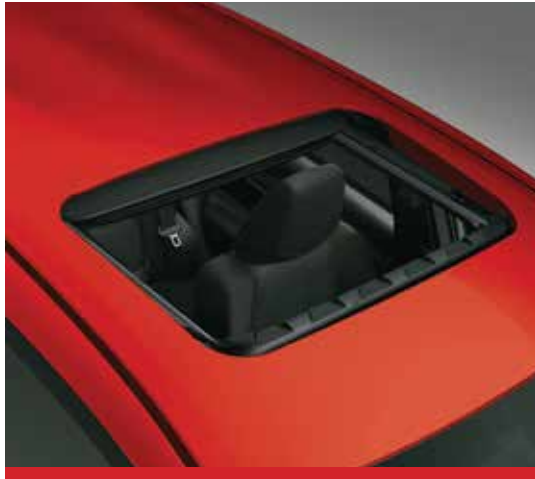
Techo solar eléctrico. 1