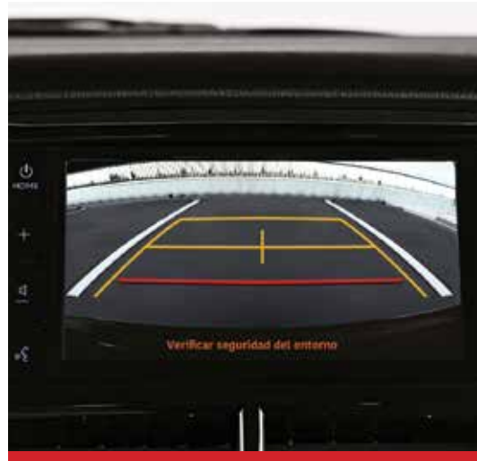
Cámara de Estacionamiento. 1