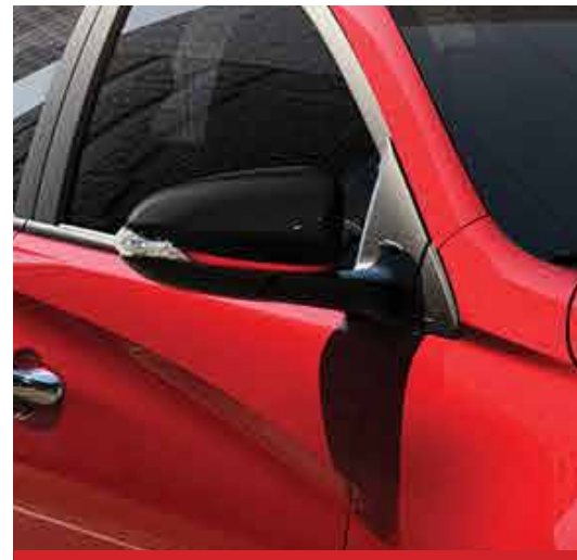
Espejos retráctiles eléctricamente. 1