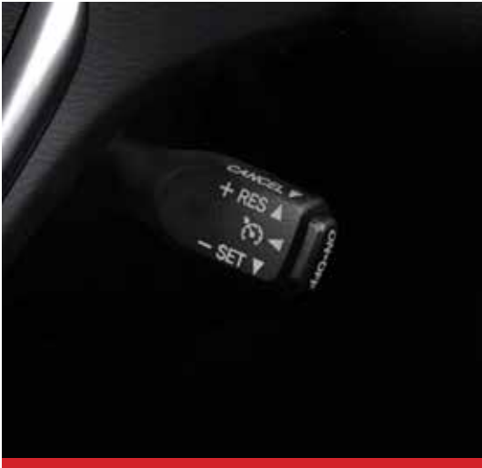
Control de velocidad Crucero. 2