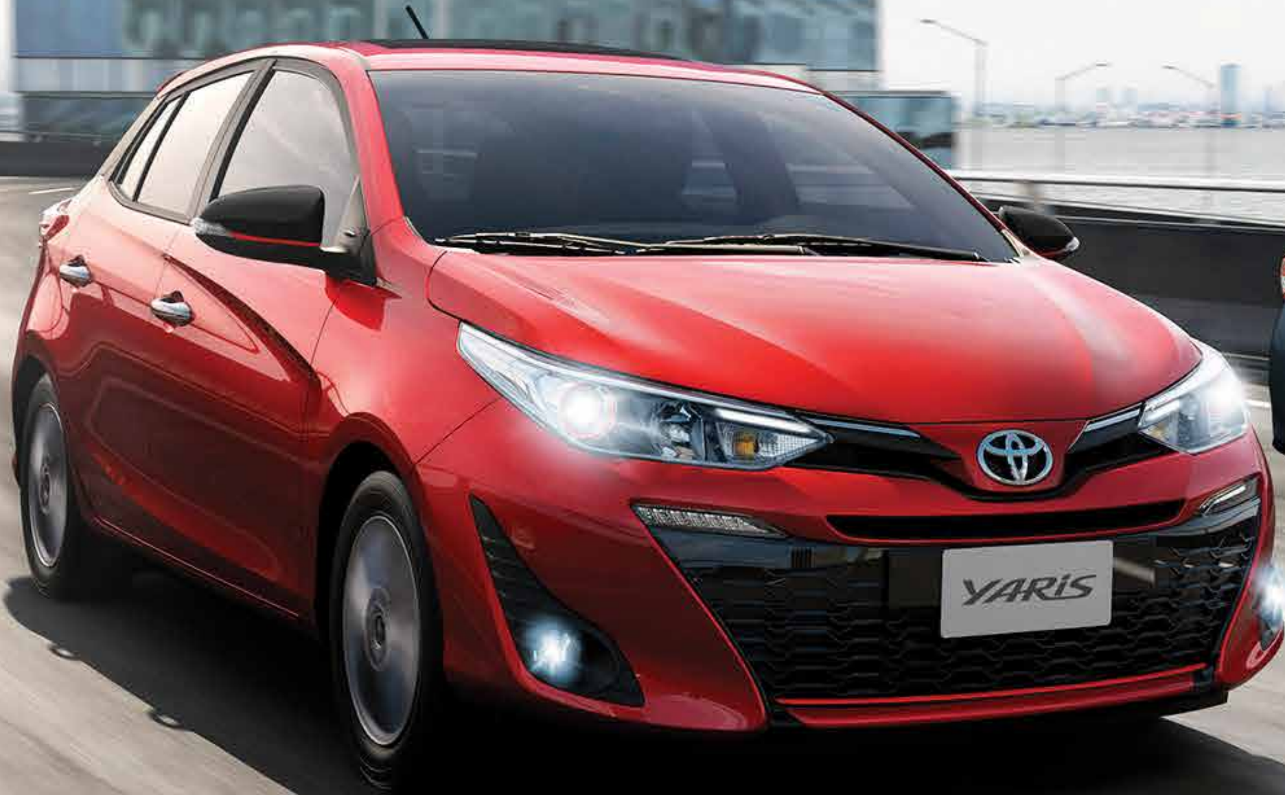
Imagen correspondiente a las versiones S Hatchback y XLS Pack Sedán.