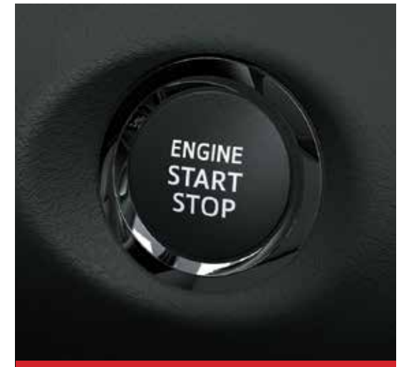
Sistema de apertura y cierre de puertas "Smart Entry System" y encendido por botón "Push Start Button". 3