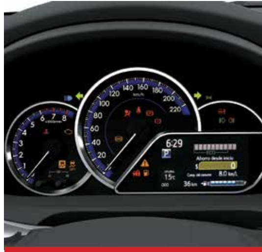
Display de información múltiple de 4,2". 1