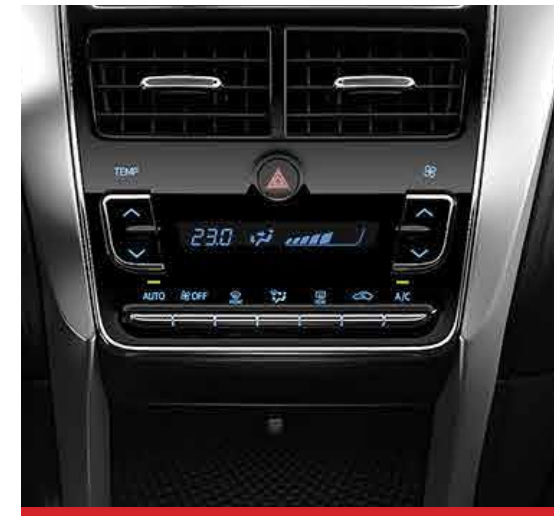
Aire acondicionado con climatizador automático digital. 1