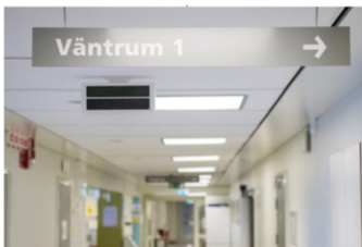
Protesterna mot planerna att centralisera vården blev massiva, menar debattörer.

Men är Centerpartiet ett undantag? Vi kan bara konstatera att det är skillnad på vad man säger och vad man gör vilket bevisas av Centerpartiets aktuella uppslutning för en centralisering av sjukvården i Skaraborg. Protesterna mot planerna att centralisera vården blev massiva. Under lördagen den 9 september 2023 demonstrerade över 12 000 personer till stöd för sjukhuset i Lidköping. Folkets demokratiska viljetrytning