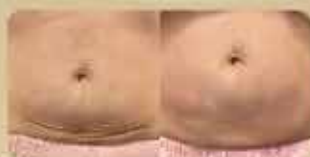
妊娠紋 Striae Gravidarum