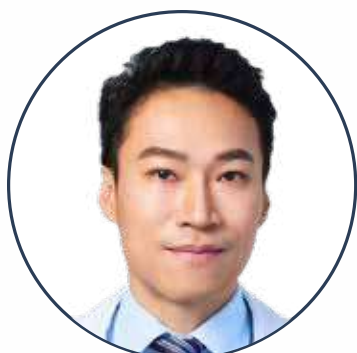
陳湧仁 醫師 中華民國臨床非侵襲癌 治療研究學會 理事長