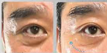
男 65歲 使用一次後