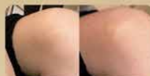
生長紋 Stretch Marks