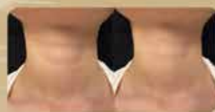
脖紋 Neck Lines