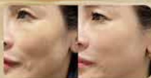
頰凹 Sunken Cheeks