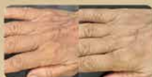
手背 Back of the Hand