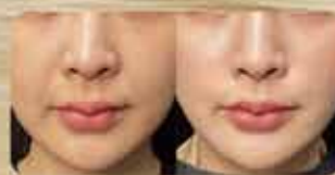
法令紋 Nasolabial Folds