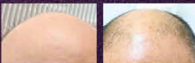
男 51歲 使用八週後

GOG外泌體精粹內含豐富的生長因子以及多種生物活性成分，能刺激膠原蛋白生成，改善肌膚健康和彈性。有效延緩老化、恢復肌膚年輕狀態。