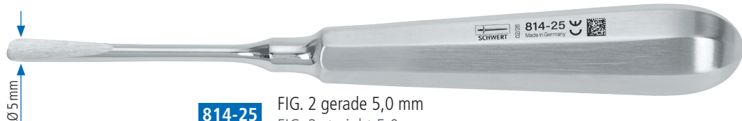
814-25 FIG. 2 gerade 5,0 mm FIG. 2 straight 5.0 mm