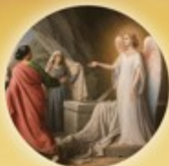
Solemnidad de la Pascua 20 de abril