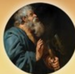
Festividad de San Matías 5/14