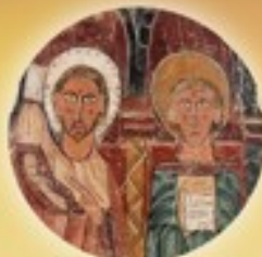
Festividades de San Felipe y Santiago 3 de mayo