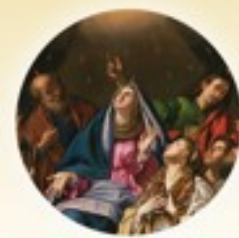
Solemnidad de Pentecostés 8 de junio

Como católicos, celebramos la Temporada de Pascua desde el Domingo de Pascua hasta Pentecostés. Este año, la Temporada de Pascua está marcada por tres solemnidades y tres festividades, y también observamos el Mes de María en mayo. Conozca más acerca de estas grandes festividades y solemnidades y sobre cómo celebrar la Temporada de Pascua en archseattle.org/Easter .