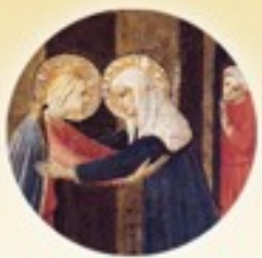
Visitación de la Santísima Virgen María 31 de mayo