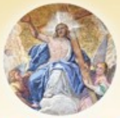
Solemnidad de la Ascensión 1° de junio